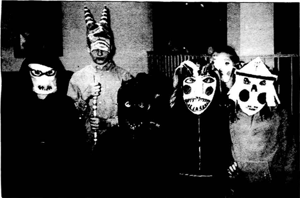
Užgavėnės! Labai linksmi šią šventę vasario 9 d. savo mokykloje atšventė Čikagos lituanistinės mokyklos vaikai, patys pasigaminę įvairių, spalvingų kaukių. Jas užsidėjus sunku buvo save patį ar draugą atpažinti!