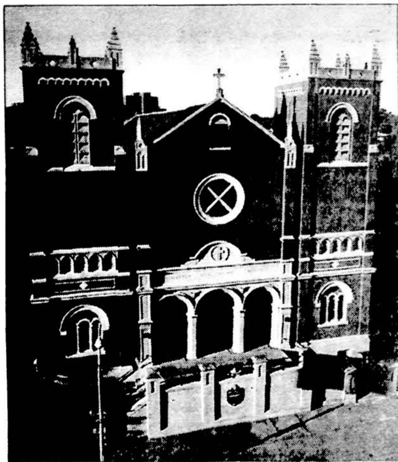
Švč. Trejybės parapijos bažnyčia Hartforde, Connecticut (2001 m.)

• Lietuvos žmonės labiausiai pasitiki Bažnyčia (65.1 proc.) ir žiniasklaida (62.1 proc.). III vietoje yra prezidento institucija, pasitikėjimas kuria per mėnesį truputį pakilo ir saūs sudaro 54.9 proc. Kelias procentais per mėnesį padidėjo pasitikėjimas vyriausybe, „Sodra“, policija, kariuomene, savivaldybėmis, Lietuvos banku, teismais. Paskutiniai ir toliau lieka Seimas ir partijos.