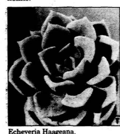
Echeveria Haageana. Labai patrauklus sukulentų šeimos narys yra Echeveria. Jie primena „žalią žiedą“, gražiai išsiskleidusį vazono paviršiuje, tiesiai iš žemės.

Labai patrauklus sukulentų šeimos narys yra Echeveria. Jie primena „žalią žiedą“, gražiai išsiskleidusį vazono paviršiuje, tiesiai iš žemės. Viena šių augalų rūšių yra „ziemkentėlė“, pakencinė net Amerikos vidurio vakarų žiemai. Tai vadinamoji „Višta su viščiukais“ (Hen and chickens) — Echeveria secunda. Lietuvoje šį augalą vadinavo „žemės žiedu“, o populiariausias angliškas vardas kilęs iš to, kad pagrindinis augalas — t.y. „višta“ — apie save išsiaugina