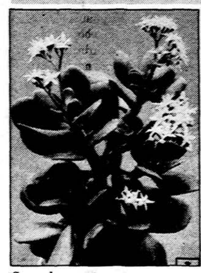
Crassula argentea. Lengvai dauginami lapais. Krasulos taip pat žydi rausvų arba balzanų žiedelių kekėmis.