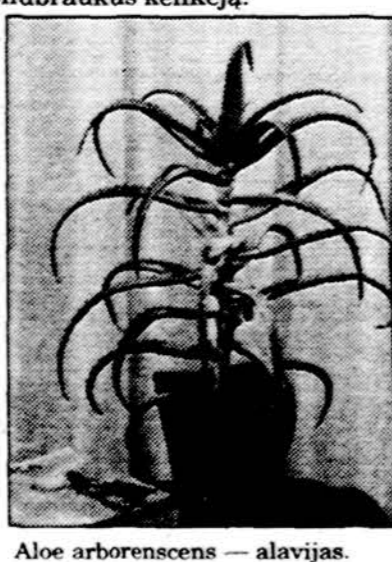
Aloe arborescens — alavijas.

„Succulents“ lietuviškai vadinami sukulentais (kaip gi kitaip?!). Jie taip pat yra sausų klimato zonų augalai, bet, pasinaudodami retkarčiais pasirodanciais lietaus krituliais, savo audiniuose — kamienuose ir lapuose — sukaupta vandens atsargas. Kartais tas vanduo sudaro apie 95 proc. šių augalų svorio. Sausros metu sukulentai labai taupiai sukauptą vandenį vartoja ir taip išlieka net ilgus periodus. Po lietaus atsi-