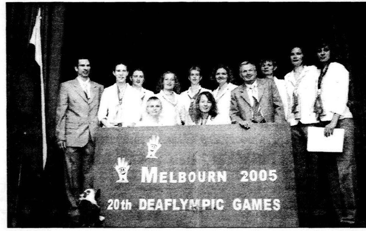
Lietuva ir toliau garsėja kaip krepšinio šalis: ir moterų (nuotr.), ir vyrų krepšinio rinktinės Melbourne kurčiųjų olimpinį žaidynių krepšinio varžybose iškovoję bronzos medalius. „Mažajame finale“ šeštadienį lietuvės be didesnio vargo nugalėjo Ukrainos krepšininke 79:58, o vyrų rinktinė Australijos komandą sutriuškino net 90:62.

Anot jo, būtines naftos terminale šį mėnesį dėl didelių audrų nepakrautas nė vienas tanklaivis, tačiau naftos rezervuaruose yra: „Paprastai tanklaiviai ir susivienijimo antrinės bendrovės „Samaranef-tegaz“ išpareigojimas „Mažeikių naftai“ kiekvienais metais tiekti 4.8 mln. tonų naftos. Todėl ar bus tiekiamas „Jukos“ nafta šį mėnesį ir pirmąjį metų ketvirtį, nėra aišku.