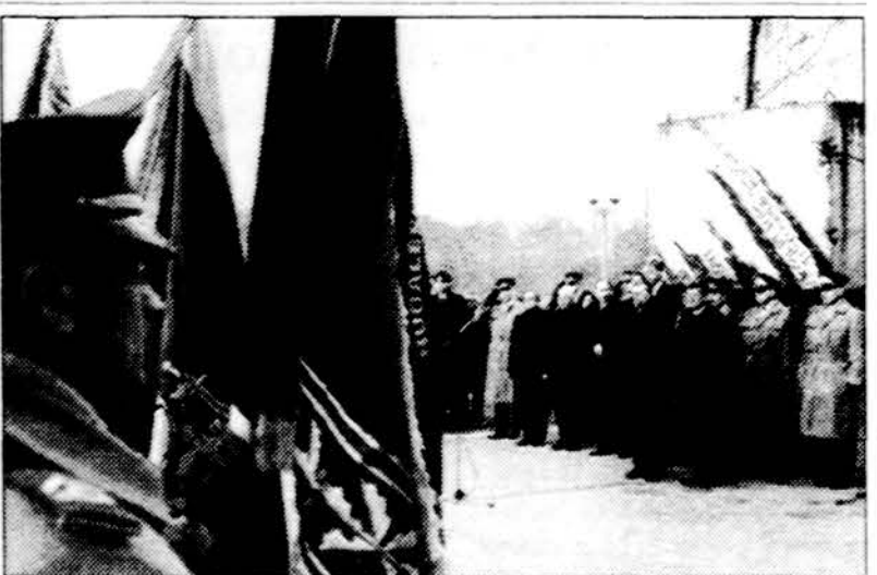
Krašto apsaugos savanorių pajėgos (KASP) savo įkūrimo 14-ąsias metines paminėjo iškilminga vėliavų rikiuote Nepriklausomybės aikštėje prie Sausio 13-osios memorialo. Per keturiolika gyvenimo metų Savanorių tarnyba nusipelnė pagarbos ne tik gindama Parlamentą 1991-ųjų sausio įvykių metu, bet ir vykdydama teritorines gynybos užduotis, kurdamas šiuolaikinio rezervu strukturas.

E. Vareikis pažymi, jog prieš kelerius metus Seime buvo įrengtas susikaupimo kambarys, maldos praktika, kuri mus galėtų dar labiau suvienyti ir padėti bendram dar-