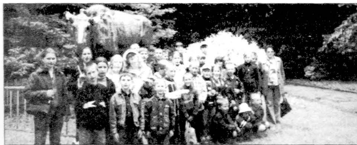
Karaliaučiaus zoologijos sode Lunino (Lekviečių) ir Timiriazovo (Naujosios) mokyklų mokiniai.

žės 1-osios internatinės mokyklos mokiniai. Ekskursijos dalyviai susipažino su Klaipėdos kraštu, Klaipėdos miesto istorija. Senovėje šiame krašte stovėjo svarbiausios kuršių pilys ir gyvenvietės XIII amžiuje baltų gyvenvietės užėmė kalavijuocių ordinas, Danės ziotyse pasistatę Memelburgo pilį. Prie jos pradėjo augti miestas, pavadintas Memelio vardu. Lietuviai ne kartą puolė pilį. Kalavijuočiai, negalėdami atsilaukiyti, pilį perdavė kryžiuočiams. Pirmą kartą lietuviškas Klaipėdos vardas paminėtas 1423 metais. Sudėtinga ir paini Klaipėdos istorija, miesta vargino kariai, isuritės, maras, gaisrai, germanizacija. Mokiniai lankėsi Klaipėdos