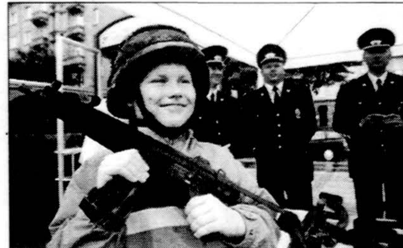
Ginkluotės ir technikos ekspozicija Pasieniečių šventėje labiausiai domėsi vaikai.

Į jas pretenduoja Rusijos naftos pramonės milžinai „LUKoil“ ir „TKN-BP“, tarptautinė naftos perdirbimo ir prekybos bendrovė „Vitol“, Kazachstano valstybinė naftos kompanija „KazMunayGaz“ ir kt.