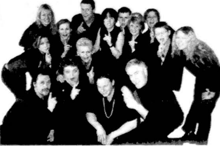
Bilietų pardavimas: Kąsavolė, „Lietuvių“ Liauniumo Plazas, 4 Ubi „Marquette park“ Kavinė, Bovo „Limonis“

Įėjimas - $14.99 auka „Nuostabių piktų ir amžinai nepatenkintų asmenų Reabilitacijos centro“ (Kairėms)