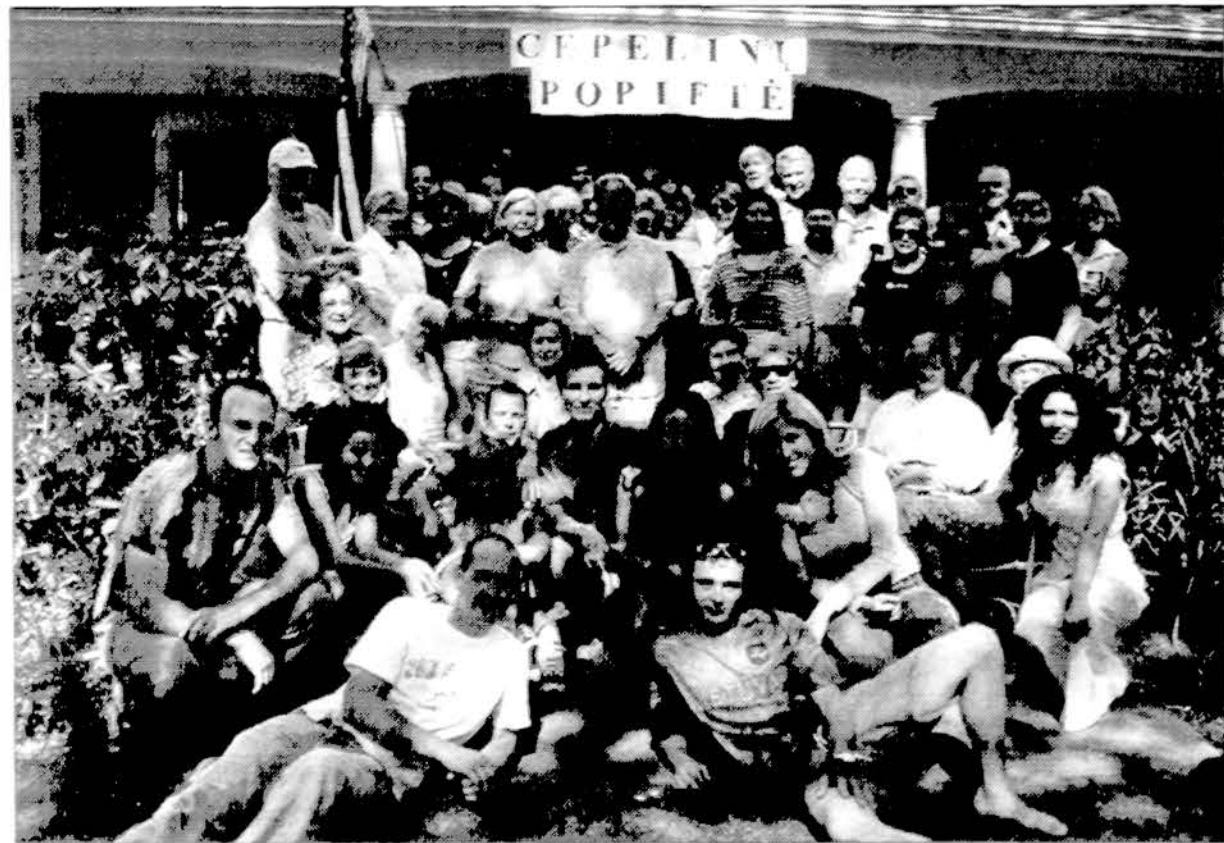
Toki gražų būrį Cape Cod lietuvių pavyko sukviesti prie „cepelinų stalo“.