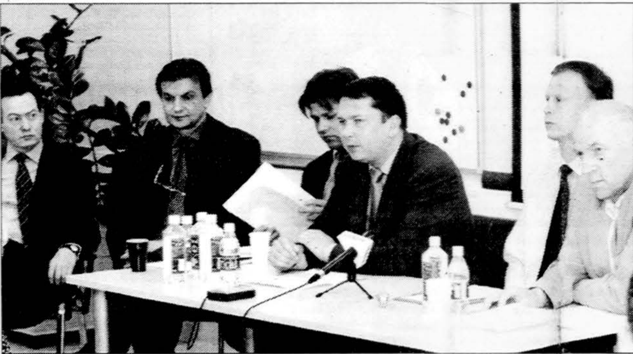
Pristatytas „Pilietinis aljansas prieš korupciją“.