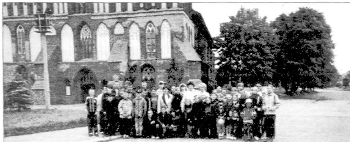
Karaliaučiuje prie Katedros.

Kadangi ši finansinė institucija yra kooperatyvas, pagal įstatymą kas metai pristatoma finansinė apyskaita nariams metiniam susirinkimui, kuris