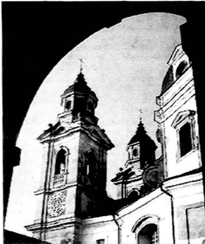
Pažaislio architektūros fragmentas.