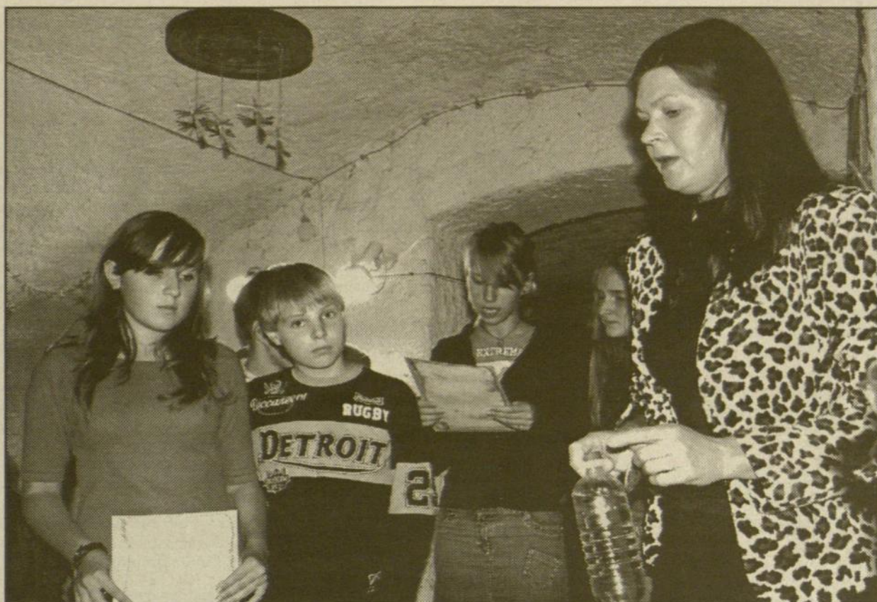
Gyvosios istorijos pamokos Mažosios Lietuvos istorijos muziejuje Klaipėdoje.

• Sukurti duomenų bazę (sąvadą) apie Mažojoje Lietuvoje buvusį