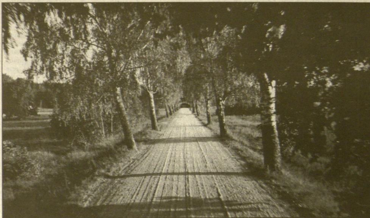
Kelias į Martyno Jankaus muziejų Bitėnuose.