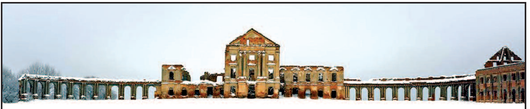
Ružanai, 2015. Sapiėgų rūmų ansamblis