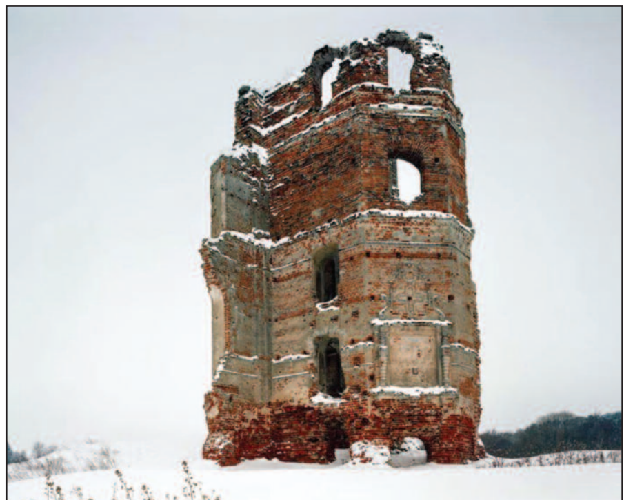
Smalėnai, 2015. Kunigaikščių Sanguškų pilies likučiai

Kadaise buvę didingi mūrai, garsios pavardės, platūs fundatorių užmojai... Girdėtos ir negirdėtos vietovės tartum sujaukta istorijos ir architektūros kortų kaladė – trauki po vieną ir dėlioji miglotą visumą iš atsitiktinių fragmentų: Smalėnai, Guliai, Ružanai, Onuškis, Sialecas, Kniažyčiai... Romanikos liekanos, barokas, vilnietiškas barokas, klasicizmas, gotikos mūro fragmentas. Sapiegos... Pacai... Šemetos... Sanguškos... Komarai... Ką žinai? Ko nežinai? Ką esi girdėjęs? Kieno vardas lyg