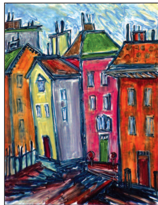
Gema Duobaitė-Philips. Be pavadinimo. Monotipija, aliejus ant stiklo, 2009