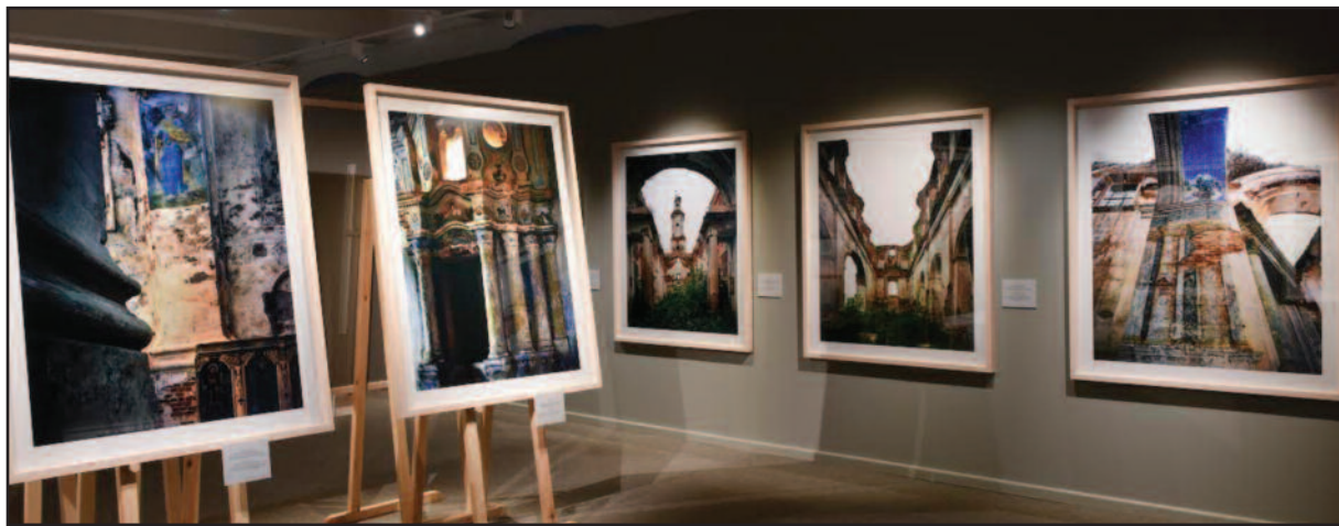
Bendras parodos vaizdas.

Pirmas stipriausias išpūdis – tai neįprastai didelis darbų mastelis. Žiūrovas pasijaučia apsuptas tų irstančių mūrų, kai pro skylėtus bažnyčių stogus galima matyti dangų, grožėtis skliautų aukštybėje išlikusiomis aptrupėjusiomis freskomis arba matuoti akimis snieguotas lygumas. „Nepalikdamas pėdų“ tartum dvasia jis gali žingsniuoti per lygumas link horizonte šmėkšančių rūmų – ir niekad jos nepasiekti. Ypatingai tapybiški raudonų mūrų ir juos apkritusio sniego deriniai, didžiulės baltos erdvės be jokių dabarties žymių ar šiuolaikinio žmogaus buvimo pėdsakų. O ten, kur pastatų likučius gožia laukinė vasaros gamta,