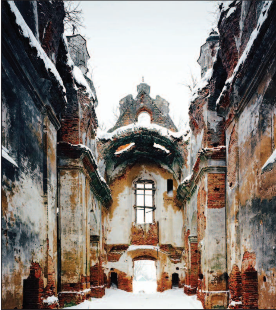
Smalėnai, 2015. Švč. Mergelės Marijos Ėmimo į dangų bažnyčia