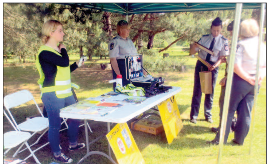
Policija išnaudoja visas progas pagarsinti savo paslaugas.