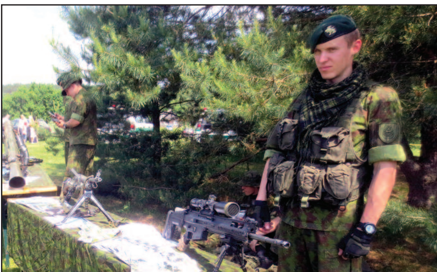
Kariškiai pasakojo apie savo tarnybą.