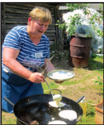
Sodybų pilnėjimo metas – 6 psl.