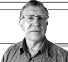
Parengė Vitalius Zaikauskas