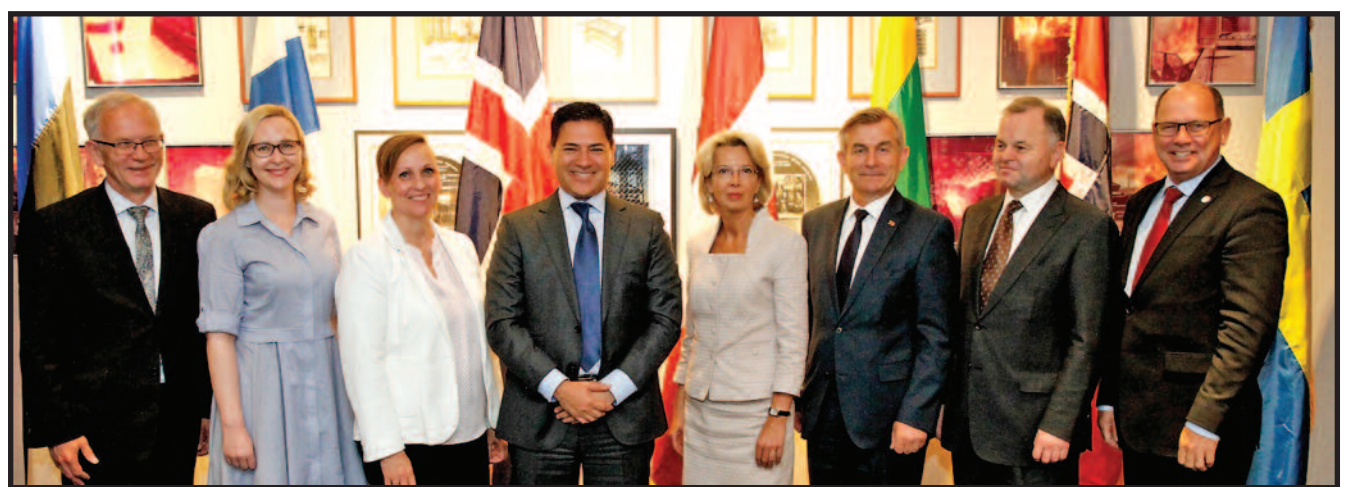
Šiaurės bei Baltijos šalių parlamentų vadovų apsilankymas JAV prekybos departamente. Viktoras Pranckietis – trečias iš dešinės.