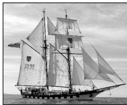
Burlaivis „Brabander” ieškos nuskendusio laivo „Prezidentas Smetona”.