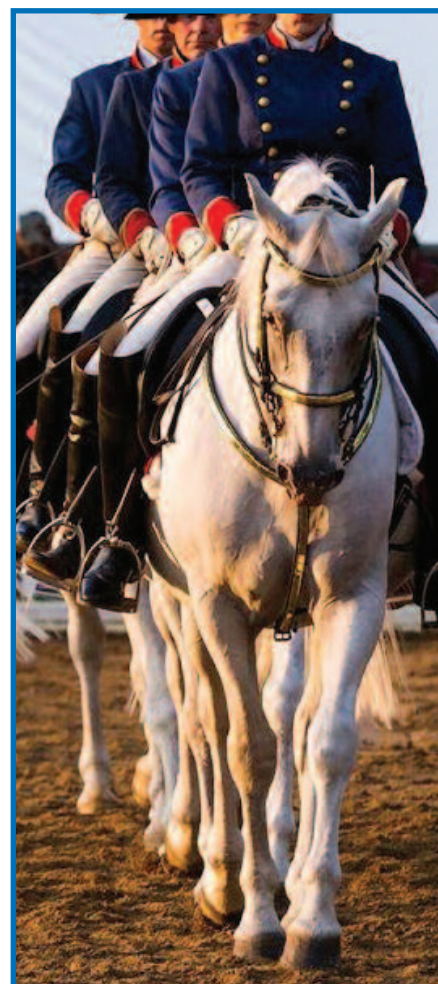
„Kadriljo“ finalas. Atsisveikiname iki kito karto...

Vakariniai spektakliai – ideali pasimatymų vieta, stebint programą ir pasitinkant saulėlydį. Tik įėję būsite pavaišinti vynu ar alumi. Čia taip pat veikia užkandinė po atvirumi dangumi, yra suvenyrų parduotuvė (galbūt norėsite šeimos mažyliams parvežti dovanų baltakartį „lipizzaniuką“). Popietiniai spektakliai vyksta trečiadieniais ir sekmadieniais, vakariniai – šeštadieniais. Pasirodymų sezonas tęsis iki rugsėjo 10 d. Išanktinių bilietų kaina – nuo 27 dol., vaikams iki 15 metų, tarnaujantiems ka-