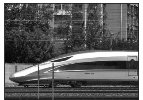
Naujas traukinys važiuos 400 km/val greičiu.

Kinijos geležinkelio linijų ilgis sudaro apie 124 tūkst. km, iš jų per 22 tūkst. km – greitaeigės geležinkelio ma-