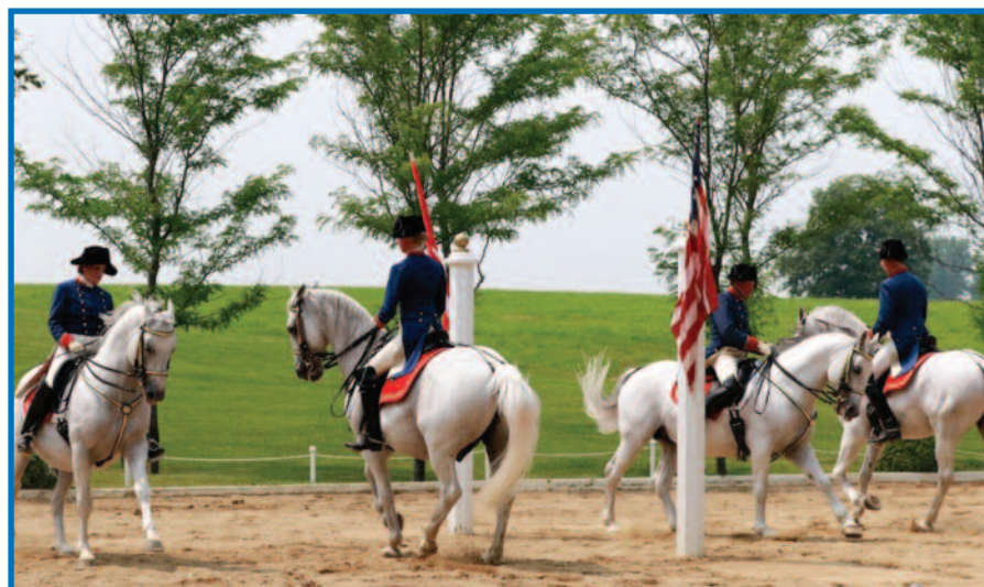
Baltųjų Lipizzan piruetai.

mano širdelė pradėjo greičiau plakti – jau žinojau, koks didelis malonumas laukia čia, tarp tų žalių kalvų. Jau antrą kartą su entuziazmu vykome į Tempel žirgyną. Kaip ir pernai, parodomosios programos pasižiūrėti rinkosi ir jaunos šeimos su vaikais, ir žilagalviai, ir pasimatymą čia paskyrusios jaunos porėlės. Ypač jaudino galimybė po parodomosios programos apsilankyti arklidėse, paglostyti tuos nuostabiuosius Lipizzan žirgus, nusifotografuoti su jais ir jų dresiruotojais.