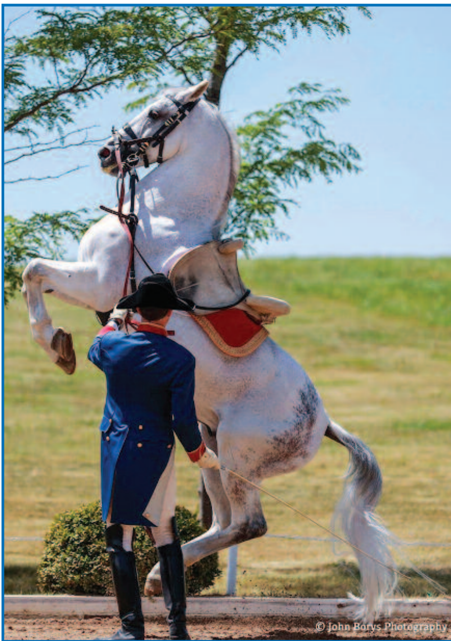
Grakštus žirgo šuolis ore – „Courbette“.