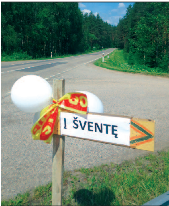
Pasiklysti – misija neįmanoma.

P akelės pievos kvepia, akys vis dar neįpratusios prie vasaros pradžios žalumos. Toks vėlyvas šiemet buvo pavasaris Lietuvoje. Nusiritu nuo kalvelės, šmurkšteliu į pušyną. Šventės rengėjai pasirūpino, kad svečiai neklaidžiotų – kiekvienoje kryžkelėje pastatė po rodyklę.