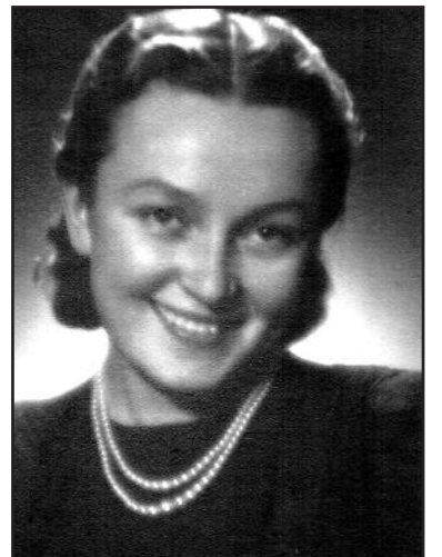
Laiško autorė jaunystėje.

Tarybiniais laikais ne vieną kartą lankiausi Lietuvoje. Vienos tokios kelionės metu užėjau į Šventosios Dvasios bažnyčią. Norėjau aplankyti požemius ir vėl pamatyti tuos beveik neįtikėtinus vaizdus. Tačiau niekur nebegalėjau rasti įėjimo į kriptas – lyg nebūtų buvę. Klausinėjau žmonių, net teiravausi Vilniaus universitete, bet niekas nieko nežinojo, nieko nebuvo girdėję... Užtat malonu skaityti, kad šie požemiai ir mumijos ne tik dar vis egzistuoja, bet ir yra mokslininkų studijuojami.