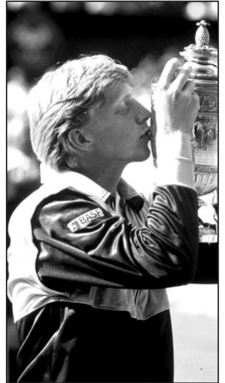
Buvusiai pirmajai pasaulio raketei B. Becker gresia juodos dienos.