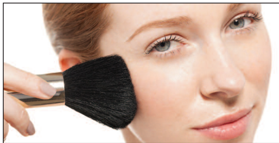
Bronzinė pudra paryškina veido bruožus.

ir ilgai išliekančių lūpų dažų. Lūpų blizgesys puikiai sudrėkins lūpas ir paryškina jų natūralią spalvą. Rožinio ir persikų atspalvio lūpų blizgesiai paprastai tinka daugeliui moterų.