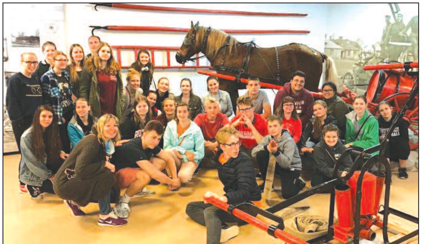
Savaitgalis Anykščiuose – apsilankymas „Arklų muziejuje“.

Susipažinkite: papuosalų kūrėja Skaistė Bružaitė – 6 psl.