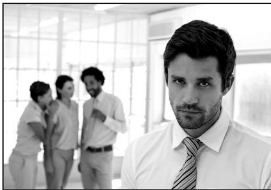
Apkalbos darbe gali pakenkti ne tik jums pačiam, bet ir viso kolektyvo atmosferai.

Galiausiai, niekada nežinote, kokius duomenis kaupia jūsų darbovie-