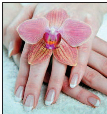
Gražios rankos ir švelnios rankos – moters vizitinė kortelė.

15. Nepamirškite savo rankų. Dieną naudokite kremą su Kojo rūgštimi ( kojic acid ), kuri padeda panaikinti rudas dėmes. Naktį naudokite rankų kremą su retinoliu, kuris sustangrins rankų odą. Nepamirškite dieną naudoti rankų kremą su SPF. Šis kremas apsaugos nuo pavojingų saulės spindulių ir jų pasekmių.