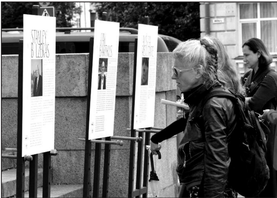
Iššėivijos veiklą pristatanti paroda.