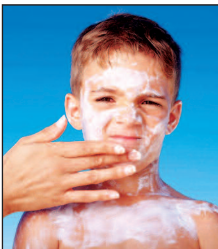
Apsauginio kremo nuo saulės būtinybė.

2. Nepatingėkite dosniai apsauginiu kremu nuo saulės išsitepti viso kūno. Vien tik lengvai apipurkšti ar užsitepti kremu negana – Amerikos odos gydytojų asociacija pataria visam kūnui sunaudoti 1oz. apsauginio kremo. Taigi, kaip suprantate, vienos tūbelės kremo visai vasarai nepakaks.