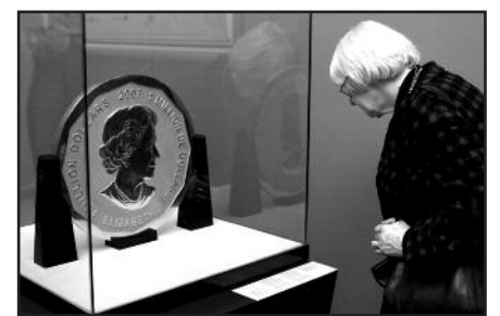
Įtariamieji vagystę sulaikyti, tačiau moneta vis dar nerasta.

rėjai mano, kad nusikaltėliai ją jau galėjo spėti išlydyti ir parduoti.