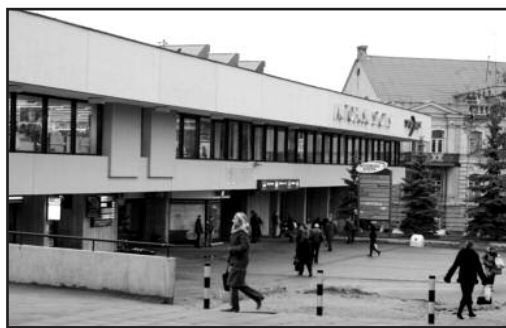
Nesaugia ir prastos reputacijos aplinka garsėjanti autobusų stotis bus parduota.

Kelis mėnesius atidėliotą konkursą savivaldybė paskelbė balandį – miestas nori įsigyti autobusų, kurie atitinka ekologijos standartus, juos numatoma išpirkti per 8 metus.