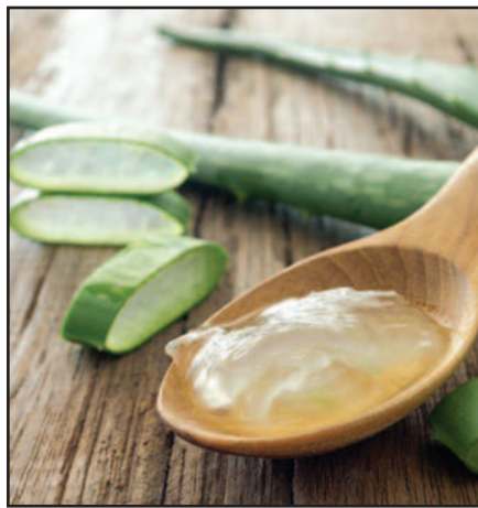
Nuostabūs alijošiaus augalas su gydomąja žele.

6. Nuolatos drėkinkite savo odą. Oda mus apsaugo nuo išorinių veiksnių – nuodingo aplinkos užterštumo, įvairių bakterijų ir dulkių. Geras kūno bei veido drėkinamasis kremas ( hydrating lotion/cream ) apsaugos jus nuo odos išsausėjimo, vandens druskų ir kenksmingo chloro.