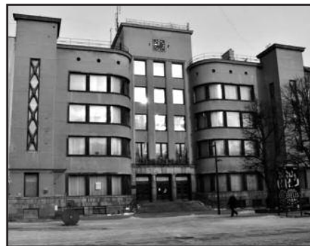
Kauno centrinis paštas laukia pirkėjų.

centrinio pašto pastatas nepriklausomų turto vertintojų įkainotas daugiau kaip 11 mln. eurų. Tarpukario architektūros Kauno centrinio pašto statinių kompleksas ir vienas žinomiausių uostamiesčio architektūros paminklų – Klaipėdos centrinio pašto pastatas specialistų vertinami panašiai – apie 1,6 mln. eurų.