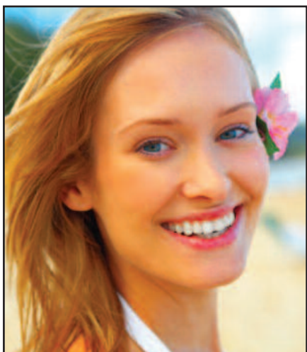
Lengvas ir gaivus makiažas vasarai.

8. Vasarą leiskite odai pailsėti nuo sunkaus makiažo. Užsitepusi saulės apsaugos kremą veidui, pasinaudokite makiažo pagrindo pieštuku ir užtepkite tik ant nosies, žandų, smakro bei kaktos. Paakiams naudokite drėkinamąjį oranžinio atspalvio kamfliažinį kremą. Tada subtiliai visur kempinėle patapšnokite ir visa tai išlyginkite. Veido oda atrods natūraliai ir gaiviai. Šiuo metu beveik visos kosmetikos priemonės turi ir SPF apsaugos faktorių. Bet atsiminkite, kad jeigu užsitepėte kremą su SPF 30, o veido pagrindas turi SPF 15, jūsų apsaugos faktorius yra SPF 30. SPF faktoriai nėra sudedami, bet imamas aukščiausias SPF apsaugos laipsnis.