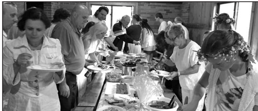
Skanauti ir valgyti buvo iki soties.