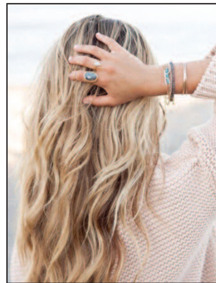
Vėjo išskendinti plaukai suteiks jaunatviškumo. Favim.com. nuotr.

tų būti kuo paprastesnė. Leiskite plaukams natūraliai išdžiūti ir pailsėti nuo karšto plaukų džiovintuvo. Papurškite plaukus priemone su jūros druska ( sea salt texturizing spray ) ir leiskite vėjui plaukus išskendinti. Jūsų plaukai atrods kaip ką tik grįžus iš paplūdimio, o lengvos natūralios garbanos suteiks jums vėjavaikiško žaislingumo.