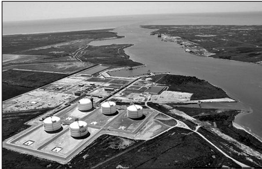
JAV įmonė „Sabine Pass“ siunčia dujų Lietuvai.