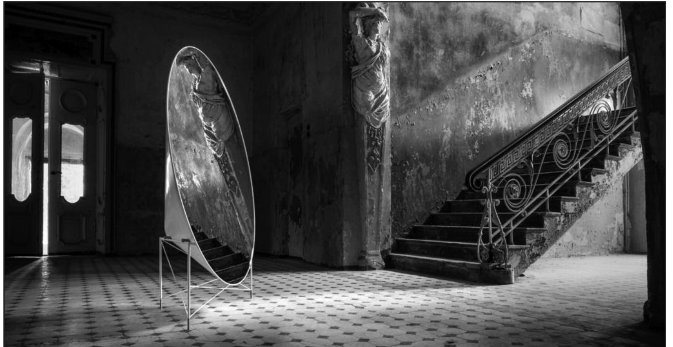
Lietuvių pristatytas „MUDU“ veidrodis laimėjo geriausio namų aksesuaro apdovanojimą.

„NYCxDESIGN Awards“ pristatyti kūriniai buvo peržiūrėti ir įvertinti 30-ies profesionalių dizainerių.