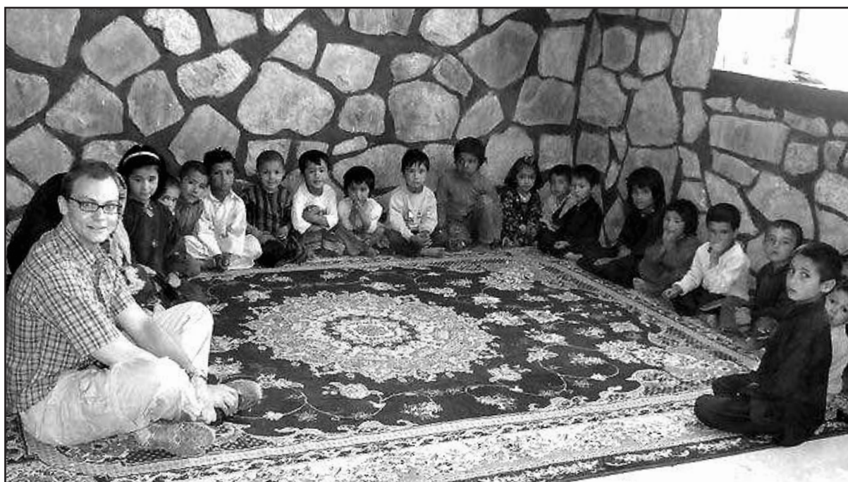
Afganistane, vienuose iš vaikų namų, kur gyvena tėvų netekę mažyliai.

Be tradicinių diplomatinė užduočių, mano ir kolegų darbas buvo pagalba vystomojo bendradarbiavimo srityje – padėti vietos gyventojams atkur-