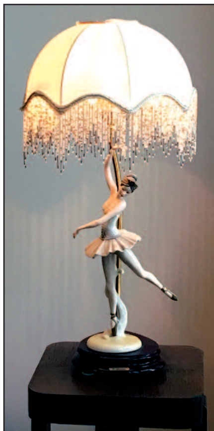
Art deco garsėjo savo mažosiomis skulptūromis.