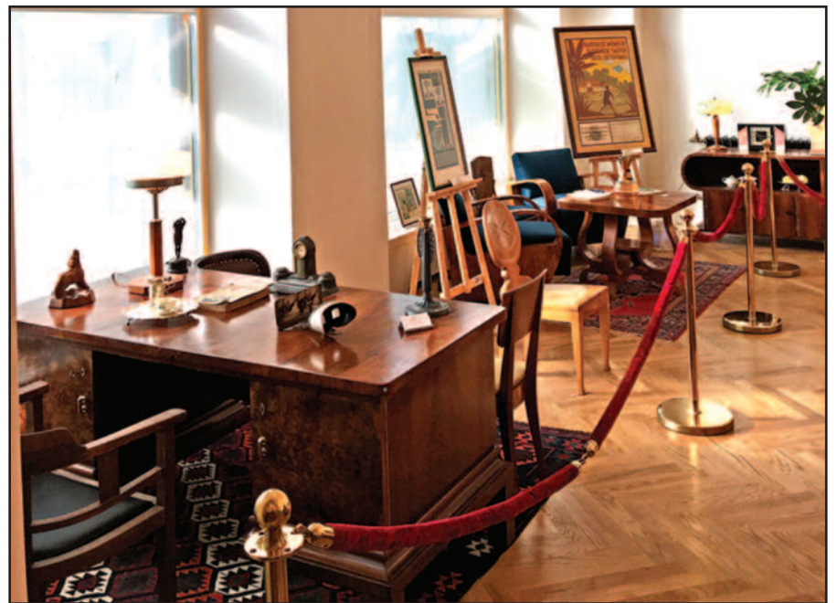
Atgimusi modernizmo dvasia: rafinuotas ir elegantiškas art deco interjeras.