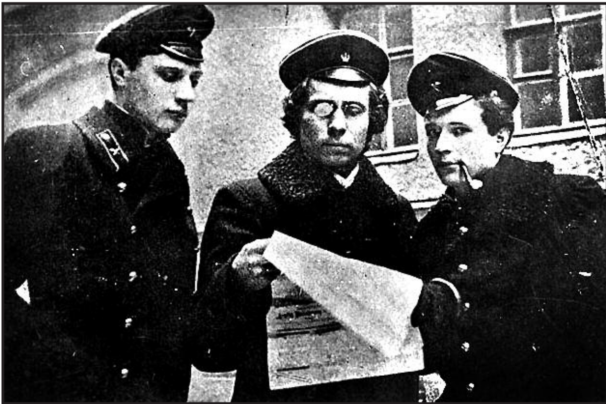
Lietuviai studentai Petrograde.