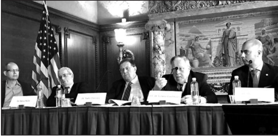
Prof. V. Landsbergis (antras iš d.) buvo vienas pagrindinių konferencijos pranešėjų.