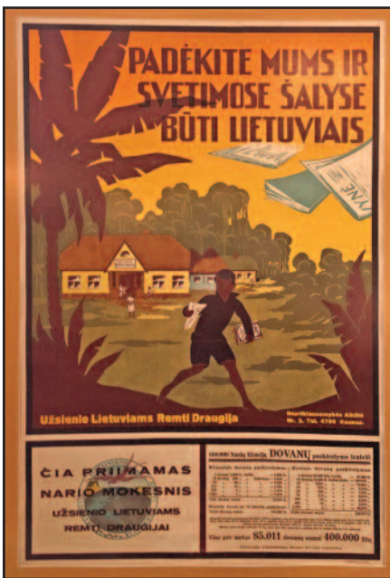
Art deco stiliaus reklaminis plakatas.

stadijoje. Paprastai procedūra užtrunka penkerius metus, tai gana ilgas procesas.