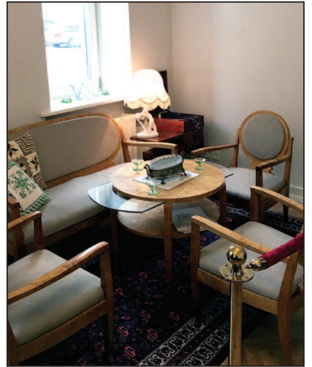
Parodos lankytojai galėjo grožėtis ne tik baldais, bet ir indais, stalniais laikrodžiais, lempomis bei kitais namų aksesuarais.