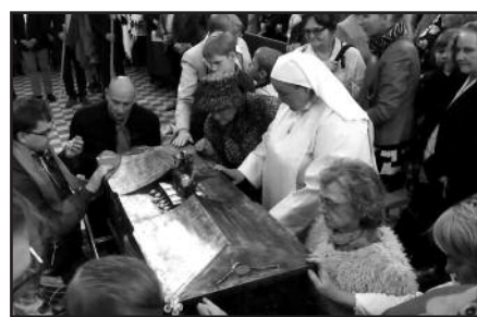
Palaimintojo T. Matulionio palaikai iš Kaišadorių atgabenti į Vilnių.

buvo kalintas 16 metų. Ilgiausia bausmė dvasininkui skirta 1946 metais, kai jis atsisakė bendradarbiauti su sovietų režimu ir paklusti jo nurodymams padėti įveikti partizaninį judėjimą, kritikavo komunistus dėl tikinčiųjų persekiojimo.