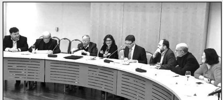
Diskusijos dalyviai pabrėžė ryšių su Rusijos pilietine visuomene stiprinimo svarbą.

Pirmasis Nepriklausomos Lietuvos vadovas pažymėjo, kad naujų grėsmių iš Rusijos akivaizdoje ypač svarbi Transatlantinės bendruomenės vienybė, paremta vertybėmis, bei vieninga Vakarų