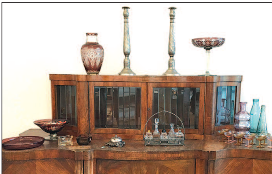
Nuostabūs Micutos bufetas.