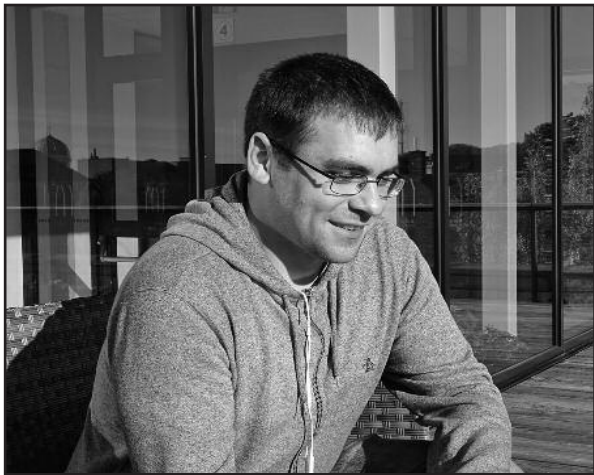
Doktorantas gavo Mockūnų premiją jau antrą kartą.