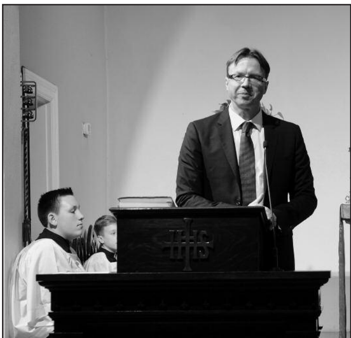
Sveikina LR ambasadorius JAV ir Meksikai Rolandas Kriščiūnas.