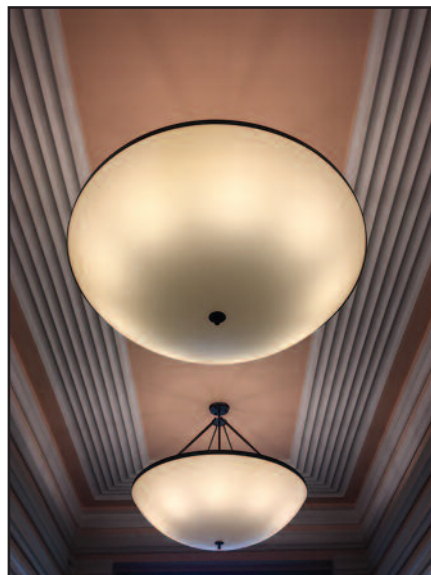
Garsiojo pastato interjero detalės.