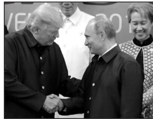
D. Trump trumpai susitiko su V. Putinu.

D. Trump pareiškė pasitikėjimą JAV žvalgyba, kuri yra padariusi išvadą, kad Rusija kišosi į 2016 m. JAV prezidento rinkimus. Nepaisant to, JAV vadovas pakartojo tikįs V. Putino nuoširdumu, kai pastarasis neigia Rusijos vaidmenį rinkimuose. D. Trump taip pat sukritikavo nepatenkintuo-