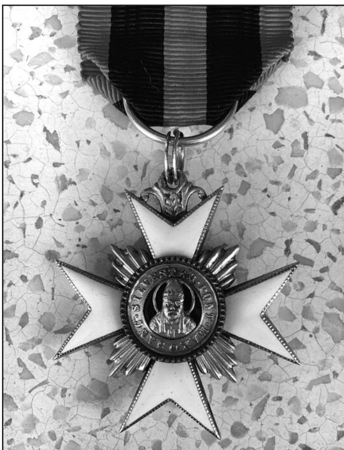
Šv. Silvestro medalis buvo įsteigtas 1905 metais Popiežiaus Pijaus X pagerbti katalikiškoje visuomeninėje veikloje pasižymėjusius katalikus. Apdovanojimas juo – garbė visiems lietuviams.