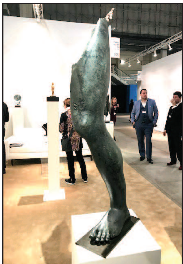
Į gilią senovę naujomis akimis žvelgia galerijos „Phoenix Ancient Art“ eksponatai.