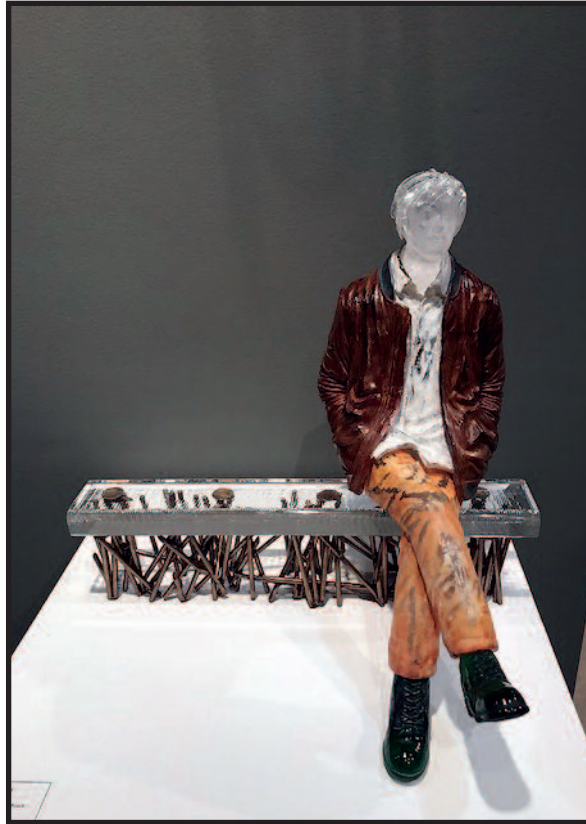
Vieno iš populiariausių SOFA menininkų – korėjiečio Sung-Won Park stiklo skulptūra.