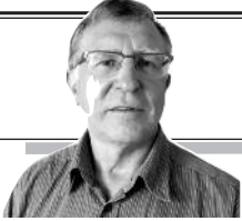
Parengė Vitalius Zaikauskas