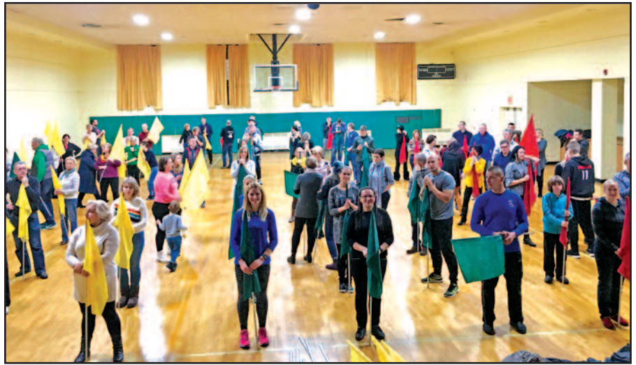
„Suktinio“ Padėkos dienos eisenos repeticija.