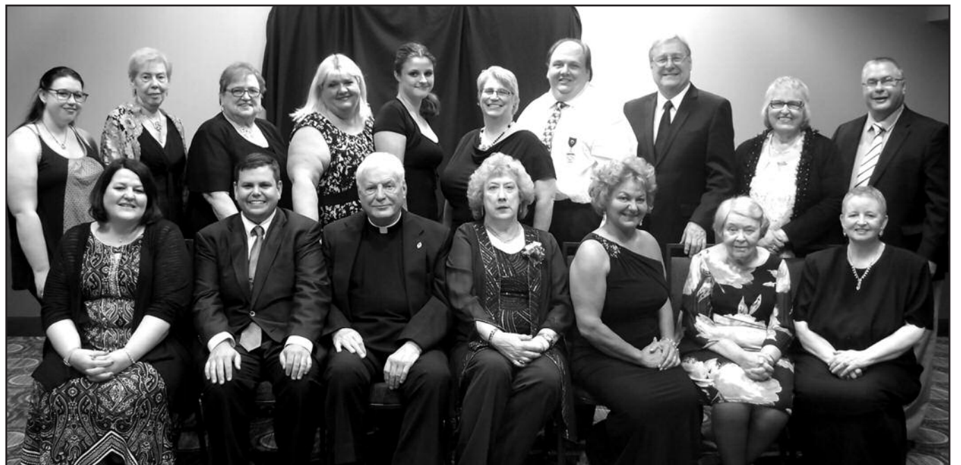
Lietuvos vyčių Centro valdyba 2017 m.