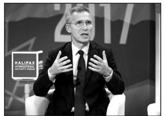
J. Stoltenberg pasisakymas pradžiugino ukrainiečius.

Ukrainos ir Gruzijos galimybes tapti NATO narėmis, J. Stoltenberg pabrėžė, kad visi sąjungininkai, įskaitant Kanadą, padeda toms šalims įgyvendinti reikalingas reformas.