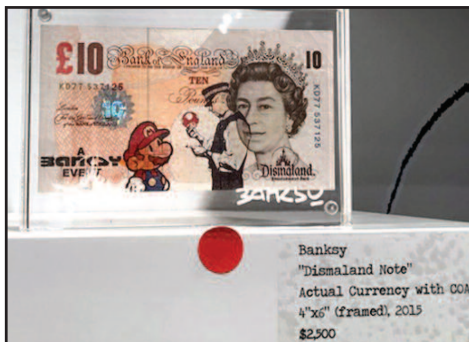
Šmaikštusis Banksy nutarė „pakoreguoti“ karalienės Elžbietos portretą Disnėjaus dvasioje. Dešimtys svarų kupiūra buvo parduota už kiek solidesnę sumą.