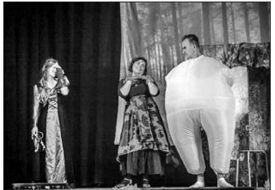
New Yorke mėgėjų teatro spektaklis „Baugalo sėkla“