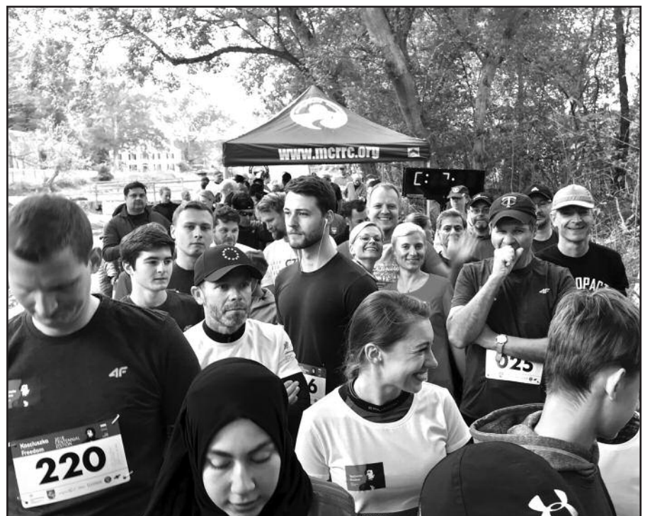
Bėgime, surengtame šalia Washington esančiame nacionaliniame parke, dalyvavo ištisos šeimos – viso beveik 400 žmonių.