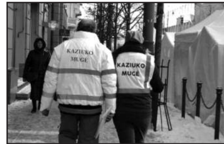
Paaikėjo, kad „Vikšris“ rinko neteisėtas ir nesąžiningas rinkliavas, užfiksuoti finansiniai nusižengimai.

„Concept Events & Media“ jau yra tris kartus (2009, 2010 ir 2011 me-