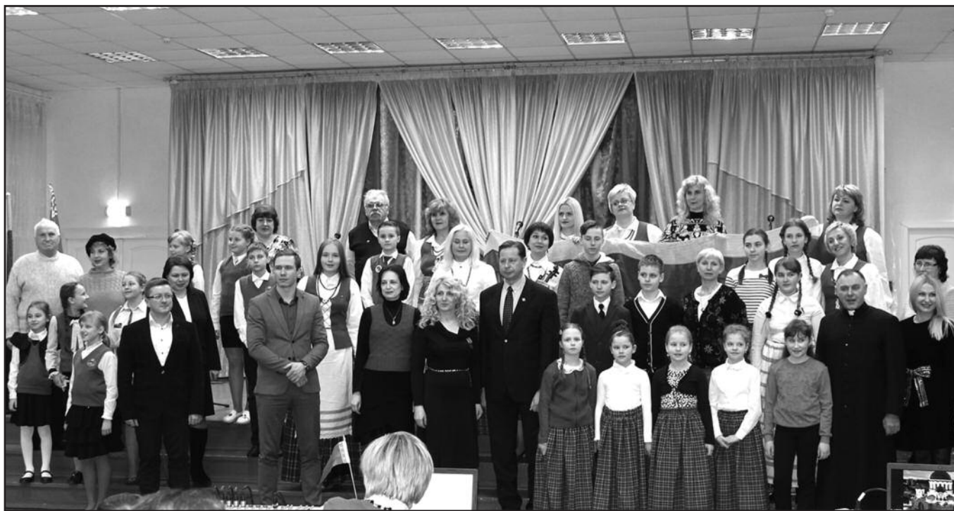
Lydos bendruomenė Lietuvos 100-mečio šventėje.