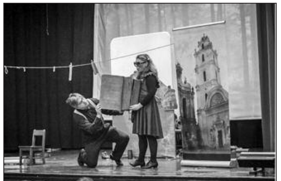
Svečiuose – vilniečių „Teatriuko“ spektaklis „Žalia gyva“.