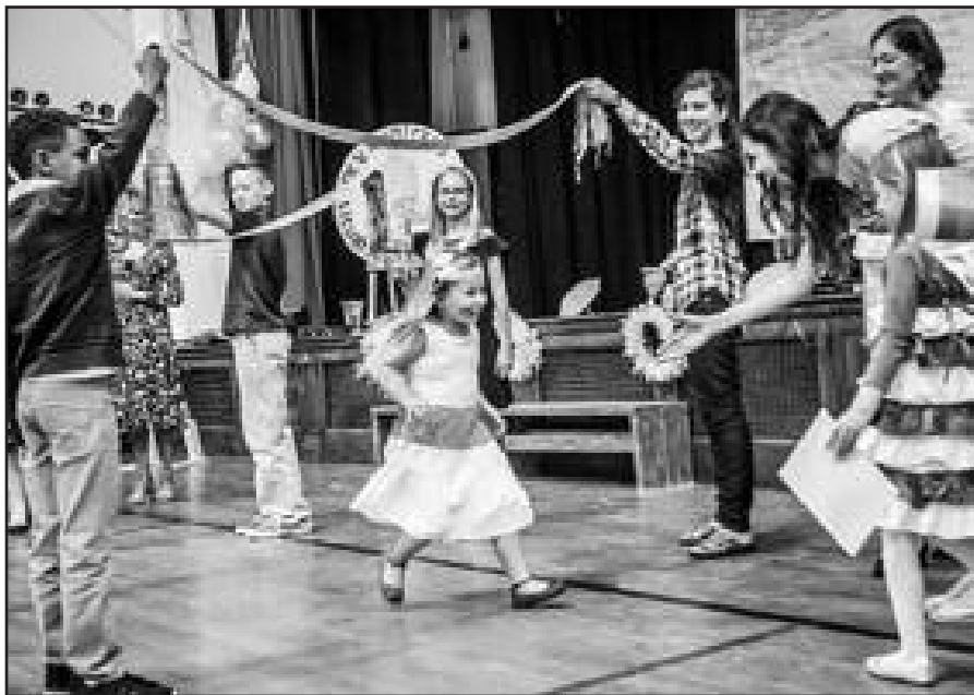
Mokslo metų pradžios šventė.