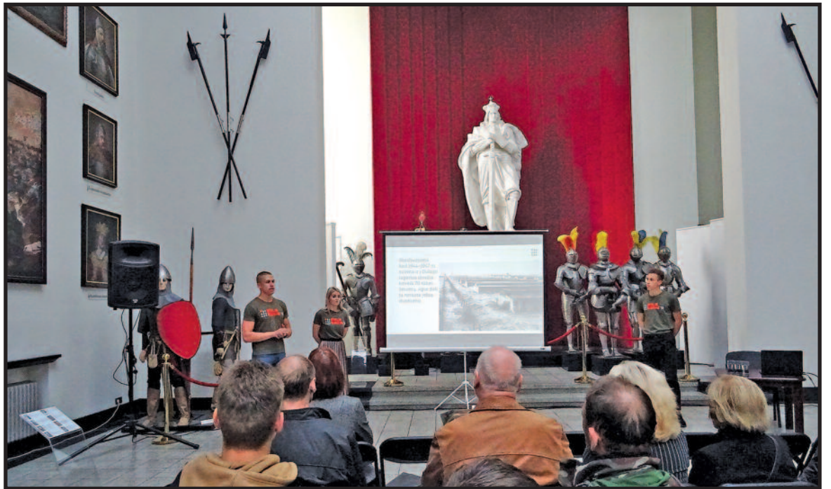
Ekspedicijos dalyviai savo įspūdžiais pasidalino Kauno karo muziejuje.