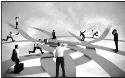
Jei visgi nutarėte darbą keisti – gerai viską apgalvokite.

nijos kultūros ir / arba nebetikite kompanija, kurioje dirbate. Jaučiate, kad tarp kompanijos politikos ir jūsų įsitikinimų, kaip turėtų veikti įmonė, yra etinių ar moralinių skirtumų, (arba yra) kultūrinių skirtumų, konfliktų dėl darbo etikos ir pan. Kad ir kokia būtų priežastis, tai – moraliniai nesutapimai su darbdaviu, tokioje vietoje nesmagu dirbti.