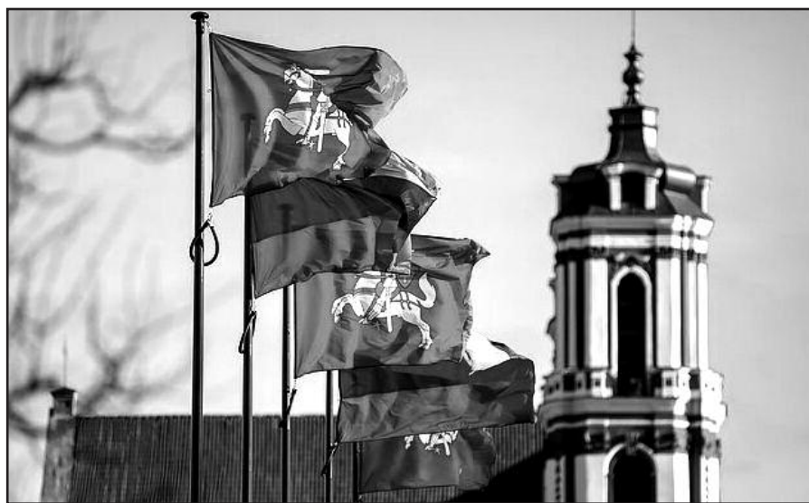
Plevėsuojančios Lietuvos vėliavos – mūsų laisvės simbolis.