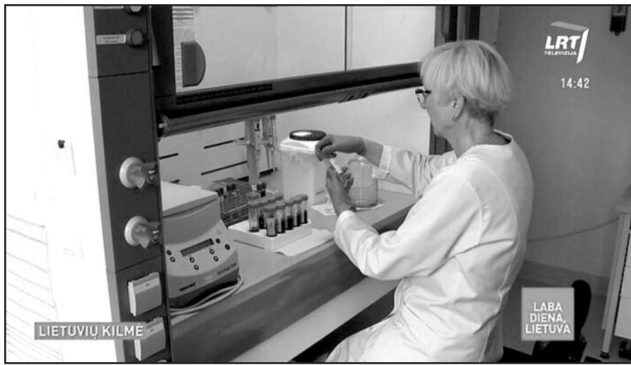
Laboratoriniai tyrimai ...lietuvų kilmei nustatyti.