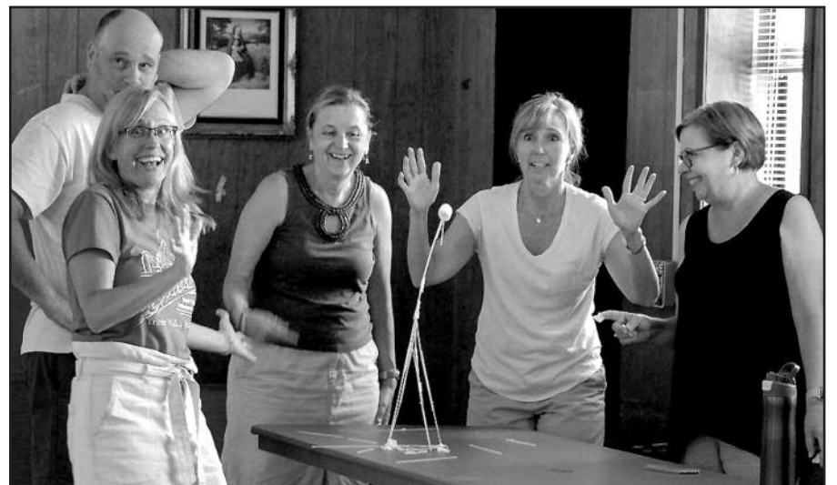
Pavyko pastatyti skulptūrą!

Po pietų, kol vieni maudėsi, sportavo ar ilsėjosi, būrys sendraugių ir keli studentai susirinko pašnekesiui po pastogę Spygliaus ežero pakrantėje („ki-