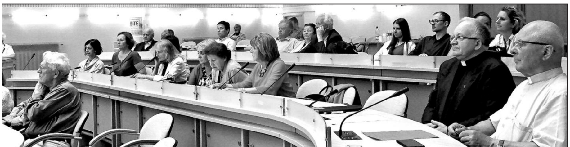
Renginio dalyviai Kauno savivaldybės salėje.

Politinių studijų savaitgalio organizatoriai priminė, kad atkūrus Lietuvos Nepriklausomybę panašaus pobūdžio renginiai buvo pradėti organizuoti ir Lietuvoje – juose buvo keliami Lietuvos laisvinimo, vėliau, jau atkūrus Nepriklausomybę – jos įtvirtinimo klausimai, analizuojamos rezistencinio paveldo išsaugojimo ir pilietinės demokratijos idėjų sklaidimo galimybės, keliami politinio ir visuomeninio gyvenimo skauduliai. Šiuose rengi-