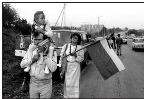
Pagrindinė žmonių grandinės informavimo ir koordinavimo priemonė – buvo radijas.

Katedros aikštėje rugpjūčio 23 d. visi surinkti radijo imtuvai 20 m ilgio ir 13 m aukščio instaliacijoje „Radijo banga“ bus nustatyti veikti viena banga ir transliuos legendinį kūrinių „Bunda jau Baltija“.