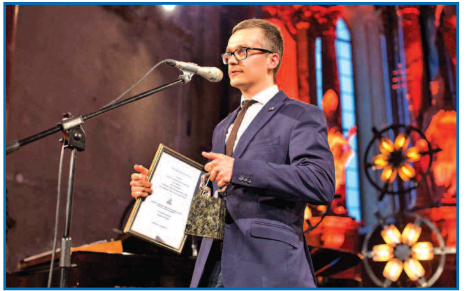
Saulius Lukoševičius atsiima geriausio Lietuvos kino operatoriaus apdovanojimą.