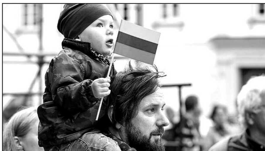
Jau didžiojuosi savo tėvyne.