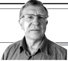
Parengė Vitalius Zaikauskas