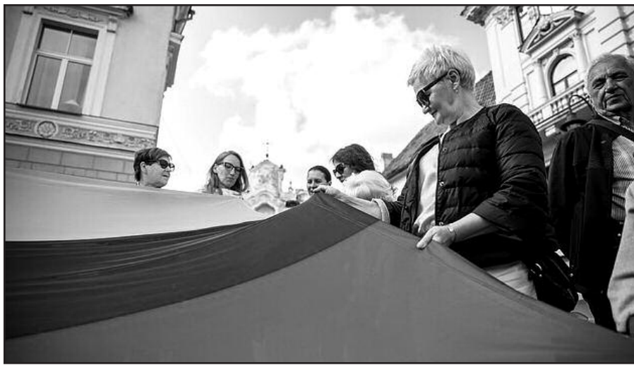
Trispalvė visai Lietuvai.