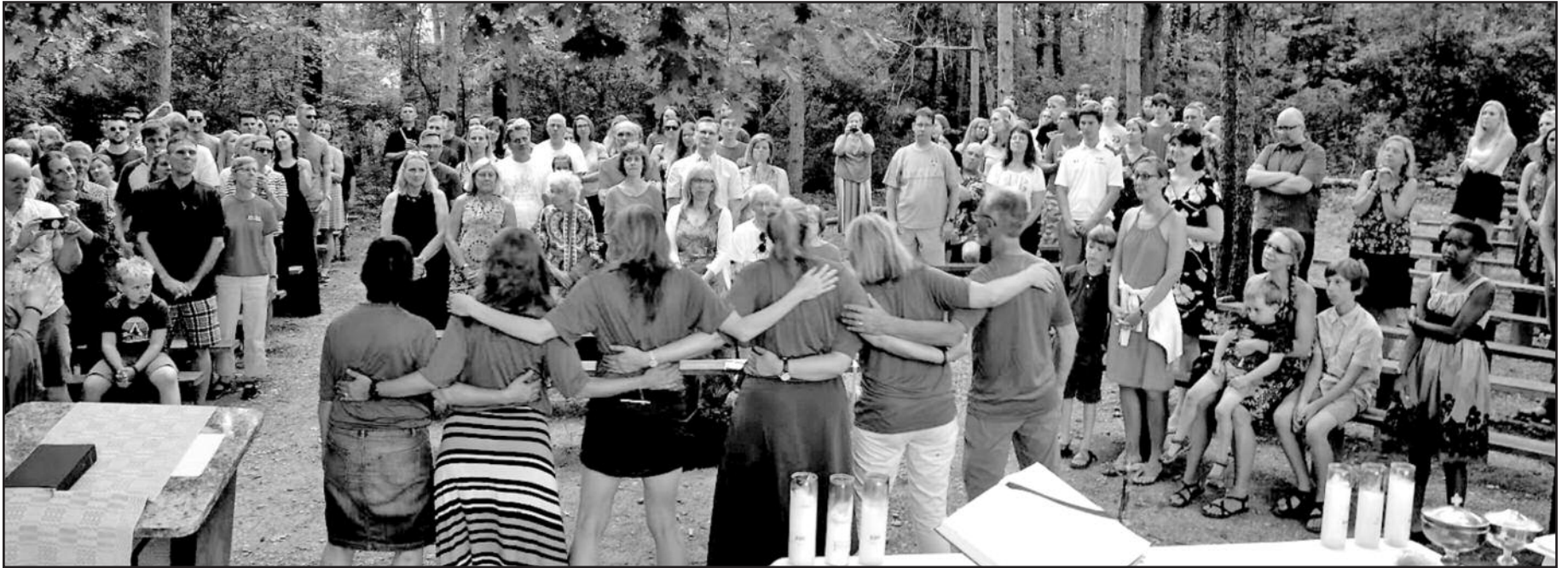
Per paskutines šv. Mišias dėkojome visiems, prisidėjusiems prie sėkmingo stovyklos planavimo ir pravedimo.