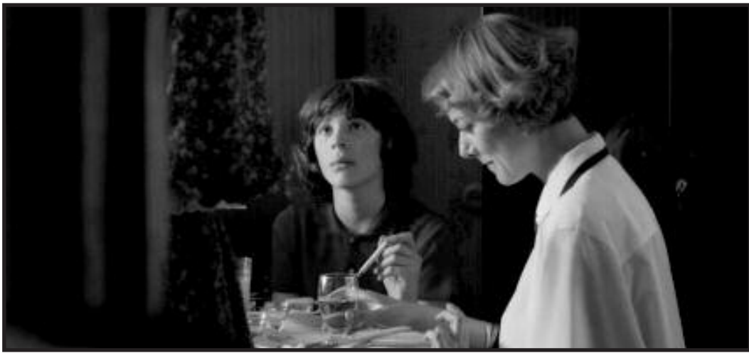
Kadras iš T. Vengrio filmo „Gimtinė“.