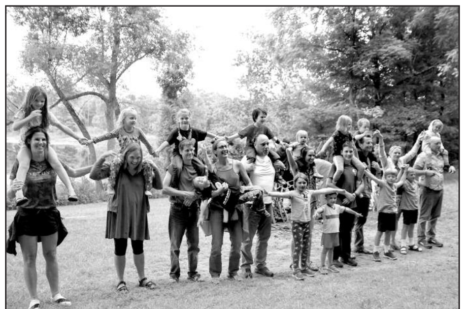
Vakarinė programa – pasirodymai prie laužo.