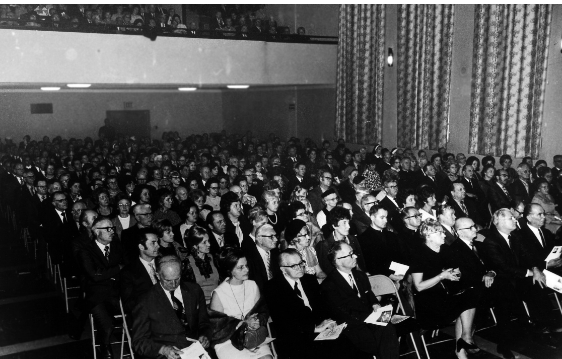
▲ „Draugo“ koncerte Jaunimo centre. 1979 m.

„Draugo“ redakcija įsikuria Šv. Kazimiero vienuolyno kapelionijoje, kur gyveno kun. A. Staniukynas. Deja, po metų, 1913 m. spalio 27 d., nuo vėžio