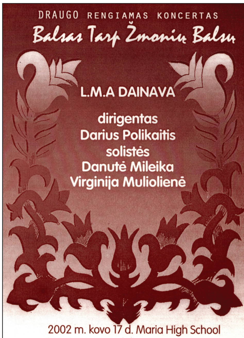
▲ 2002 m. „Draugo“ koncerto plakatas