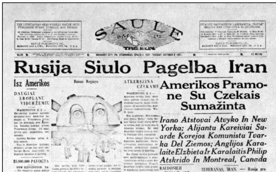
▲ „Saulės“ laikraštis, leistas Mahanoy City, Pensylvanijoje XIX a. pabaigoje. Iš kn. „Pensylvanijos angliakasių Lietuva“, 1977, Chicago