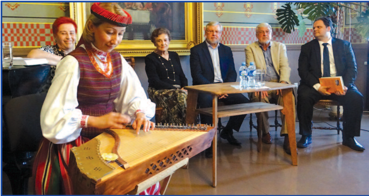
Renginyje skambėjo ir kanklių muzika.