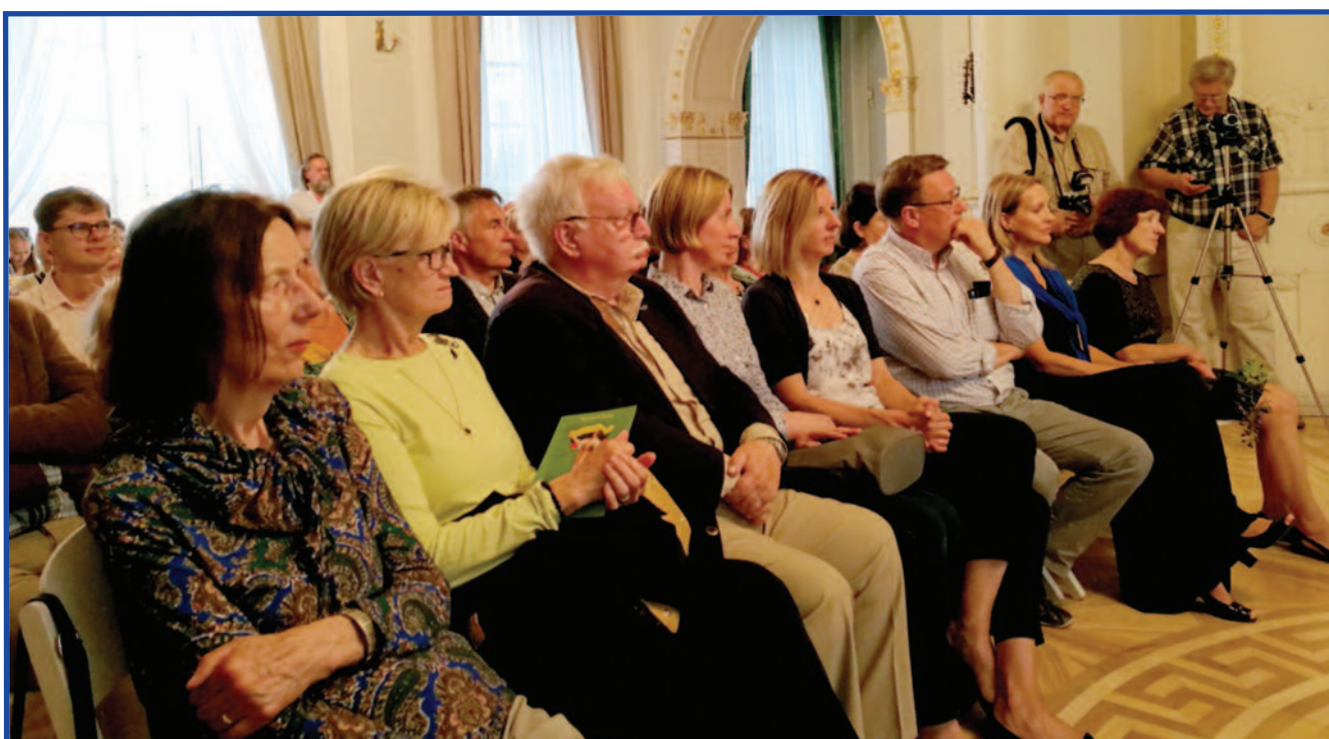
Įdėmūs vakaro klausytojai.