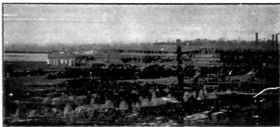
McKeeerocks "Pressed Steel Car Co." dirbtuvės.

mokėti sulyg "dalių" — ir tokiu būdu niekas negalėjo išaugsto "dalių", kiek jisai uždirbs dviejų savaitėių pabaigoje. Jie pradėjo tvirtinti, kad jie gauna ne mažiausią galimą užmokestį, bet tik tai tiek, kiek kompanija nori jiems mokėti, t. y. darbininkas tikisi gausią daugiau, bet gauna mažiau. Konvertas, kuriame gauna užmokestį, nerodo nei darbo valandų nei valandes uždarbio — jie rodo tik darbininko numerį ir skaičių idėtųjų į vidurį pinigų. Tokiu būdu darbininkas negali žinoti, nei kiek valandų jisai išdirbo, nei kiek jam mokama už darbo valandą, nei kiek jisai gavo viršaus sulyg "ratelio" uždarbio, nei kiek kompanija yra atitrakusi nuo jo už ap-