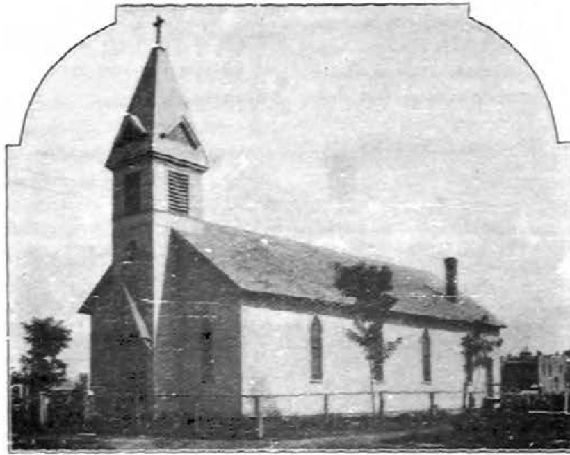
Šv. Konstantino bažnyčia, Oglesby, Ill.