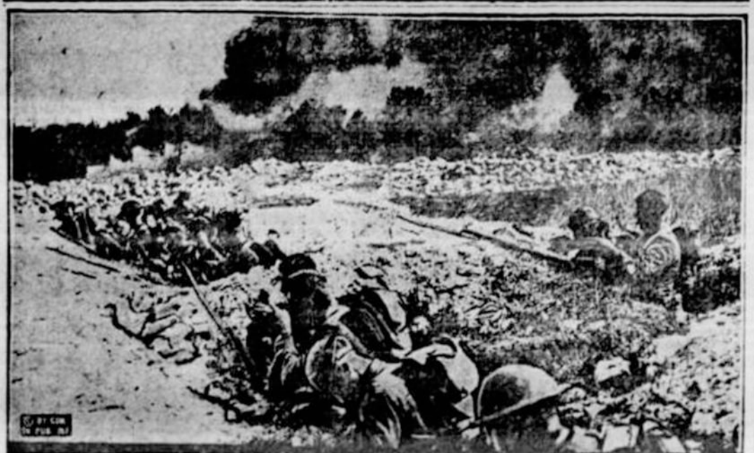
Tai amerikoni kareiviai vakarų fronte. Jie kuoveikiau užsideda maskas nuo nuodin-gų dujų, kurias prieš juos paleido vokiečiai iš savo pozicijų. Čia matomi dumų kamuo-liai—tai nuodingos dujos.

Chicago. — Šiandie ir rytoj nepastovus oras su vidutine temperatūra; rytoj gali but lietus.