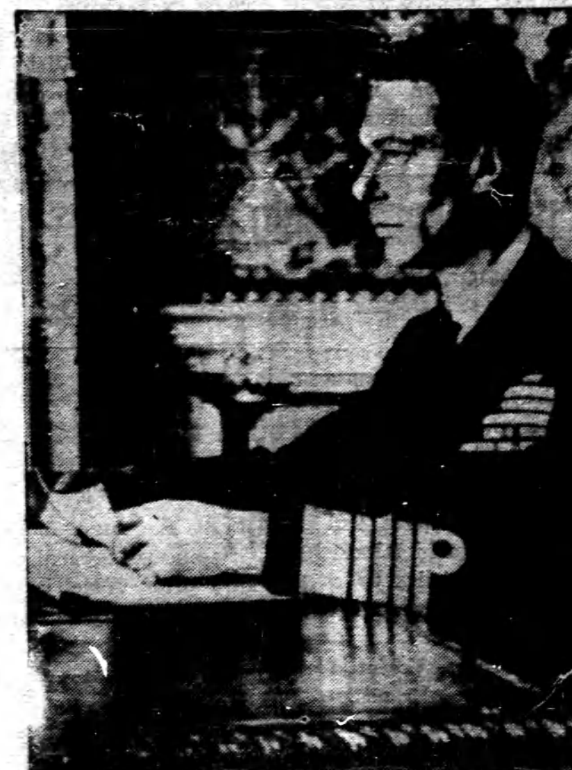
Did. Britanijos imperatorius Jurgis VI, admira. uniformoje, sako per radio kalbą, kurioj apeliuoja į visas britų dominijas vieningai kovoti prieš, kuriam Did. Britanija paskelbė karą.