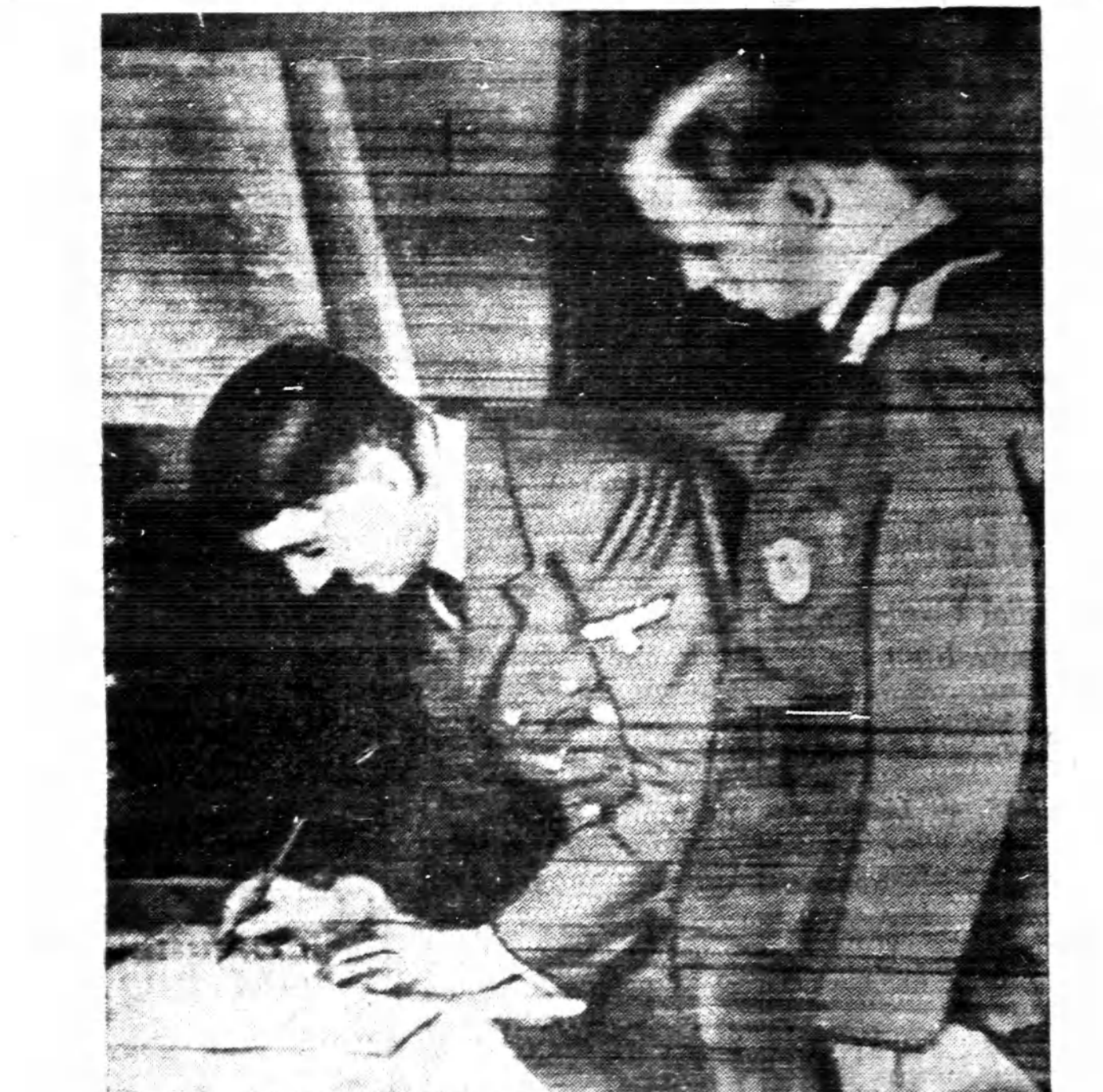
Ši nuotrauka padaryta Hitleriui pasirašant raštą, kuriuo atmetama Did. Britanijos ultimatumas — ištraukti kariuomenę iš Lenkijos. Po to, Did. Britanija pašalė Vokietijai karą.

Žaidimai įvyks kas trečią dieną, 8 val. vak., McCormick Club House, prie Blue Island ave., tarpe Leavitt St. ir Oakley ave., netoli Western ave. Visos klubvietės žaidimo vie-