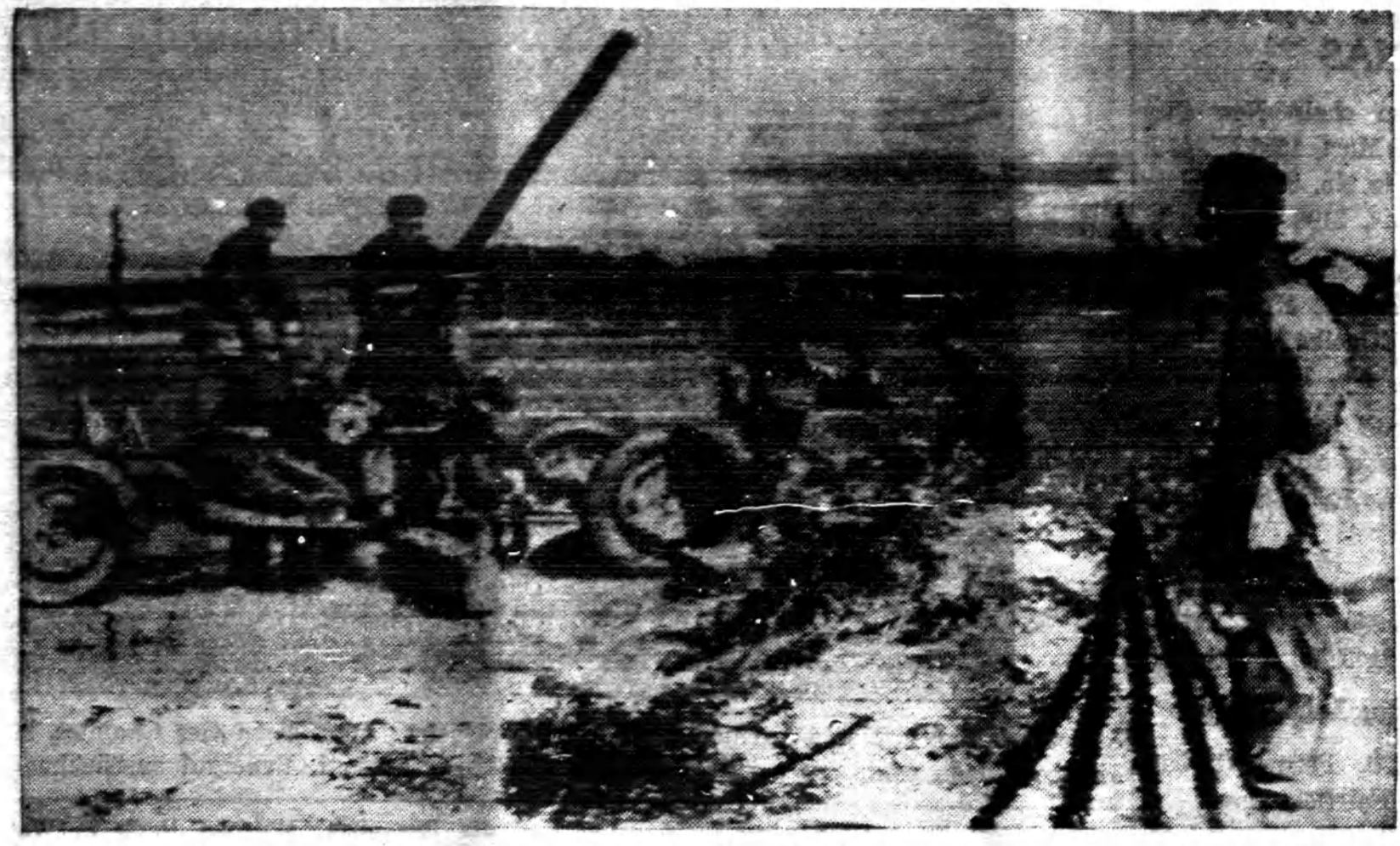
Lenkijos priešlėktuvinės kanočės, kuriomis apstatyta Varšuva ir kiti didesni miestai. Nežiurint to, vokiečių karo lėktuvai svaido bombas ant miestų ir kaimų, išnešdami į padangę visa, ant ko tik tos bombos nukrinta.

PASTABA: Ne vien tik Vyčių Choro nariai gali dalyvauti, bet ir pašaliniai, choro rėmėjai, kurie norėtų sykiu su jais keliauti, prašomi užsiregistruot iš anksto.