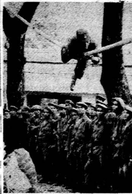
Kambodijos kariai treniravimo stovykloje

Vlikas buvo gavęs Lietuvos ka- talikų memorandumą — skundą dėl tikybos persekiojimo Lietuvo- je, nukreiptą į Sovietų Sąjungos komunistų partijos CK gen. sek- retorių L. Brežnevą. Drauge su memorandumu buvo gautas ir pareiškimas J. Tautų gen. sek- retoriui Kurt Waldheimui. Vlikas šiuos dokumentus išvertęs į an- glų kalbą su savo gegužės 24 ra- stu pasiuntė J. Tautoms. Be to, jie su atitinkamu gegužės 31 d. raštu buvo pasiūti ir valst. sek- retoriui W. Rogers, kad šis pa- vestų JAV ambasadoriui J. Tauto se iškelti JT Žmogaus teisių komi- sijoje religijos persekiojimo Lietuvoje klausimą.