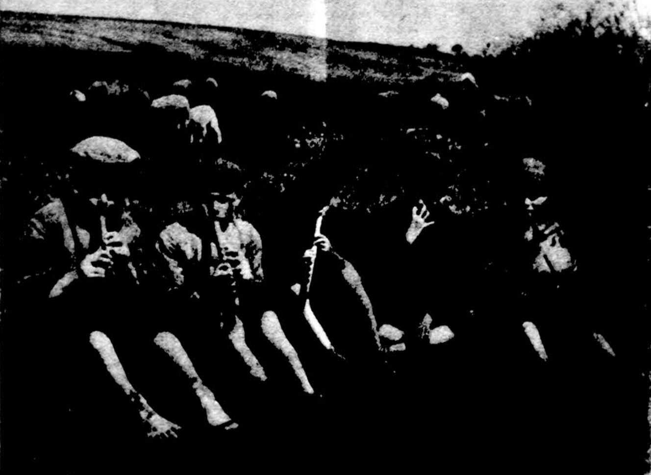
Balio Buračo nuotrauka iš Nepriklausomybės laikotarpio — „Piemenukai“. Fotografo Buračo 25 metų nuotraukų rinkinys 1937 metais pasaulinėje meno ir technikos parodoje Paryžiuje laimėjo aukso medalį.

2. Kaimo apologija perkurta liaudies daina Iš visų keturių didžiųjų Nepriklausomos Lietuvos poetų Miškinis savo eilėraščių nuotaika ir formalinėmis priemonėmis labiausiai priartėja prie dainų. Yra net eilėraščių, kuriuose pagrindinės dainų poetinės priemonės — maloniniai, mažybini žodžiai — sąmoningai