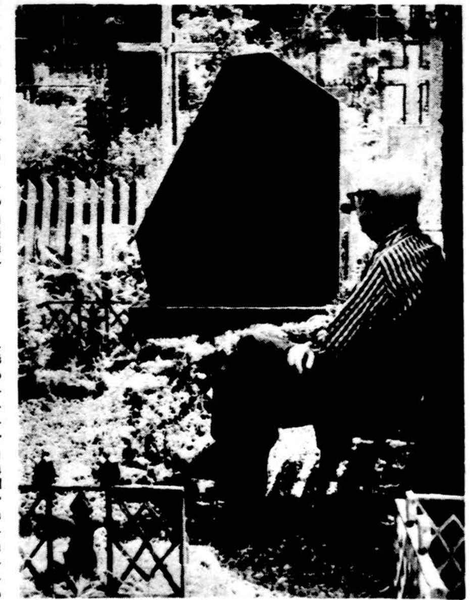
Aleksandras Stulginskis prie žmonos, mirusios 1962 metais, kape Panemunės kapinėse. Šalia žmonos buvo palaidotas ir jis pats 1969 metais.

Stulginskis išgėrė karčią kankinio taušų už mus visus iki dugno. Po Stalino mirties iš kalėjimo paleistas dirbo įvairiose stovyklose prie šiltnamių ar agronomų kolchozuose, kol 1956 m. amnestuotas galėjo grįžti į Lietuvą ir čia bent savo kaulus paguldėti. Stulginskis liks amžinai gyvas Lietuvos sūnų ir dukterų širdyse kaip visos iškiliausios valstybės vyrų, nepriklausomus demokratinės Lietuvos Respublikos kūrėjas. Baigti šiuos prisiminimus norėčiau Sibiro maldakūnės lietuvių rašytoja maldą, kuri, be abejo, buvo dažnai ir Stulginskio lūpose: „Priimk, Viešpatie, mano kancios auką, kad tik mano Tėvyne būtų laisva“.