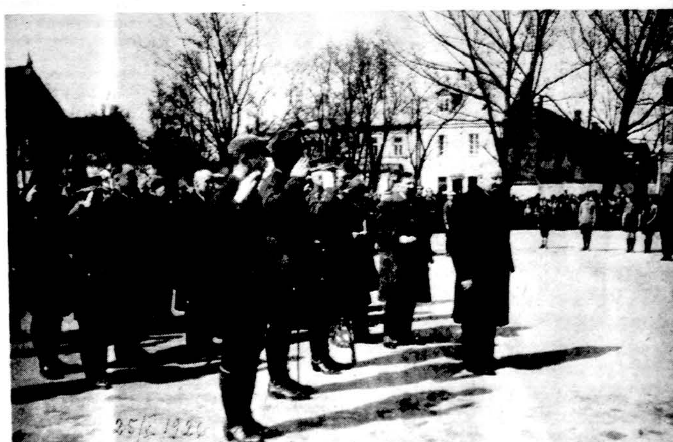
Lietuvos prezidentas Aleksandras Stulginskis dalyvauja skautų iškilimėse 1926 m. gegužės mėn. 25 d.

Kadangi mūsų akimis kiekvienas delsimas buvo lygus nusikaltimui, tai savo tarpe svarstėm, ar nepradėti revoliucijos keliu iš apacios, vietose statyti mūsų (Nukelta į 2 psl.)