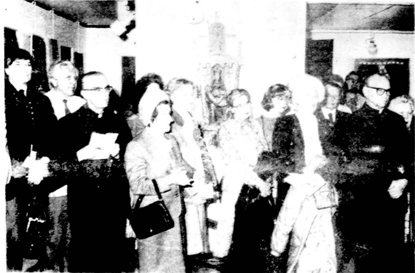
Balis lankytojų Lietuvių tautodailės instituto parodos Čiurlionio galerijoje, Jaunimo centre, kovo mėn. 1985 m. vasario mėn. 15 d. Parodą dar galima apžiūrėti šandien ir rytoj tarp 11 v.r. ir 7 v.v.

Pagarba priklausomoms visiems mūsų tautos draugams. Mūsų tauta, deja, turi daug nuostabių draugų, bet daug priešu... Ign. Urbomas Gary, Indiana