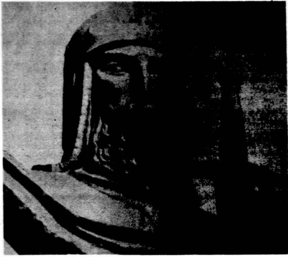
Vytauto Kašubos skulptūra — „Lietuvos karalius Mindaugas.“

Lietuviai labai didžiavosi ta romėniškąja kilmė ir, kai lenkai per derybas dėl unių lietuviams žemindavo kaip buvusius paskutinius krikščionybę priėmusius Europoje, mūsėškiai jiems atsisakė davę maža daug tokius žodžius: „Mes esame Romos bajorai, ne bet kokie, kaip jūs!“