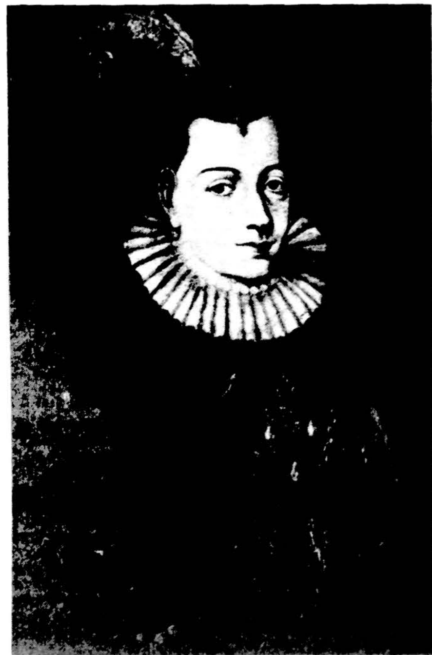
Nežinomas dailininkas. Ona Ketlerytė-Radvilienė. XVI a. pabaiga (drobė, aliejus). Verkių rūmai.