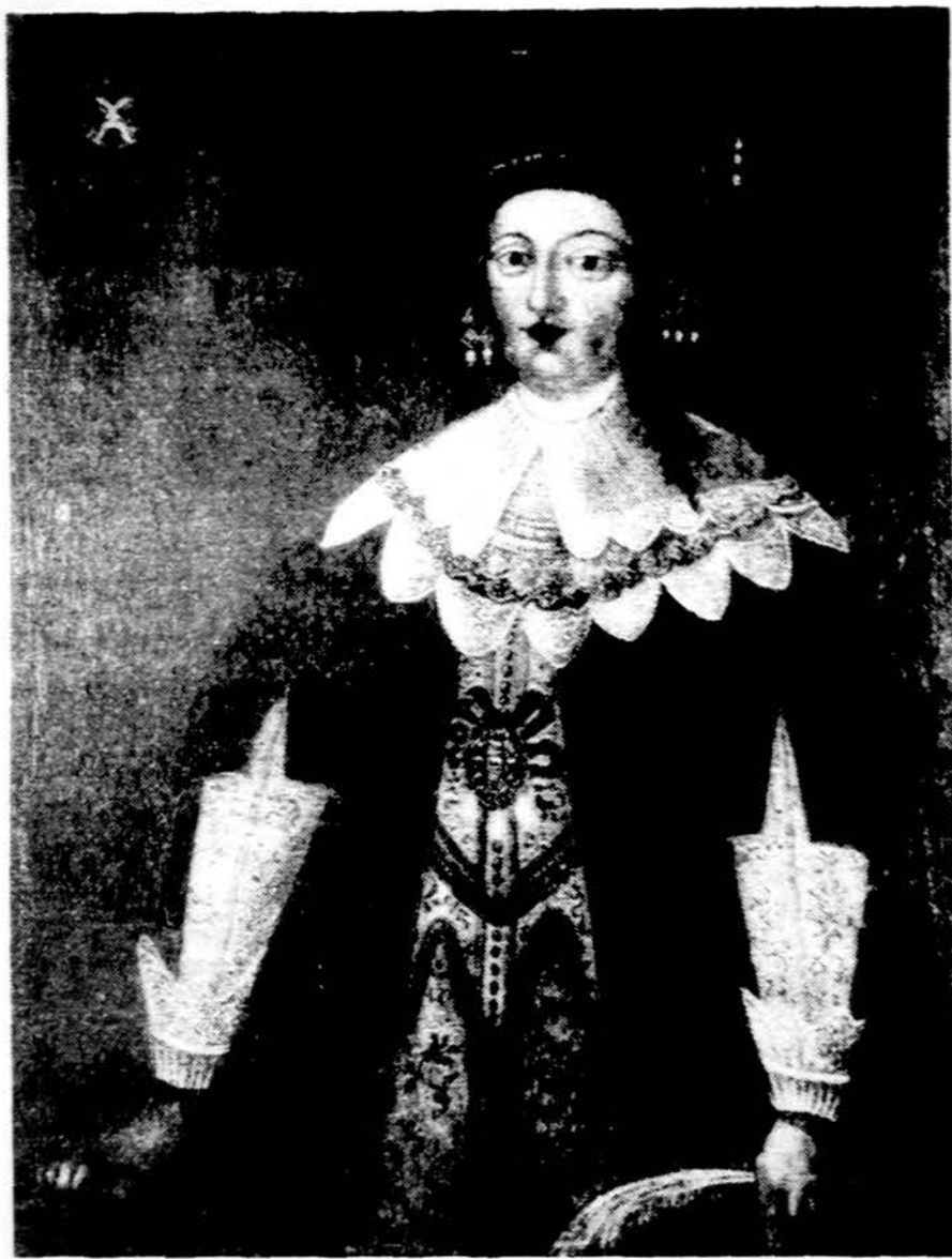
Nežinomas dailininkas. Nežinoma Oginskių giminės moteris. XVII a. (drobė, aliejus). Kauno Čiurlionio dailės muziejus.

Autorė, žinoma savo erudicija ikonografijos ir kostiumologijos srityse, jau publikavusi Lietuvos renesanso antkapių ištyrimą, čia pateikė sistemingą aprašymą Lietuvos ponijos — didikų, bajorų ir dvasikių — XVI-XVIII amžių alejumi tapytų portretų, kiek jų surinkta ir saugoma Lietuvos, Gudijos bei Lenkijos muziejuose.