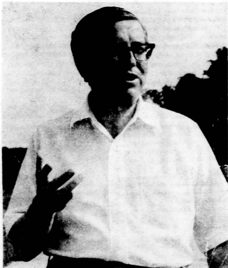
Dr. Juozas Girnius vienoje iš vasaros studijinių savaitių Dainavoje, Manchester, Michigan.

Šitaip integraliai sutapas su poetų žemininkų karta, Juozas Girnius ir vėlesniuosius jų užmojus nestovėjo nuošalyje. Kai