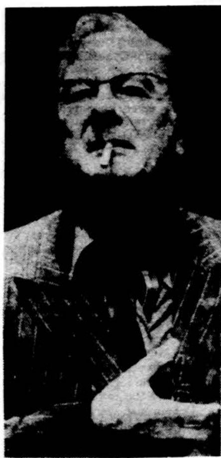
Aktorius John Gielgud