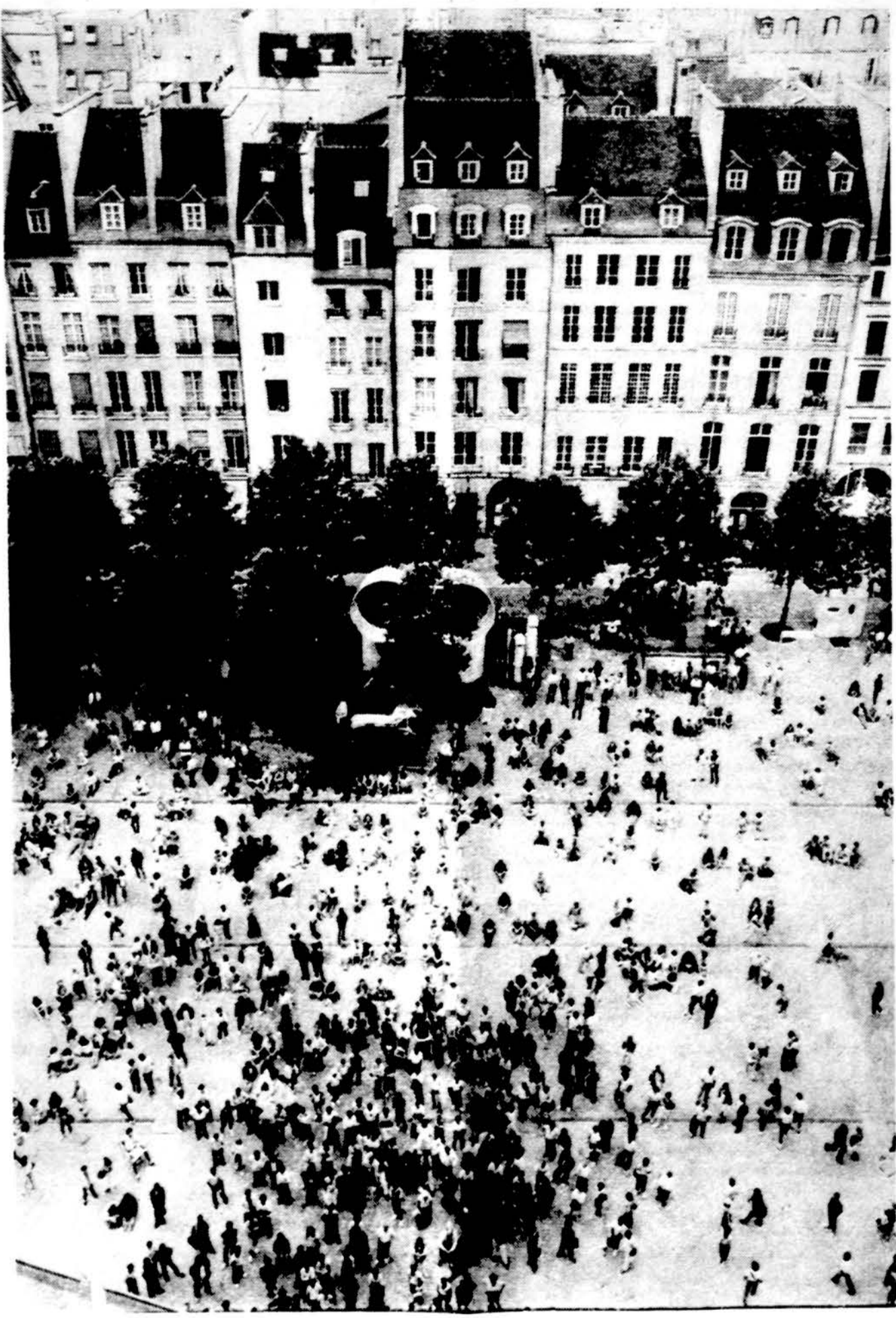
„Centre Pompidou Plaza, Paris, 1984“ — iš Algimanto Kežio, SJ fotografijų serijos „Paryžius, 1984“. Šios serijos darbu yra išgiję Paryžiaus Bibliothèque Nationale ir Musée Carnavalet savo nuolatiniams kolekcijoms.