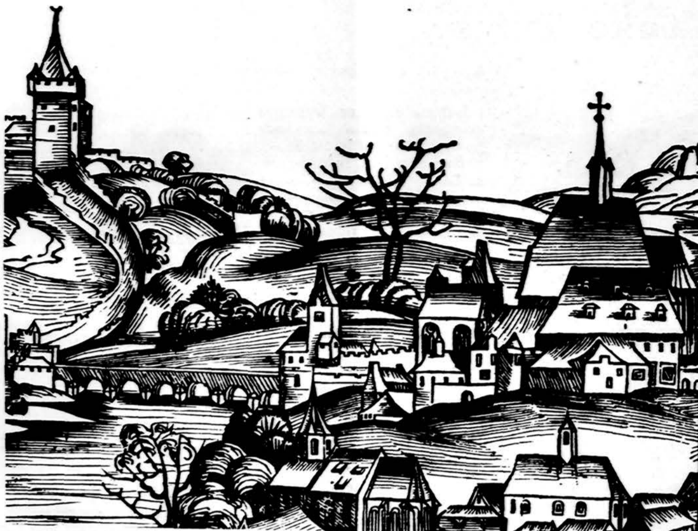
Nežinomo dailininko viduramžių panorama.

Daugiausia galimybių pasiliko rašytojui savo jausmų ir perky-