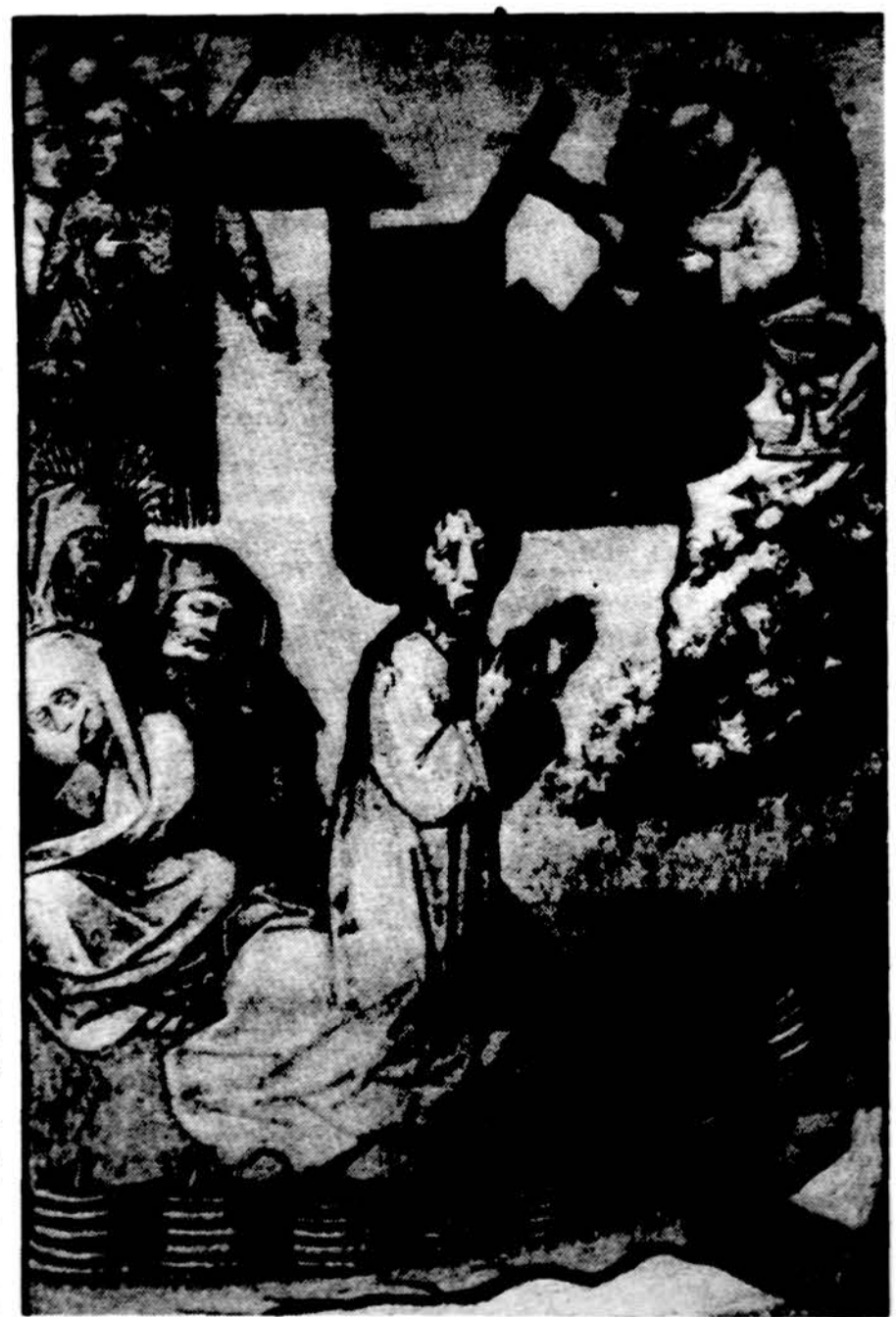
14 šimtmečio vokiečių mokyklos nežinomo dailininko paveikslas, vaizduojąs Kristaus kančią Alyvų darželyje.