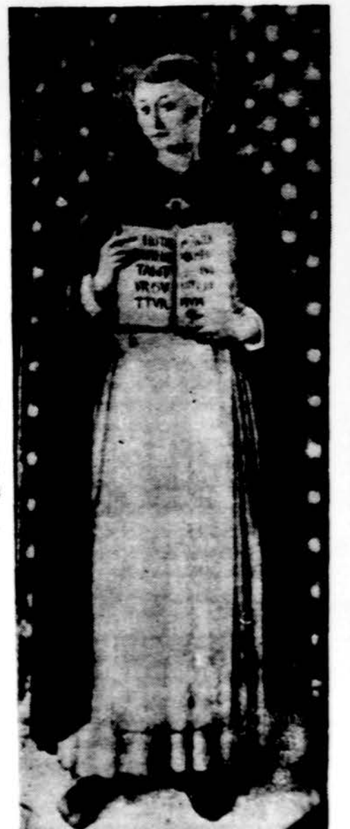
Sv. Tomas Akvinietis

Himno pabaigoje vėl pasigirsta daugiaprasmiš „pange“, kviečias garbinti Tėvą ir Sūnų. Žodį „pange“ Tomas pasiskolijo iš senesnio himno, skirto pagarbinti kryžui. Tame himne žodis „pange“ turi kovingesnį atspalvį. Jis yra šitoks: Pange lingua gloriosi/Lauream certaminis . Lietuviškai tai būtų: „Skelbik (ar muškė būgna) garbingos kovos laurus“ (pgl. (Nukelta i 2 psl.)