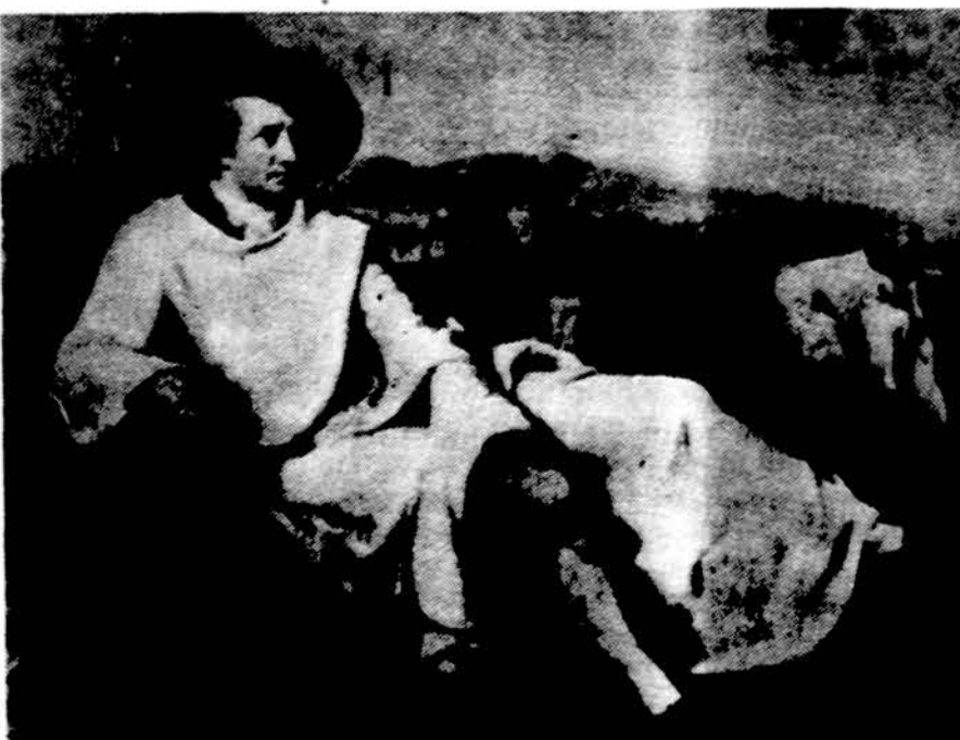
Dailininko Tischbein paveikslas „Goethe Italijoje“.