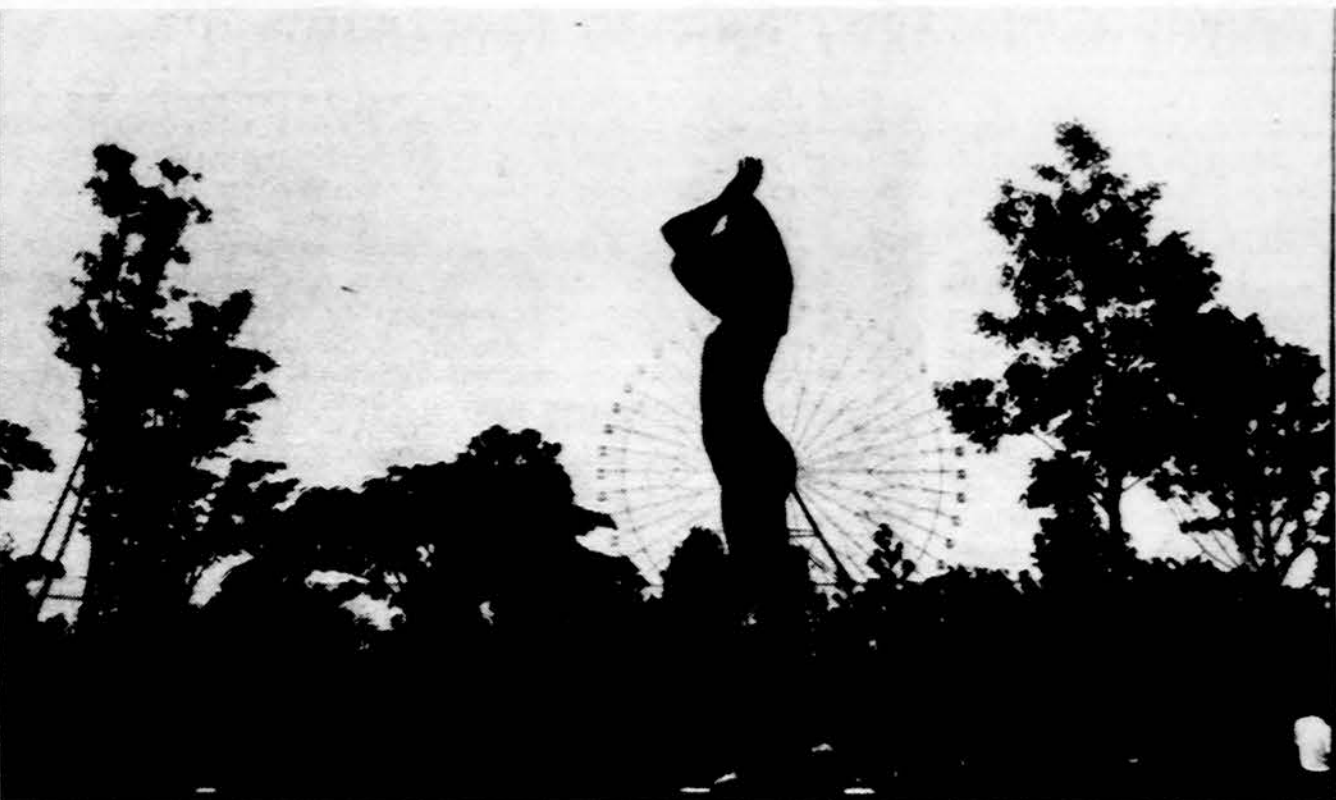
Skulptūra parodoje Expo '85, Tsukuba, Japonija.

Į Dievą Bradūnas eina, pradėdamas nuo žemiškos tikrovės. Į Donelaičio lūpas jis net įdeda klausimą, nuo ko jis turi pradėti Dievo žodį skelbti: ar „nuo jūsų rūpesčių, ar nuo savęs“ (p. 86). Nuo patirtinės tikrovės Bradūnas pereina į antgamtinę. Žemiški dalykai jam priartėja reli-