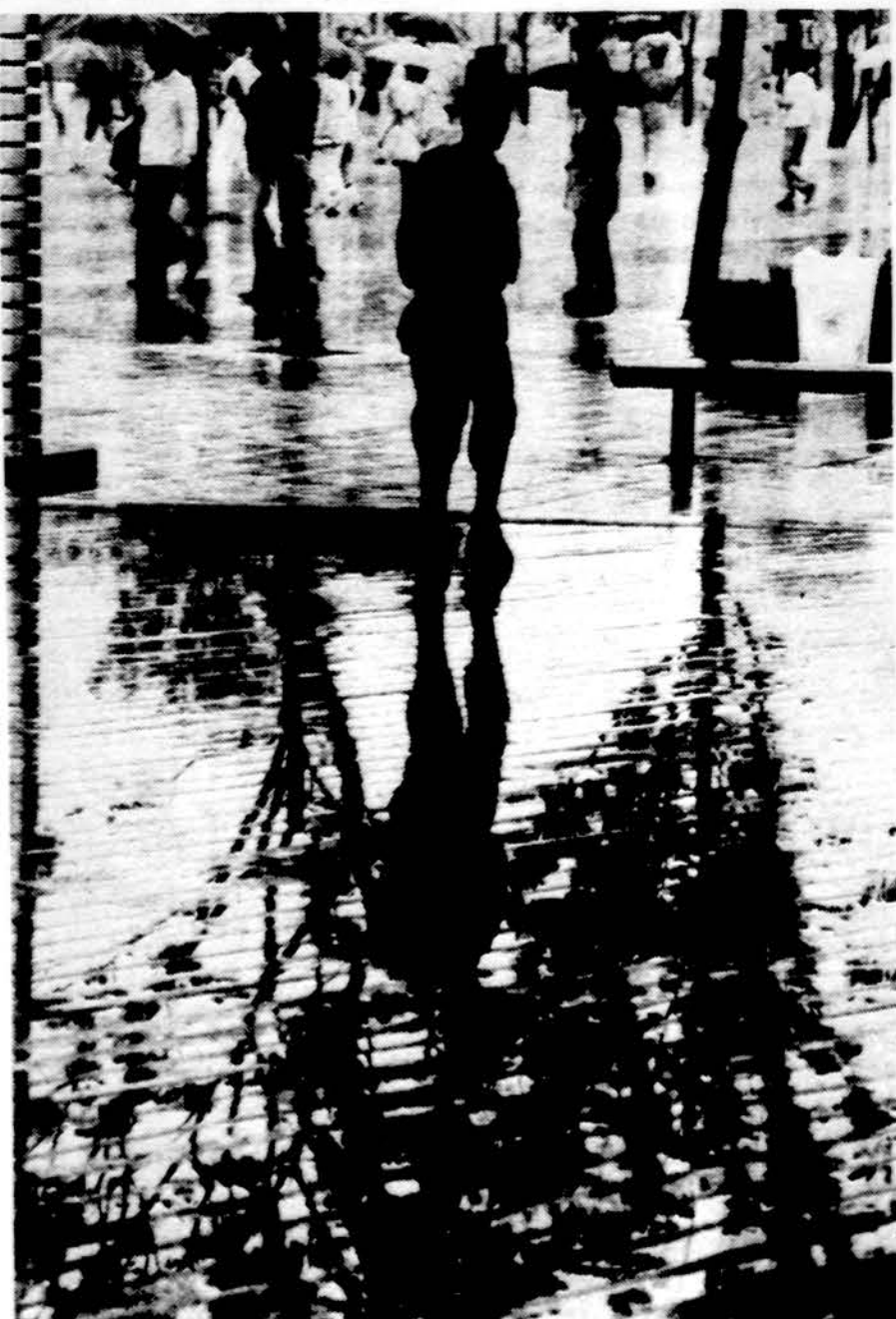
Expo '85 — skulptūra ir minia, Tsukuba, Japonija.