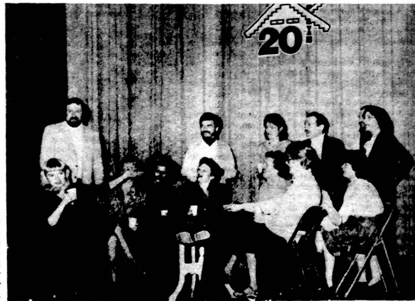
14 Antro kaimo 20 metų sukaktovinio spektaklio 1984 m. vasario mėn. 4-5 d. Jaunimo centro scenoje, Chicagoje.