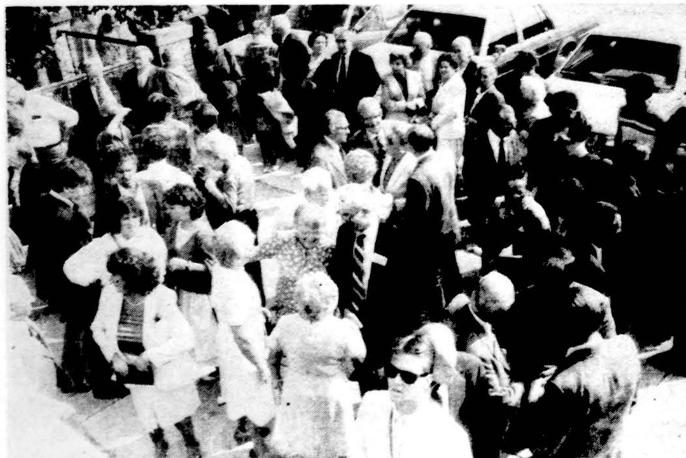
Šeštadienio rytą pirmieji atvykę į Kongreso atidarymą būriuoja priė Jaunimo centro.

Dabar jau parvežt spalvas namo. Pro jų žiūronus žvelgiame į ateitį. Jinai padangėje plasnėja. (Auka ir meilė — Jos du balti sparnai didžiuliai.) Ir neša neša mums jinai Gyvenimą ir prasmę, ir buvimą, Praeties dainavimą ir ryto saulę, Dar netekėjusią... Jolė, 1985.9.7