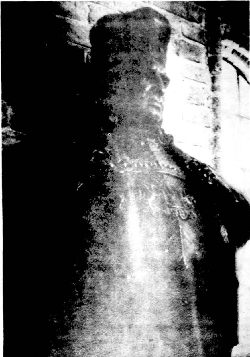
Vytauto Didžiojo skulptūra Traku pilyje.

Lietuviai išsiviams daugiausia dėmesio kreipia arba į praeitį — į kunigaikštius, į tautinio atgimimo laikotarpį, į Nepriklausomybės dvidešimtmetį — arba į ateitį, į numatomą ir taip laukiamą Nepriklausomybės atstatymą. Jeigu mūsų dėmesio centre vis tebėra Lietuvos laisvės atgavimas, kaip daryti lyg ir keista būtų. Į praeitį žiūrime, kad surastume sau ir kitiems įrodymų — ar tai būtų idiliškų prisiminimų iš Nepriklausomos Lietuvos gyvenimo, ar tai būtų herojiškų kunigaikštinių žygių — kurie paremtų mūsų ateities viziją. Dabartį daugiau ar mažiau ignoruojame, nes ji mums nepriimtina ir nesiderina su ateities vizija. Todėl mūsų veikla — politinė ir šiek tiek kultūrinė — nukreipta į