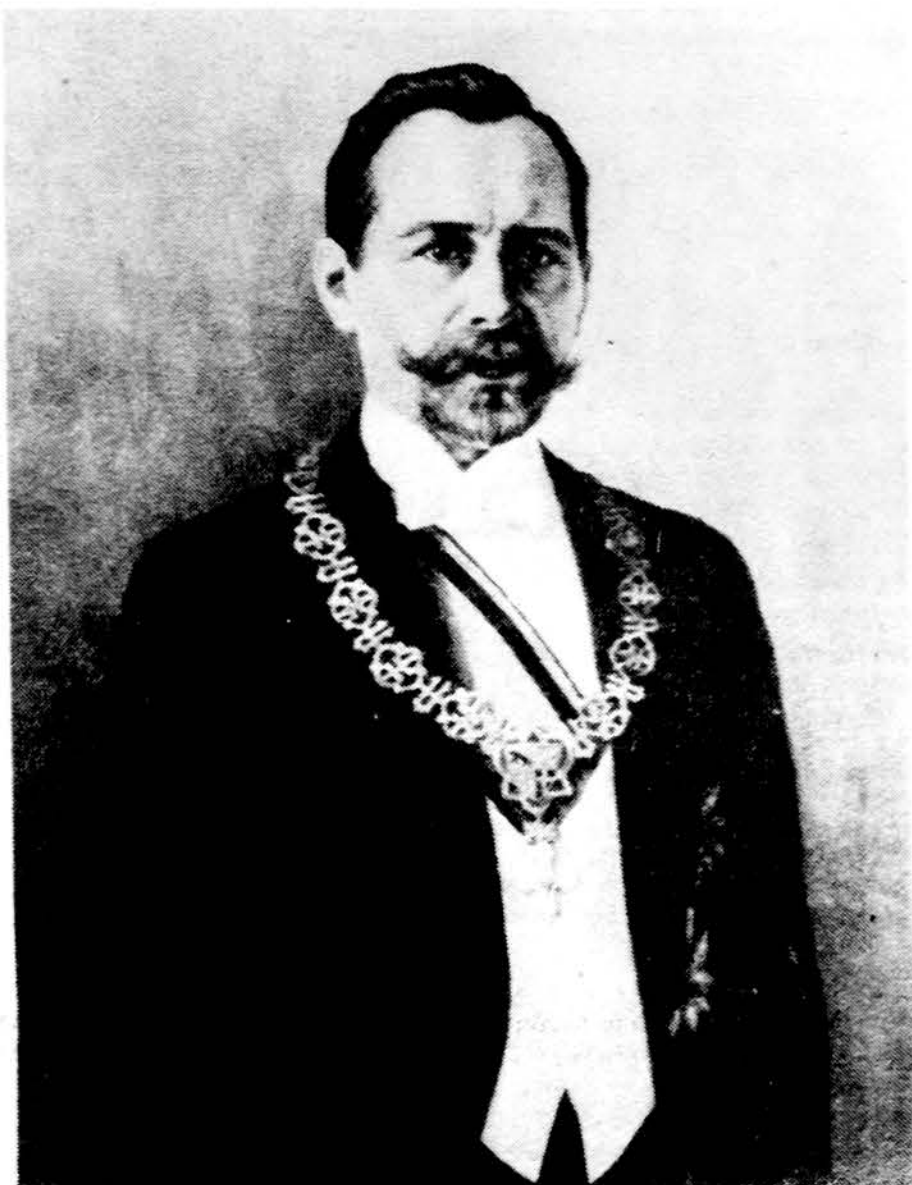
Antanas Smetona, Nepriklausomos Lietuvos pirmasis laikinasis ir trečiasis prezidentas.

Laikinąją vyriausybę sudarius, visų nuotaika pakilo, nes padarytas realus žingsnis Nepriklausomos Lietuvos valstybės atkūrimui. Tačiau tos vyriausybės būklė buvo nepavydėtina. Valstybės atkūrima reikėjo pradėti iš pradžių, nieko neturint. Darbo sąlygos labai sunkios, nes Vilniuje dar tebesimininkavo vokiečiai, kūrėsi lenkai ir bolše-