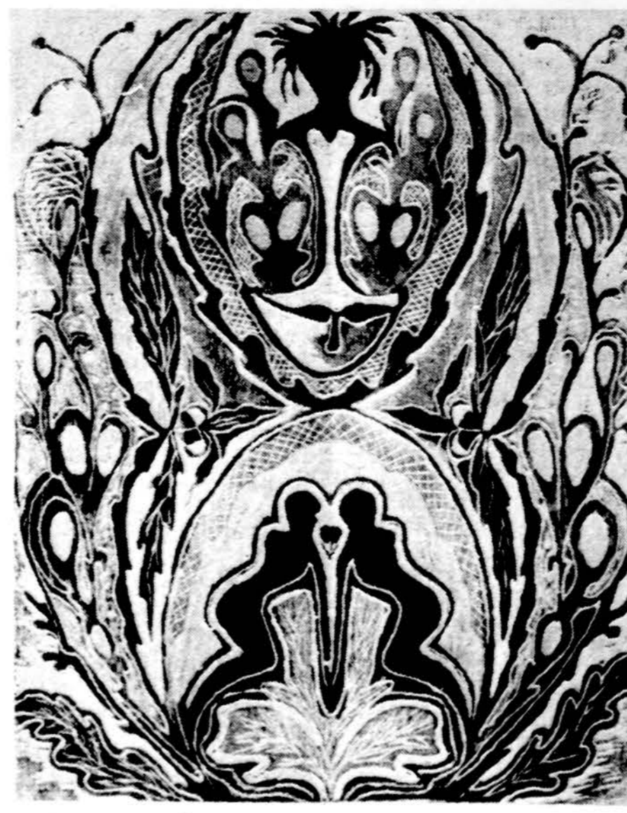
„Susirūstintą smarkus Perkūnas“ (medžio raizūnas, 1987)

18 siemėtinės Vasario 16 parodos Čiurlionio galerijoje, Jaunimo centre, Chicagoje, kurioje dalyvauja 28 lietuviai dailininkai iš JAV, Kanados ir Europos. Paroda