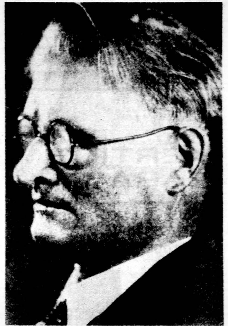
Kazys Grinius, Nepriklausomos Lietuvos antrasis prezidentas.

Taigi vieni sako, kad Steigiamojo seimo pirmininkas ejo ir prezidento pareigas, kiti – jis buvo laikinoju prezidentu išrinktas, o tretieji – išrinktas prezidentu pagal jau nuolatinę konstituciją. Šiam nevienodumui išspręsti mums tenka grįžti prie Laikinosios Lietuvos valstybės konstitucijos, kurios 9-tas paragrafas sako: „Iki Respublikos Prezidentas bus išrinktas, jo pareigas eina Steigiamojo Seimo pirmininkas“ (KRač, 116). Reikia Aleksandras Stulginskis buvo laikinoju prezidentu Steigiamojo seimo metu. Tą sprendimą paremia ir Adolfas Šapoka nurodydamas, kad Pirmasis seimas „išrinko konstitucijos nustatyta tvarka prezidentą Aleksandrą Stulginskį (XII.21), kuris ligi tol, kaip Steigiamojo seimo pirmininkas, ejo prezidento pareigas“ (AS, 571). Ir galutinai išsprendžia šį klausimą Vyriausybės žinios . Po Aleksandro Stulginskio parašu dedamas šitoks titulas: „E. Respublikos Prezidentu pareigas Steigiamojo Seimo Pirmininkas“. Ir toks titulas buvo naudojamas iki Aleksandro Stulginskio buvo išrinktas Pirmojo seimo prezidentu (VŽ, 38 – Nr. 119). Po išrinkimo jau atsirado kitas titulas: „Respublikos Prezidentas“ (VŽ, Nr. 121,