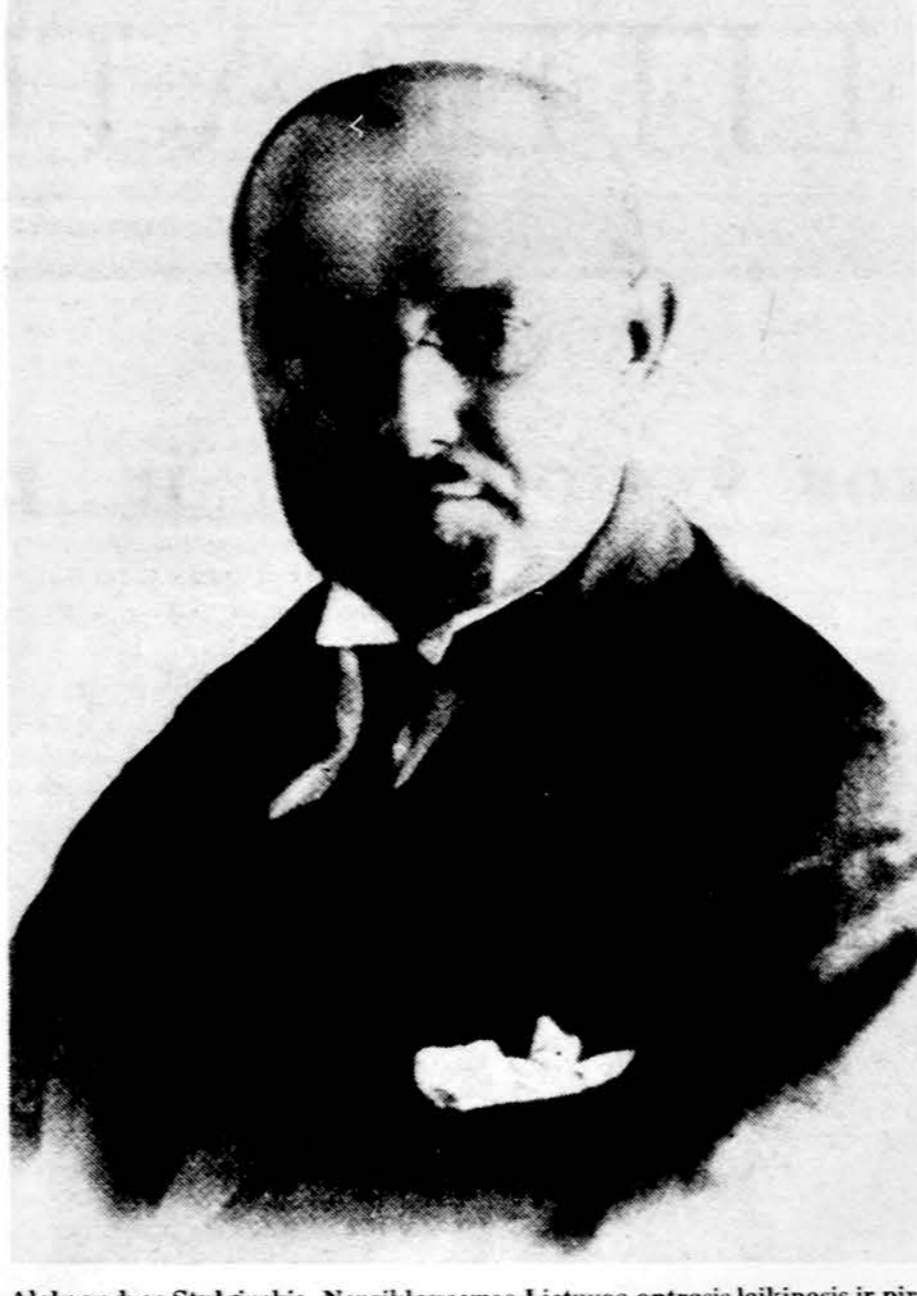
Aleksandras Stulginskis, Nepriklausomos Lietuvos antrasis laikinasis ir pirmasis prezidentas.