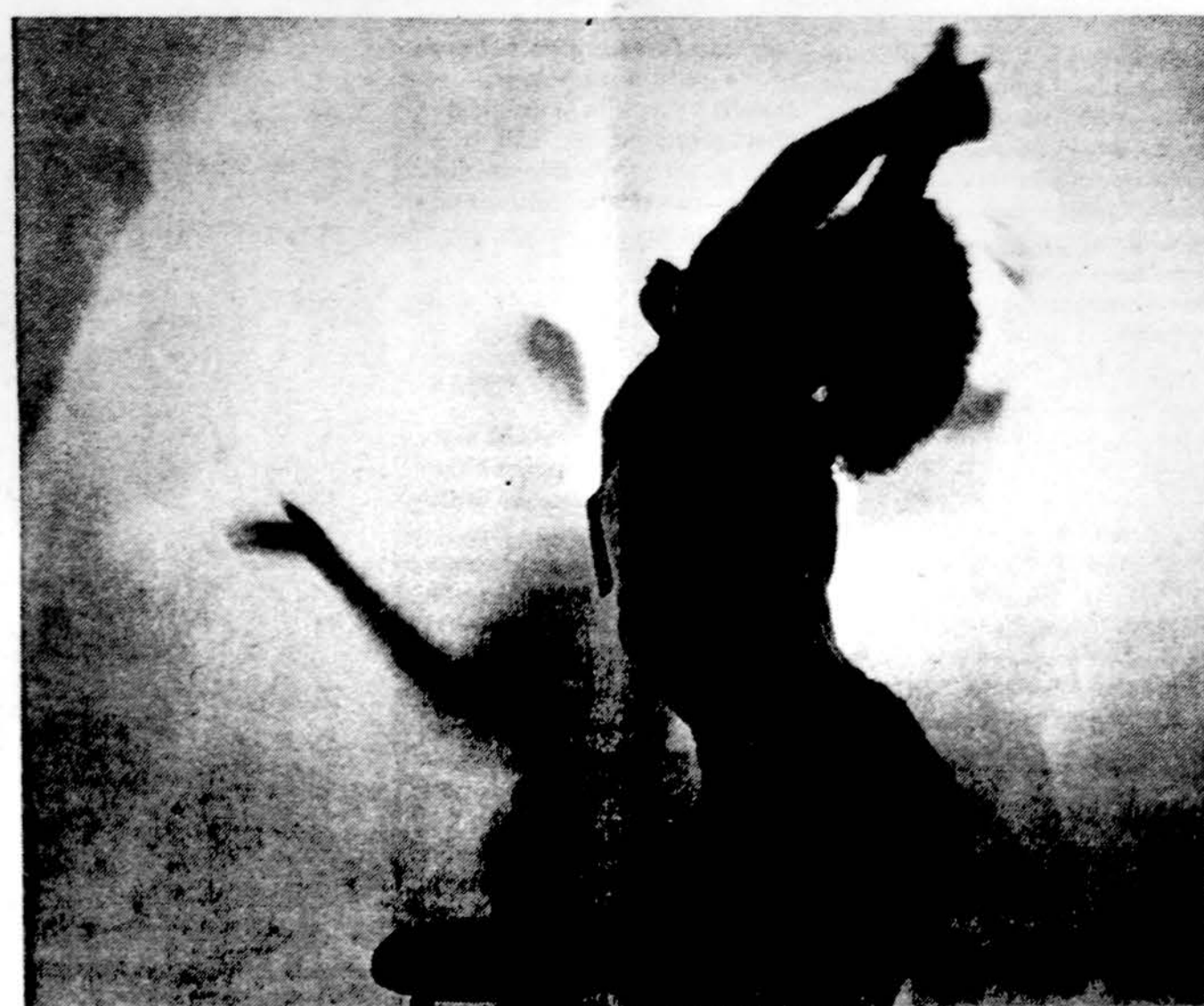
Žmogaus kūno judesys.

Ar jums nenuostabu, kad šitokiai savo pirmajai meilei, deivei šimtavardei, arba, šnekan teisingiau, šitam šaldytuvui, šitai tiek metų praeityje ji nuozmiai sloginusiai chimera Gustaitis yra sukūręs visą litaniją gražiausių metaforinių vardų bei epitetų: žiedeli pinavijos, žvaigždėle, stirna, zylė, žemuogėle... Jei tokį švelnybių vardyną Saulės šermenų autorius yra sukrovęs tik šiame viename savo kūriny, tai kur čia besuškaičiuosi, kur čia beišvinišė visų tų dievaitės Meilės pagarbiniū skirtų jo kūryboje prižarsytų ir prisagstytų imantriausią švelnybiū bei karštybiū epitetu, prie jos altoriaus atkalbėtų maldų, prismilkytų ritualinių smilkalų? Peklininko vyrško potencialumo hipnozės itaigoje skaitytojui kartais atrodo, jog ir pagrindinės visatos ašies sukimas kažin ar nebus tik erotiniū aistrų dinamikos pokštas, jog ir Newtono kūnų traukos dėsnis ar