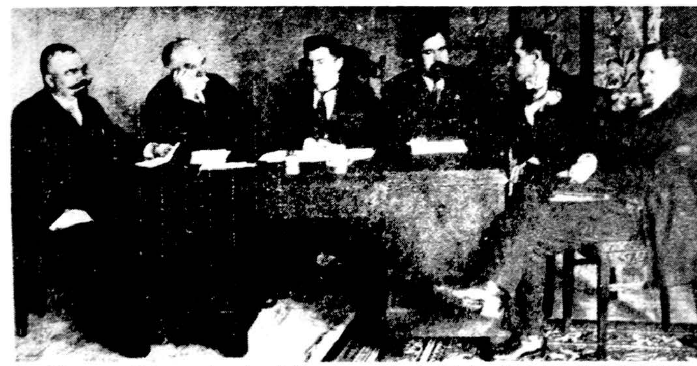
Nepriklausomos Lietuvos pirmosios laikinosios vyriausybės nariai: (iš kairės) Jonas Yčas — švietimo ministerijos valdytojas, Petras Leonas — teisingumo ministeris, Augustinas Voldemaras — ministeris pirmininkas ir užsienio reikalų ministeris, Martynas Yčas — finansų ministeris, Juozas Tūbelis — žemės ūkio ir valstybės turtų ministeris ir Vladas Stašinskas — vidaus reikalų ministeris.