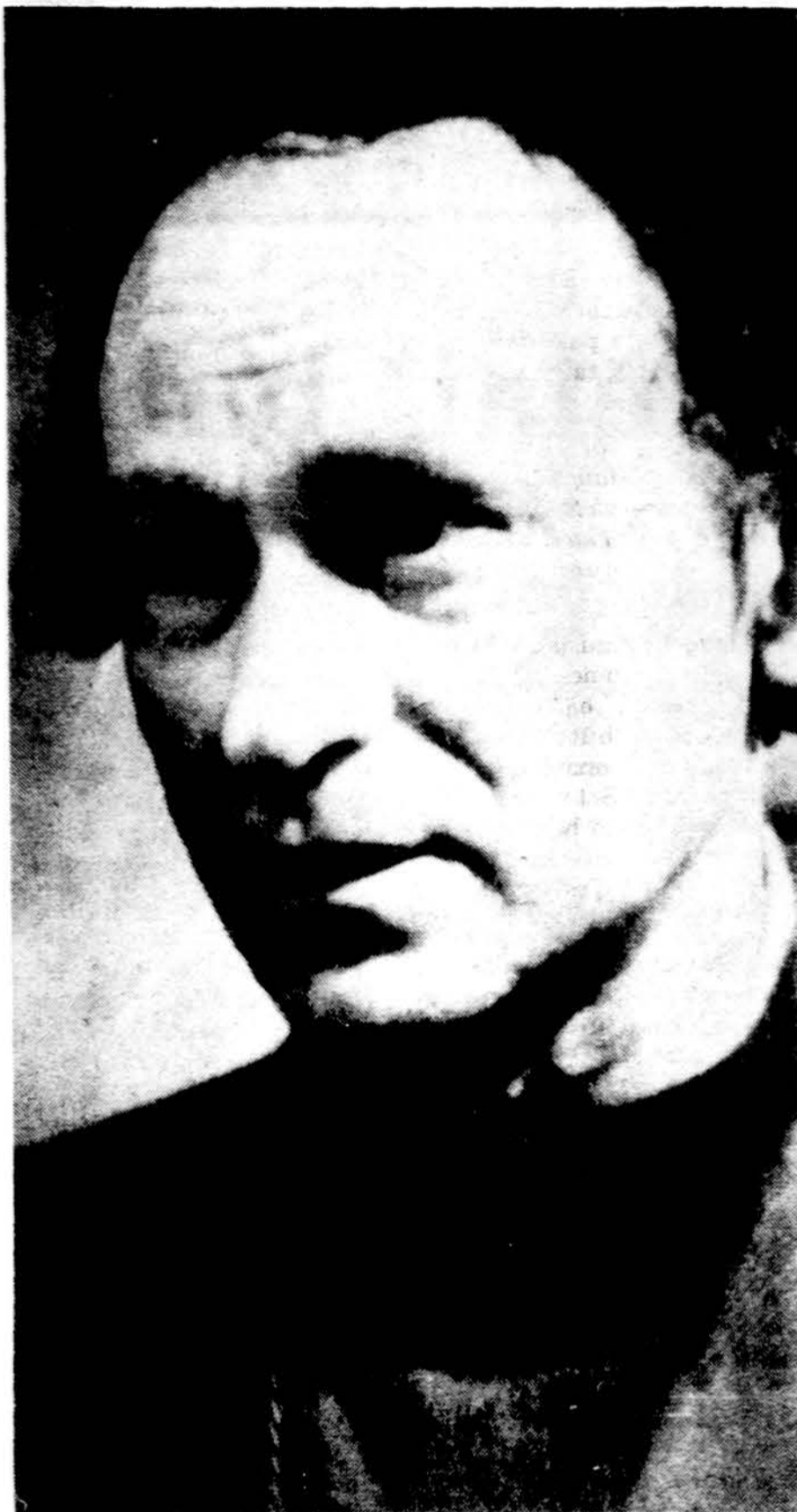
Jonas Mekas