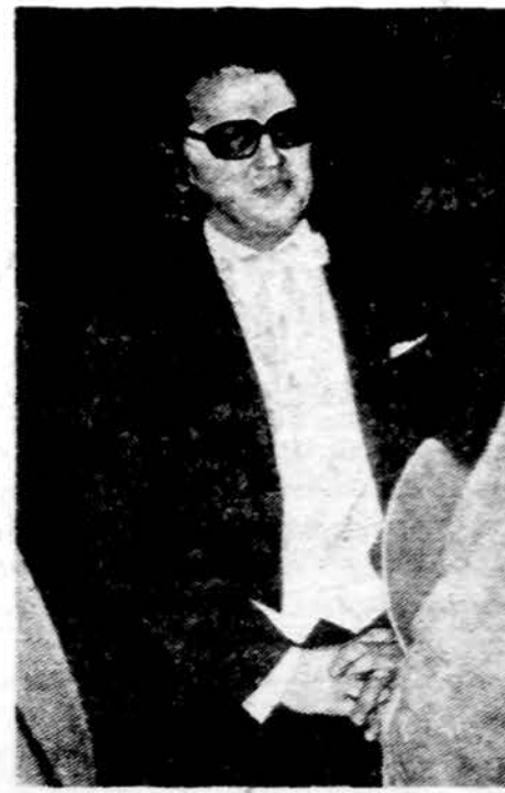
Lietuvos valstybinės filharmonijos simfoninio orkestro vyriausiasis dirigentas Juozas Domarkas.