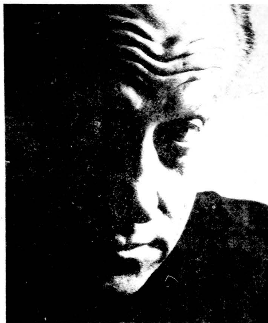
Kompozitorius Antanas Rekašius