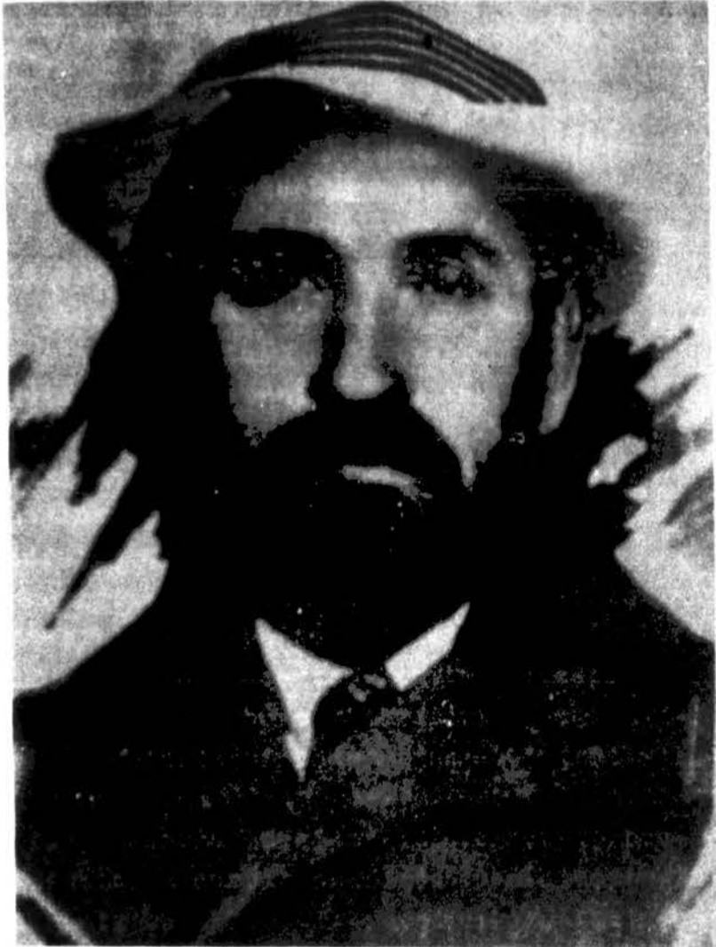
Pranas Dovydaitis 1934 metais.

Šios knygos pabaigoje po viena nuotrauka užrašas: „Ši žemė Ga-