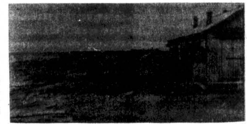
Gari gyvenvietė Sibire, kur Sosvos upės pakrantėje 1941 metais buvo išlaipinti lietuvių kaliniai, tarp kurių buvo Pranas Dovydaitis.