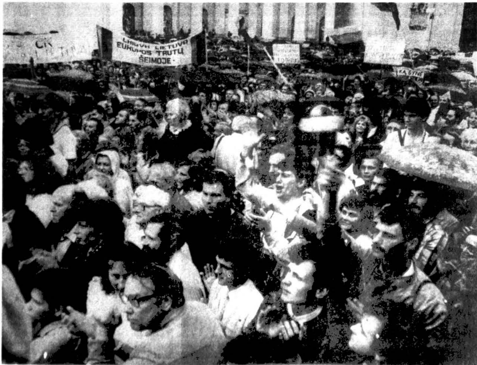
Atgimimo pradžia – vienas iš pirmųjų susibūrimų Lietuvoje; Katedros aikštėje, Vilniuje, 1988 m. birželio 26 d. susirinko 20,000 žmonių.

Vasario 16-oji mums, kituose pasaulio kraštuose, ir tėvynėje gyvenantiems lietuviams, visuomet teikė viltį, kad Lietuva vėl sulauks laisvės. Neseniai teko išgirsti pasisakymą, jog Vasario 16-ąją švenčia tik seni, pripratę rengti minėjimus, kad galėtų apvertki „senus gerus laikus“. Daug modernesnė šventė – Kovo 11-oji. Nors tie žodžiai galbūt juokais pasakoti, bet jie niekuomet neturėtų išsprūsti iš lietuvių lūpų. Be Vasario 16-osios nebūtume turėję nei Kovo 11-osios! Turime tikėti, kad, kol pasaulyje bus bent saujelė lietuvių, jie šves ir Vasario 16-osios, ir Kovo 11-osios šventę. Taip pat turime tikėti, kad lietuvių tautinės tapatybės išlikimas didžia dalimi priklauso ir rišasi su lietuviška spauda. Kol pajėgsime leisti ir skaityti spausdintą laisvą lietuvišką žodį, niekas mūsų nenugales, niekas nenuautins!