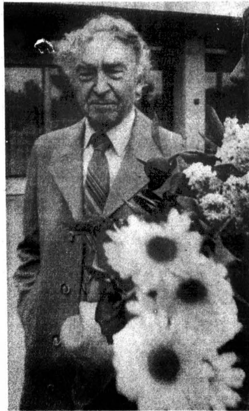
Šių metų vasario 2 dieną poetas Bernardas Brazdžionis šventė 88-ąjį gimtadienį.

Imperatoriai nebūtinai valstybes valdo, Ir išminčiai išmintį nebūtinai mum barsto, Admiralai plauko ne laivais, o geldom, O visiems visiems pakanka vieno – karsto.