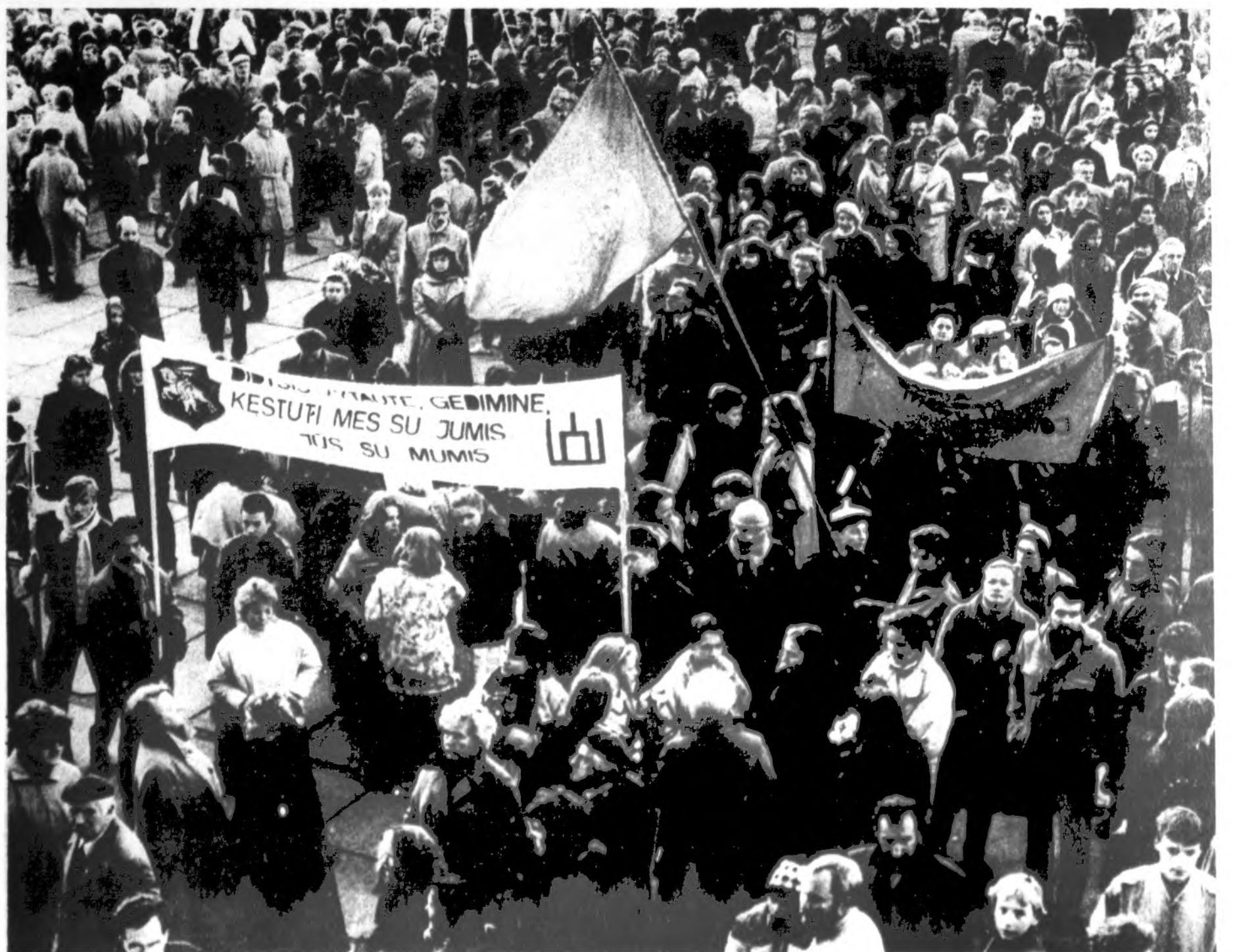
(a. II.) Lietuvos Persitvarkymo Sąjūdžio suvažiavimo diena Vilniuje 1988 m. spalio 22 d.

Lietuva pirmoji aktyviai suburdėjo Gorbaciovą „perestroikos" metais. 1988 metais rimties būsenoje dar buvo Lenkija, Čekoslovakija, Vokietijos DR, Vengrija, o Lietuvoje nuvilnijo šimtą tūkstantiniai susibūrimai. Viešai prabilt apie neišvengiamą Nepriklausomybės atstatymą, apie tautos pamintas teises. Kodėl Lietuvoje? Imperijos griūtis (Nukelta į 3 psl.)