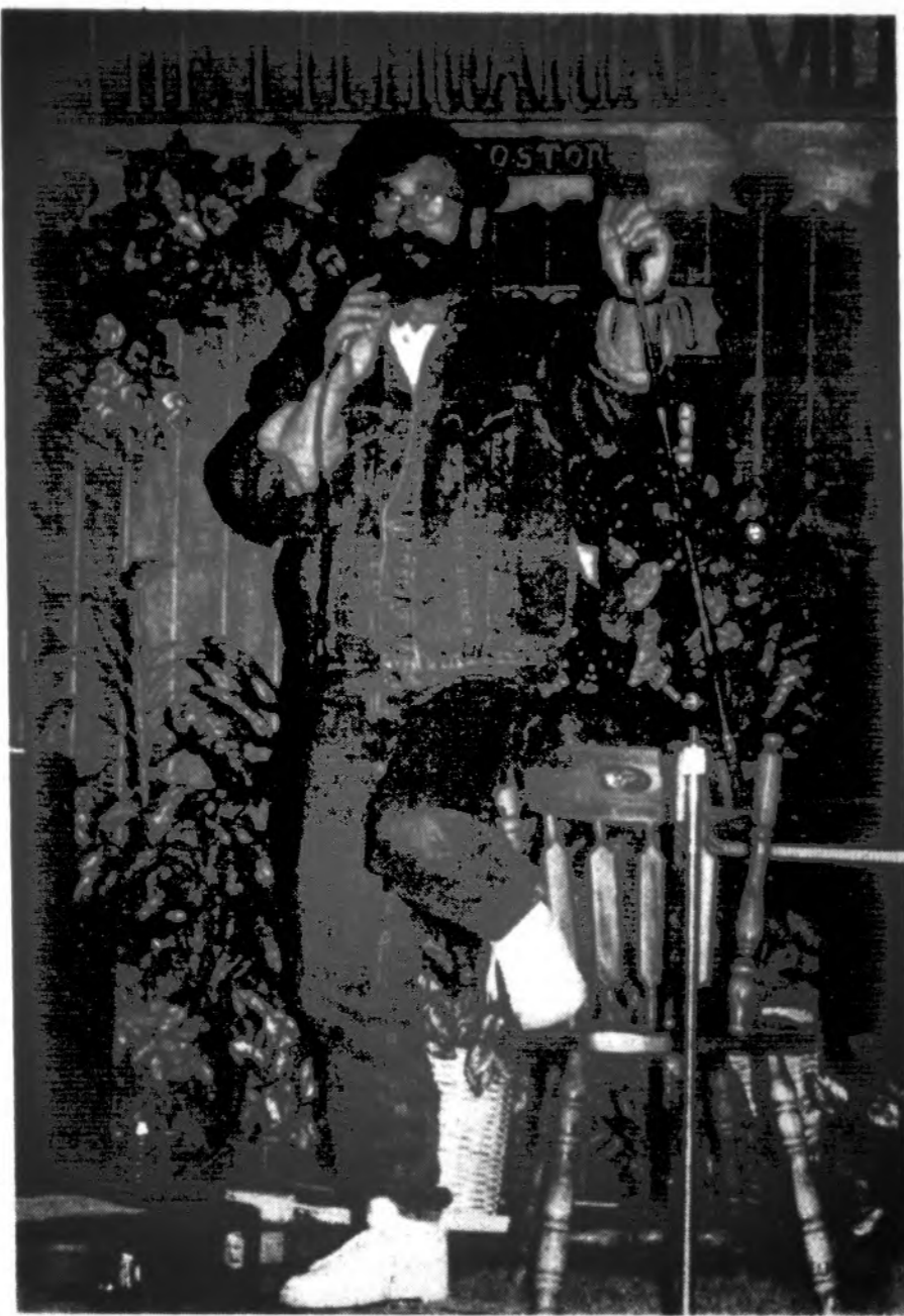
Vytautas Kernagis koncertuoja Bostone, „Lietuviškoje sodyboje“.