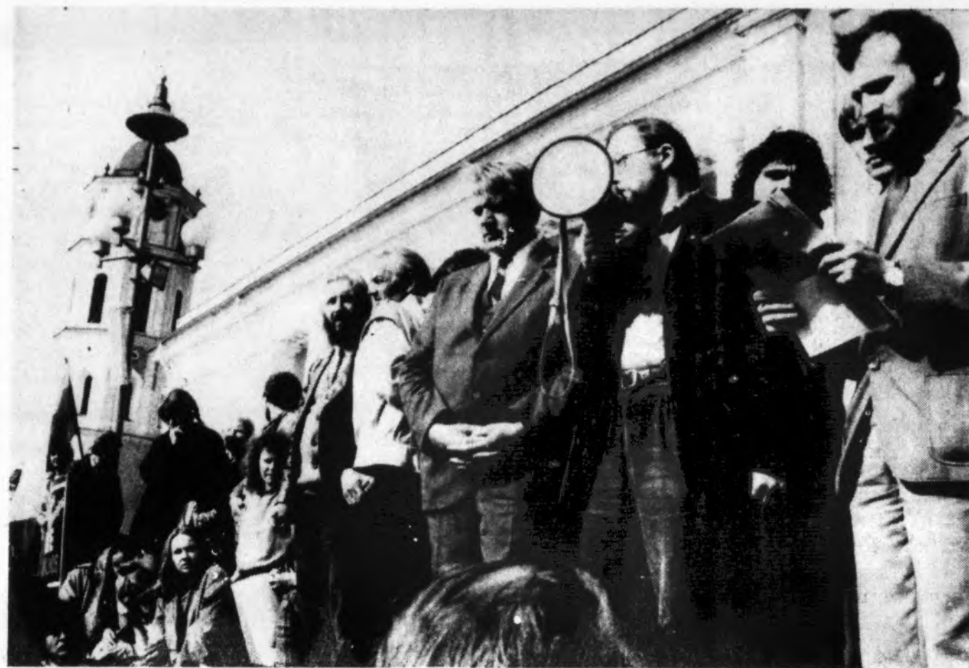
Susibūrimas Katedros aikštėje, Vilniuje, 1988 m. rugsėjo 29 d. protestuoti prieš miilicijos veiksmus. Kalba profesorius Vytautas Landsbergis.

Jeffrey Goldberg savo straipsni baigia šitaip: „Atrastasis YIVO archyvas įgalina prisiminti žydiškąją Europą ne vien dėl jos išuždytų piliečių ir išniekintų Šabas. Jis taip pat yra tyli užuomina, kad holokosto baisybė gali būti perteikta ne tik per stiklo ir plieno martirologijos muziejus, bet parodant, labai paprastai ir akį nerėžiančiai, popieriaus skiautes, kaip šiosios“. Ir todėl mums atrodytų, kad lietuviai teisingai nutarė pasilikti šiuos dokumentus — ir visa tai, ką jie liudija, savo pačių šalyje. Ir mes branginame tą nuostabų lobį. Nes ir mes žinome, ką reiškia būti bandomiems ištrinti, nušluoti nuo žemės paviršiaus. Norime saugoti tą atminimą.