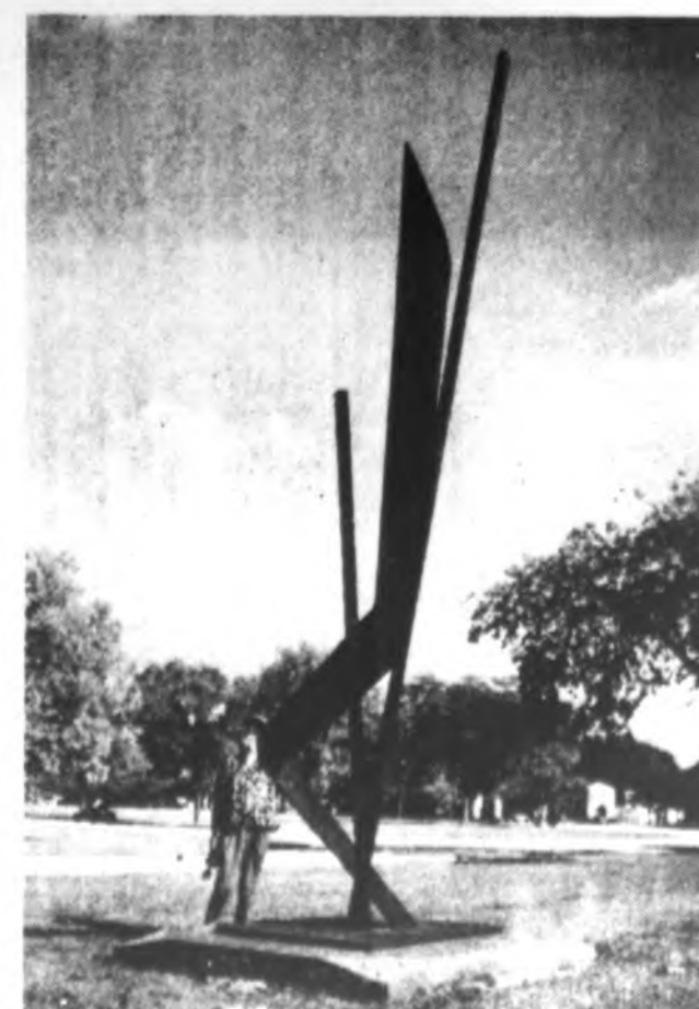
Paminklas pranciškonams (Corten plienas) Riverside, Illinois