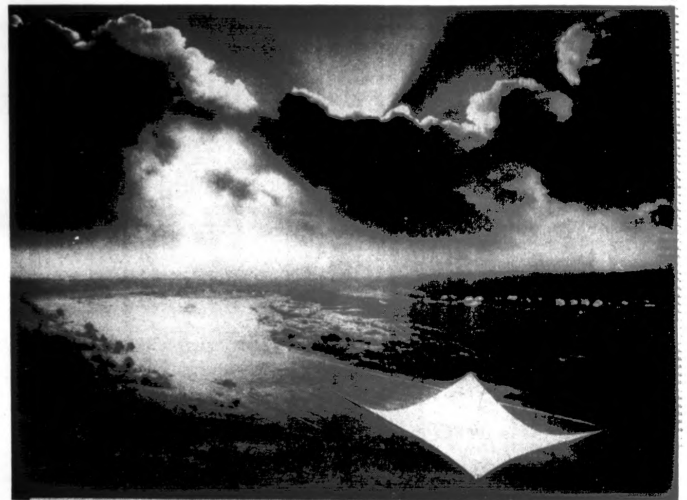
Valery Gvozdz (Kaunas)

(Kalba Vilnius Nr. 17, 1995 m. balandžio 28 – gegužės 5 d. laida)