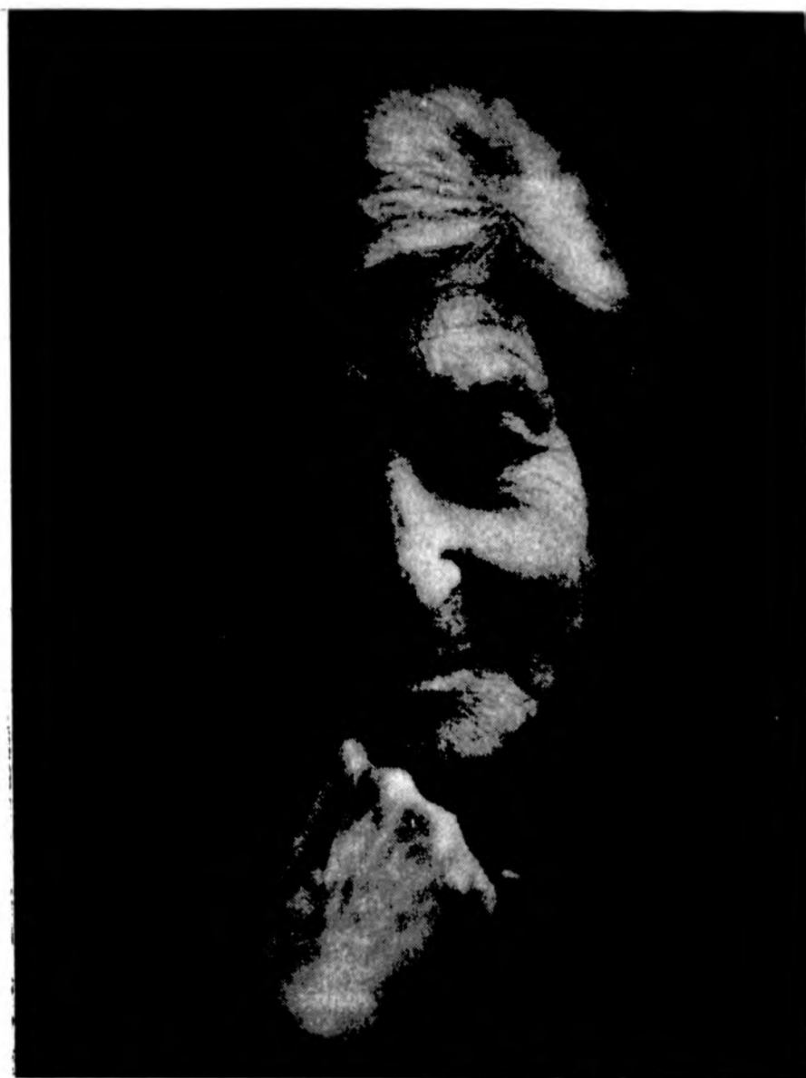
A. a. Marija Gimbutienė

Taip sutaikoma priešingybė yra pasikartojantis motyvas eilėraš-