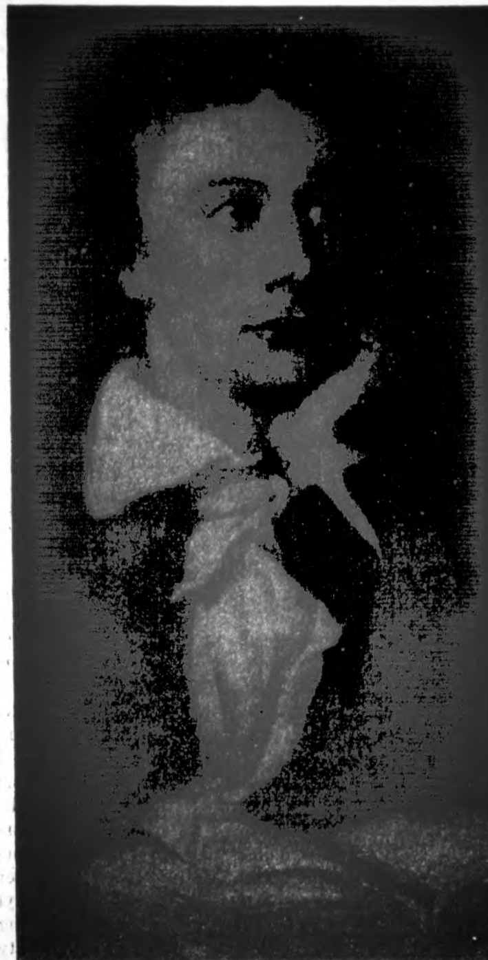
Poeto John Keats portretas, nutapytas William Hilton 1822 metais. National Portrait Gallery, London, Anglija.

Tamsoj tavęs klausaus, ir jau nesyk Pamilęs lengvą Mirtį aš buvau, Daviau jai eilėse saldžius vardus, Su ja siekiaus alsavimu ramiu. Rods šiandie mirti būtų man mieliau,