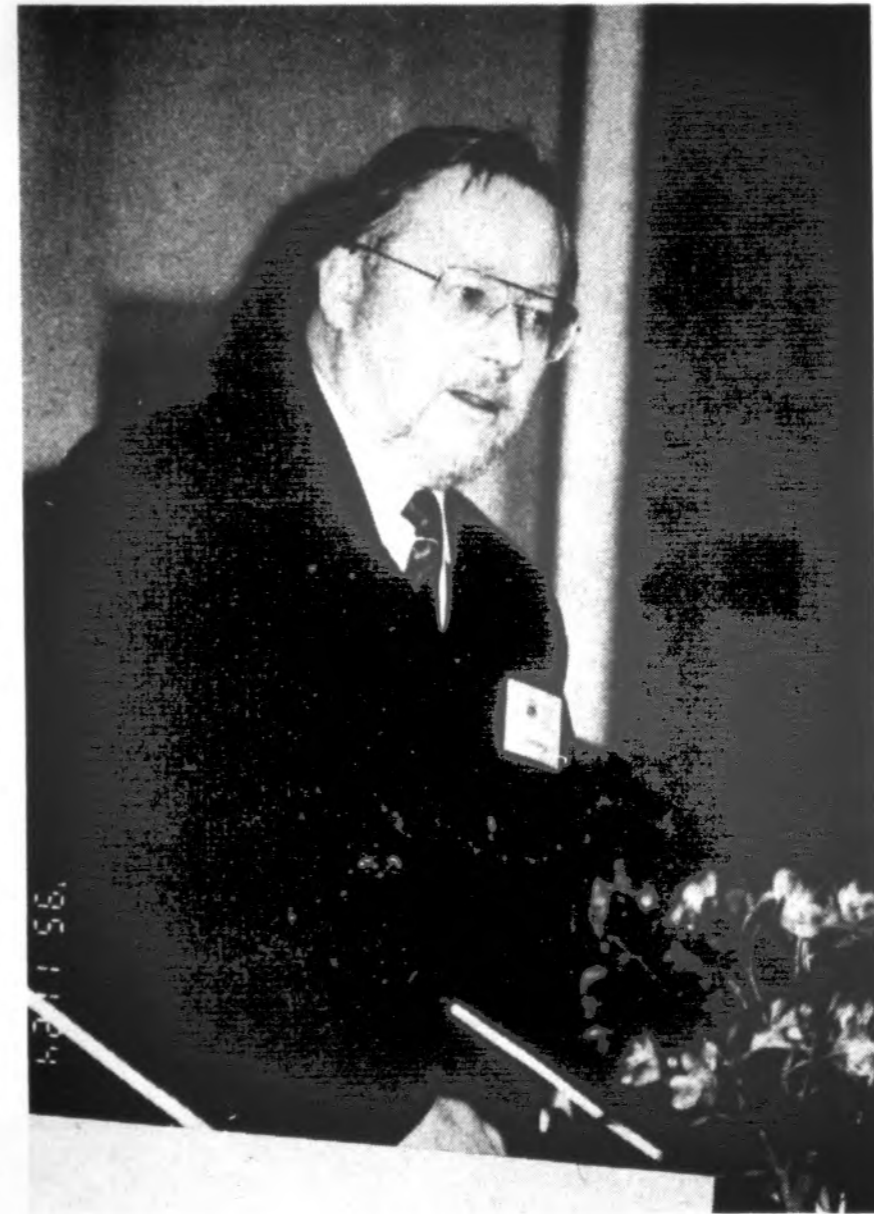
Vytautas Landsbergis kalba IX Pasaulio lietuvių mokslo ir kūrybos simpoziume, kuris vyko Vilniuje šiuo metų lapkričio 23-25 dienomis.