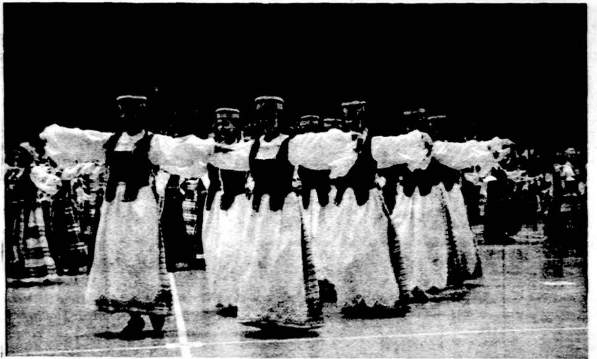
Panevėžio „Grandinėlis” šokėjos Dešimtojoje tautinių šokių šventėje.