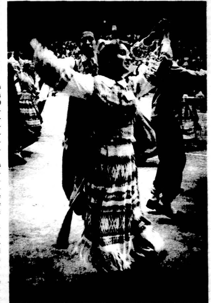
Dešimtoji tautinių šokių šventė