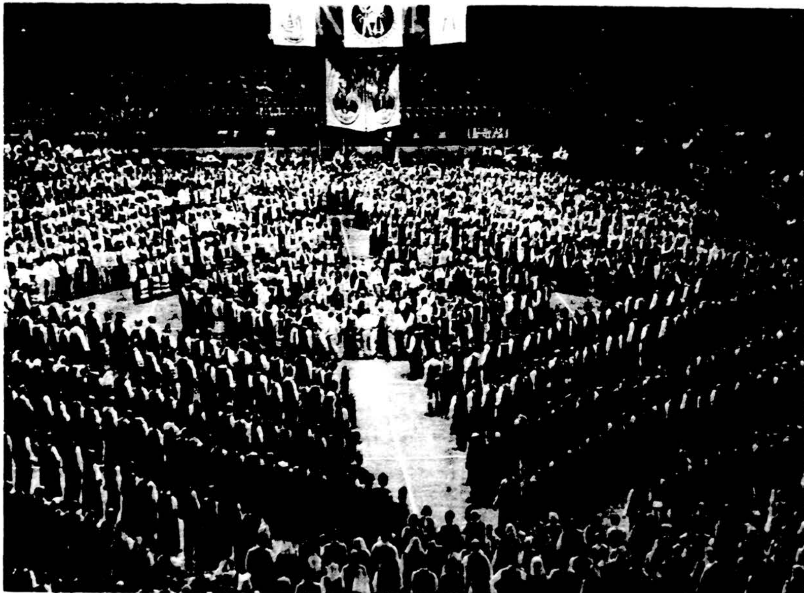
Dešimtoji tautinių šokių šventė 1996 m. liepos 6 d. Rosemont, Illinois.