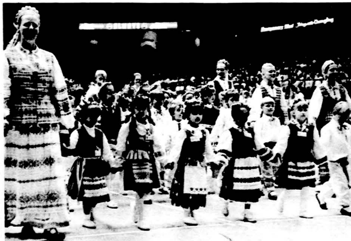
Į aikštę ateina mažieji šventės šokėjai.