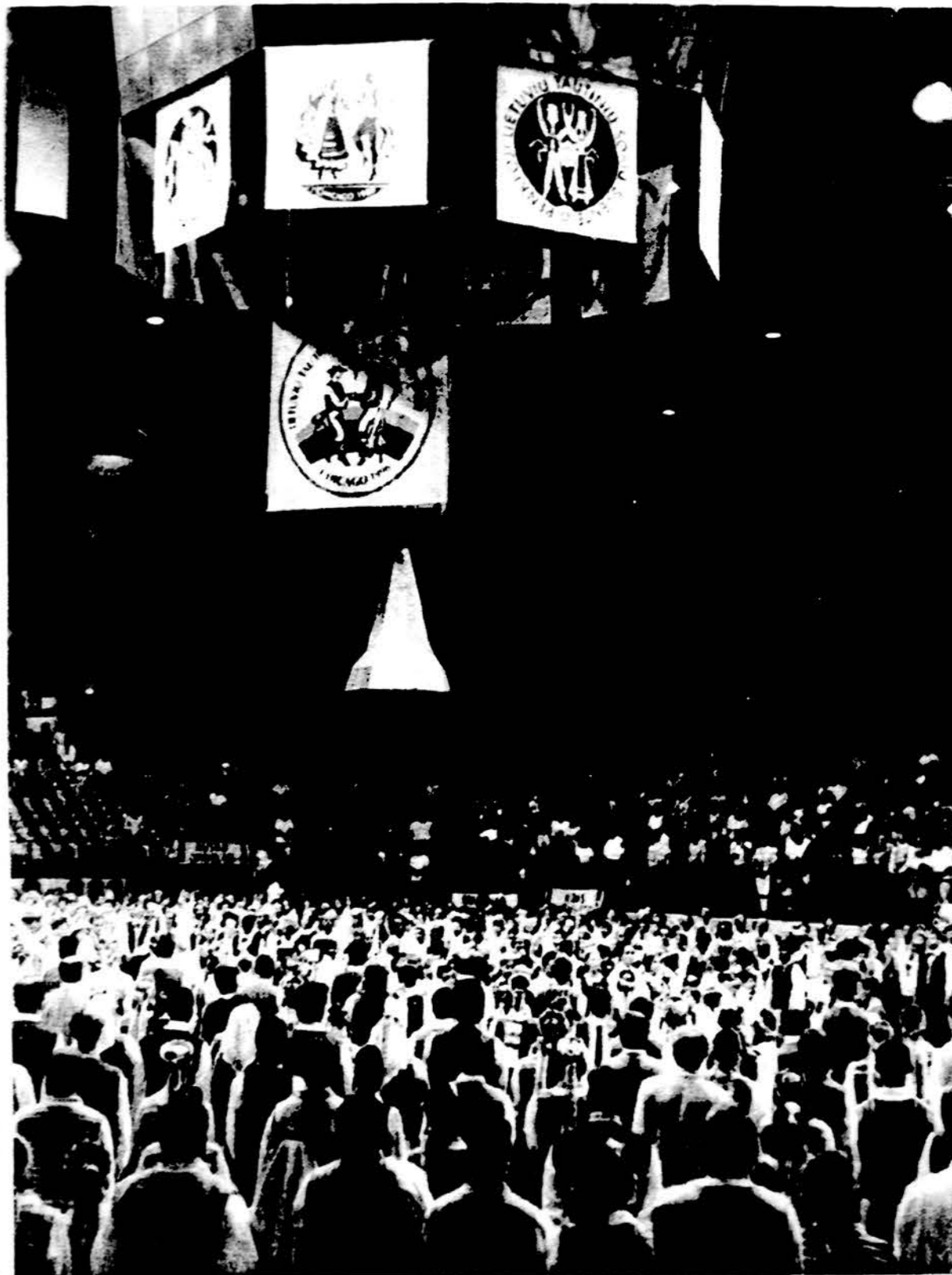
Atidaroma Dešimtoji lietuvių tautinių šokių šventė liepos 6 dieną Rosemont Horizon stadione.

Studentų ratelių šokami „Varkijietis“ ir „Slažo polka“ viesulu įsisuko į „Suktinį“. O juk tai paskutinis visų šventės šokis. Ir truputį pagailo, kad taip greit prabėgo visa šventė. Į aikštę susirinko visi šventės dalyviai. Skambant dainoms „Lietuva“ ir