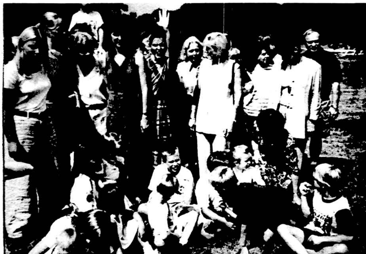
Būrelis didelių ir mažų Ateitininkų studijų dienų dalyvių rugpjūčio 30 – rugsėjo 2 dienomis „Dainavoje“.