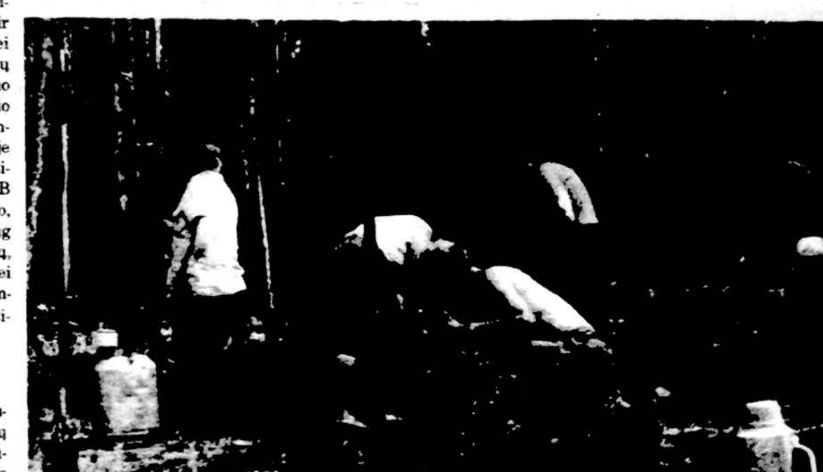
Viename Lietuvos miške tvarkoma vietovė, kur žuvo partizanai.