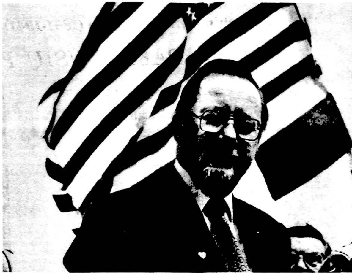
Vytautas Landsbergis Čikagoje

VYTAUTAS LANDSBERGIS: Mes įsitikinę, kad Lietuva, kaip valstybė, ir jos vyriausybė turi remti šeimos ūkį, turi remti ūkininkus, kurie Lietuvoje atsikuria labai sunkiai, o dažnai yra žlugdomi, net ir terorizuojami. Turėtų būti kitokia politika: ūkininkams turėtų būti teikiama reali parama ir apsauga. Parama — t.y. žemės gražinimas, kas buvo sustabdyta, iškraipyta, ir labai daug žmonių negali atgauti savo žemės. Ir žemės gražinimas ne tik tam, iš kurio žemė buvo atimta — juk grįžta iš Sibiro jo vaikai, vaikaičiai... Ir dar — kad jiems parama būtų teikiama lengvatinėmis sąlygomis duodamais kreditais — nes Lietuvoje ūkininkams iš bankų kreditai buvo siūlomi už nežmoniškus procentus. Tokie procentai tiesiog žlugdė ūkininkus. Kada Vyriausybė negarantavo jam nieko, nei jo derliaus surinkimo, nei kainų, kuriomis bus superkamas jo derlius. Ta lazda, kurią aš pavadinau ideologiniu nepalankumu ūkininkams, nes Šleževičiaus vyriausybė visą laiką šaukė, kad reikia remti bendrovės — šitaip pavadinus „kolchozų“ liekaną, truputį