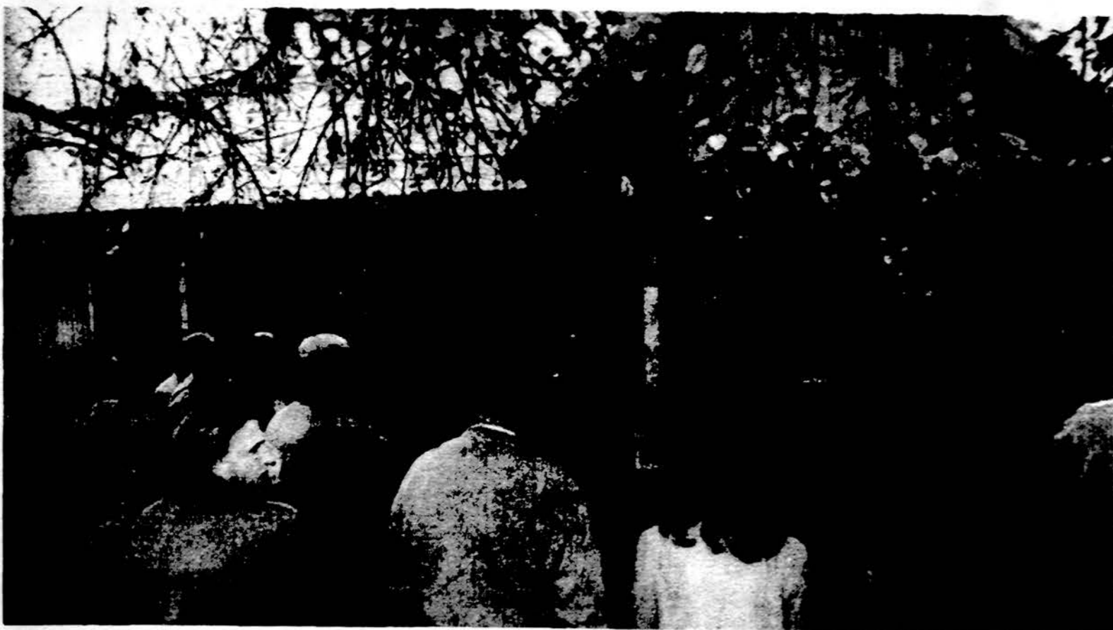
Druskininkuose: skatymai prie mados galerijos.