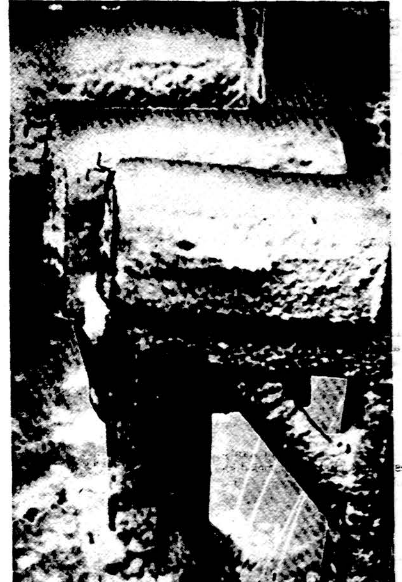
Džiugas Reneckis „Tavo laiško belaukiant“