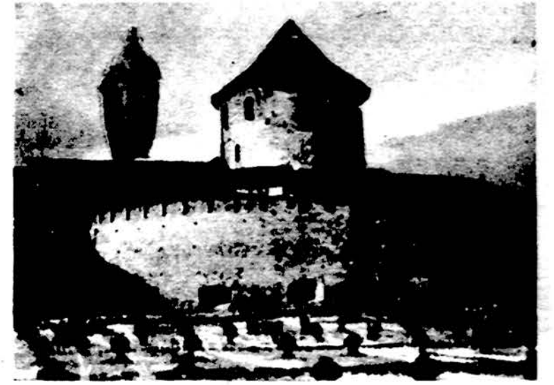
Saulius Višinskas „Nepriklausomybės kalnas“