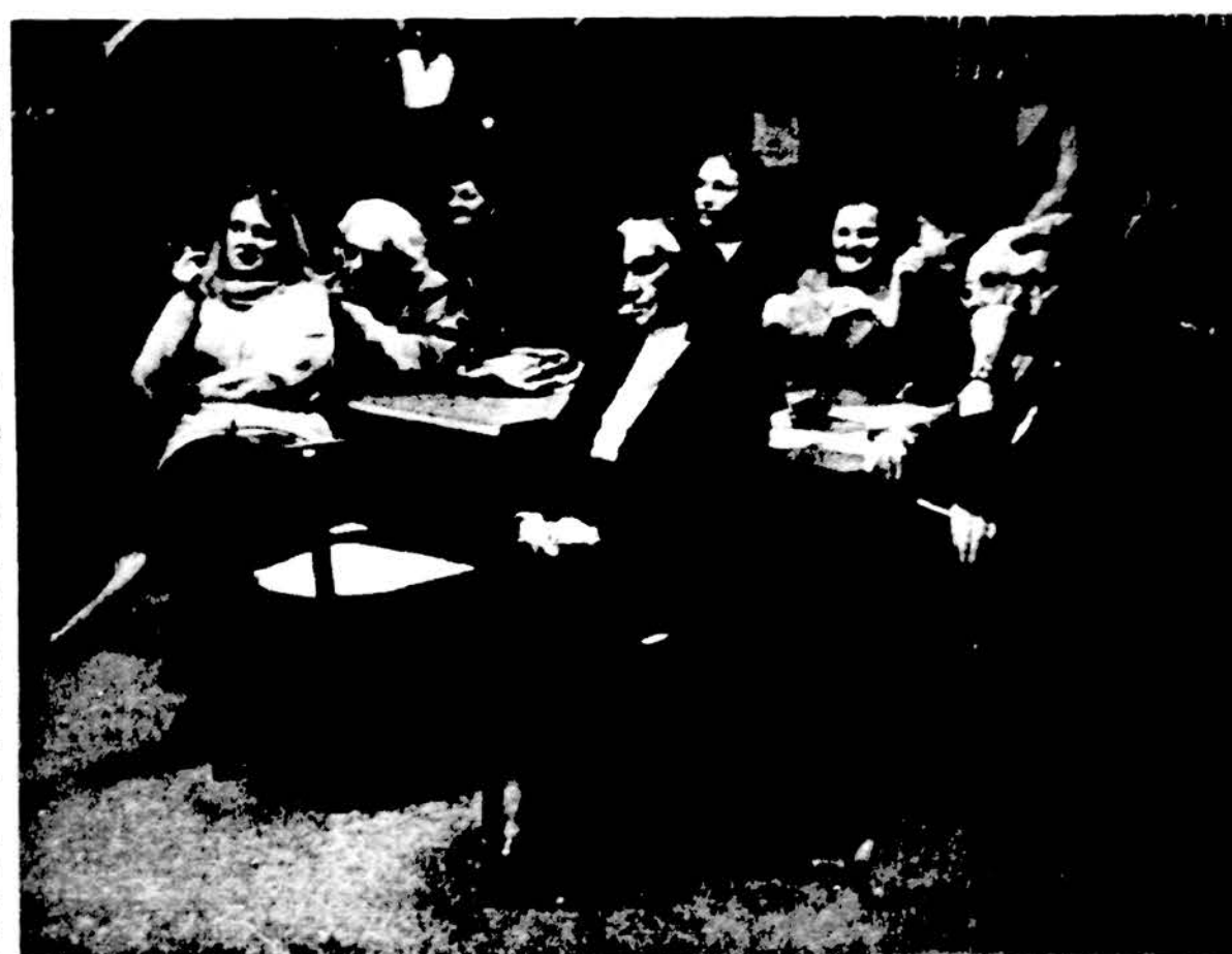
Dalis Ateities savaitgalio literatūros vakaro klausytojų Jaunimo centro kaviniėje.