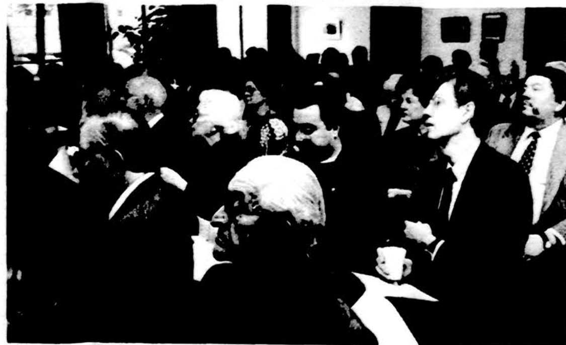
Dailės klausytojai Ateities savaitgalio šeštadienio popietėje, Čiurlionio galerijoje, Jaunimo centre.