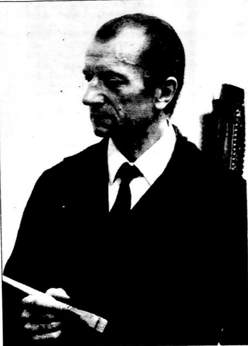
Dail. Vytautas Kasiulis.