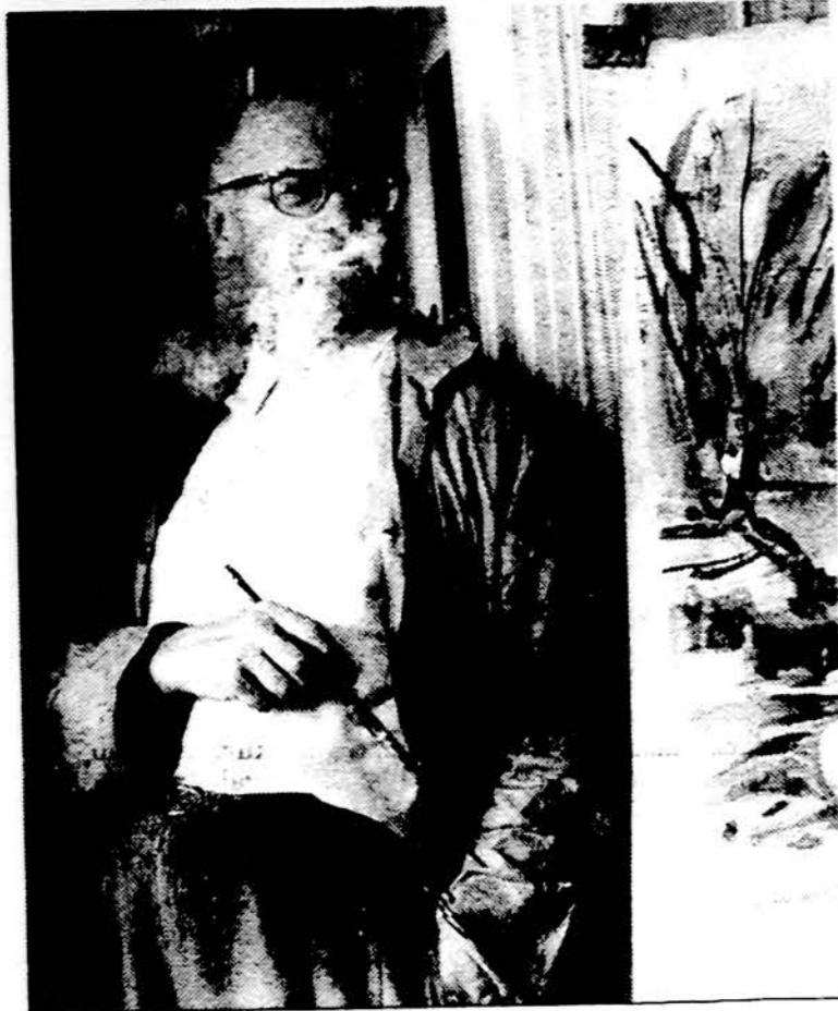
Dail. Adomas Galdikas.

Adomas Galdikas — impulsyvus gyvenime, saikingas ir lyriškas savo dailės darbuose, ypač Lietuvos krašto peizažuose: trobelės, pakelės kryžiai, medeliai. Parodoje eksponuotas paveikslas — iš paties vėliausio laikotarpio (paveikslas data nepažymėta), kada atsiskleidžia realistinio stiliaus, dailininkas pasuko abstraktumo link. Ar tai buvo pats brandžiausias Galdiko kūrybos etapas, daug kas suabejoja. Teisinga dailininką akių susilpnėjimu senatvėje: