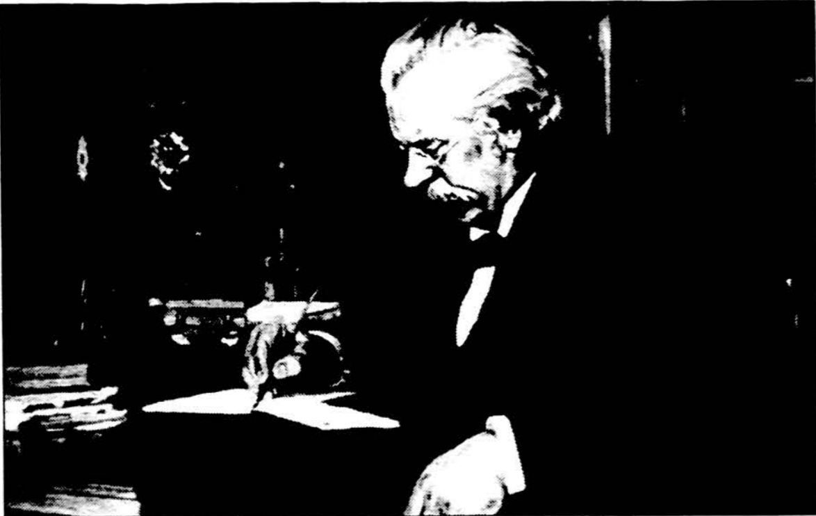
Prano Mašiotas portretas. Dail. Adomas Varnas.