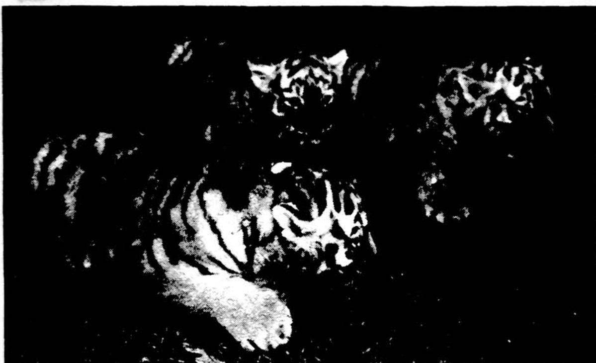
Trys tigrai — geriau sakant, tigriukai — Kauno zoologijos sode. Jeigu solistai gali pasivadinti „tigrais“, galbūt tigriukai užsinorės vadintis solistais...