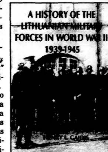
A HISTORY OF THE LITHUANIAN MILITARY FORCES IN WORLD WAR II 1939-1945