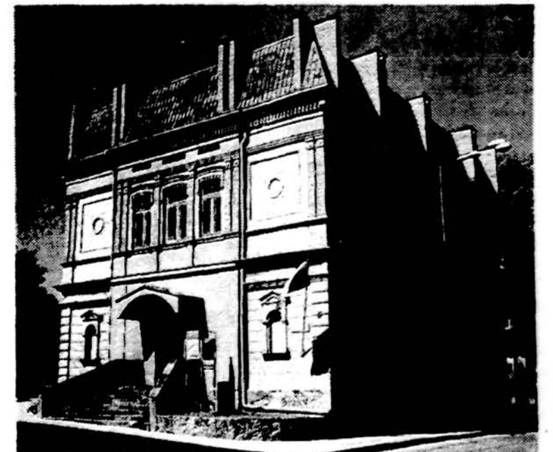
Panevėžio kraštotyros muziejaus pastatas.