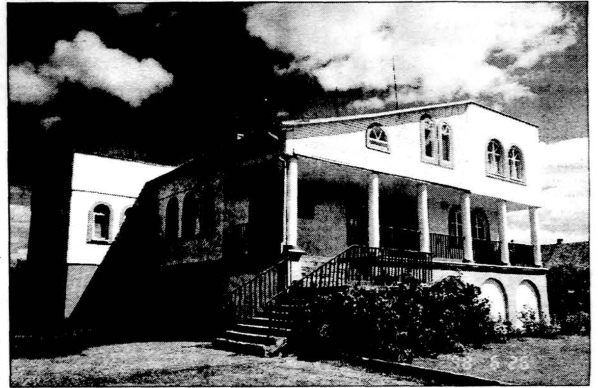
Zanavykų muziejus Šakiuose.