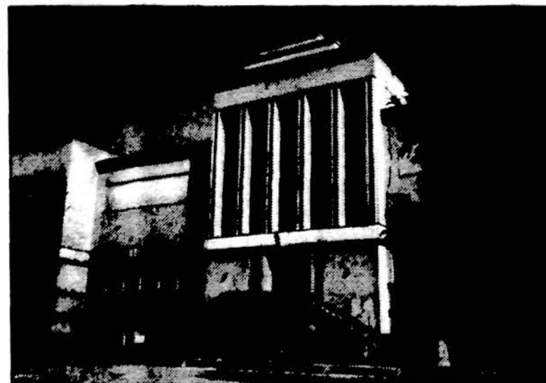
Vytauto Didžiojo muziejus Kaune.