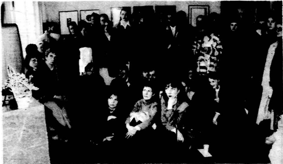
Parodos lankytojai stebi ekrane rodomą J. Meko filmą „Laiškas iš savęs“.