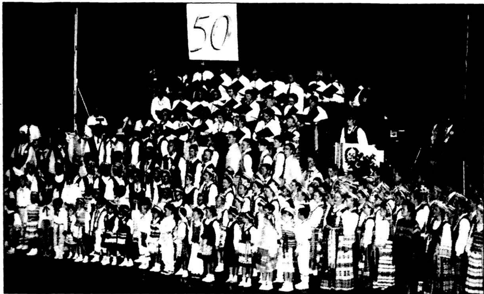
Jungtinis choras „Spindulio“ 50 metų sukaktuvinėje šventėje.