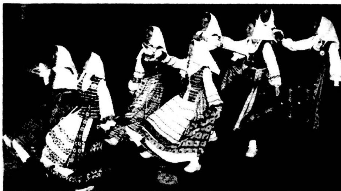
Spindulietės šoka „Trapuką“.