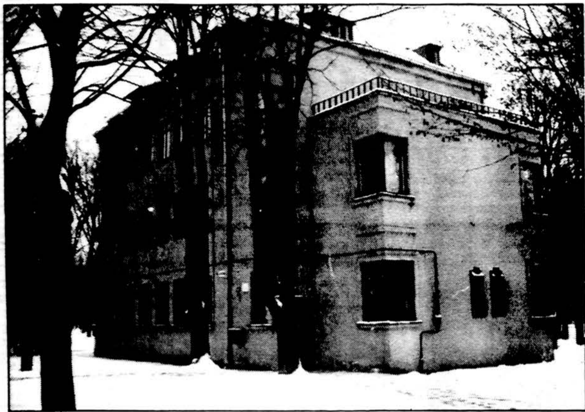
Nacionalinio M. K. Čiurlionio dailės muziejaus A. ir P. Galaunių namai Kaune, Vydūno al. 2.