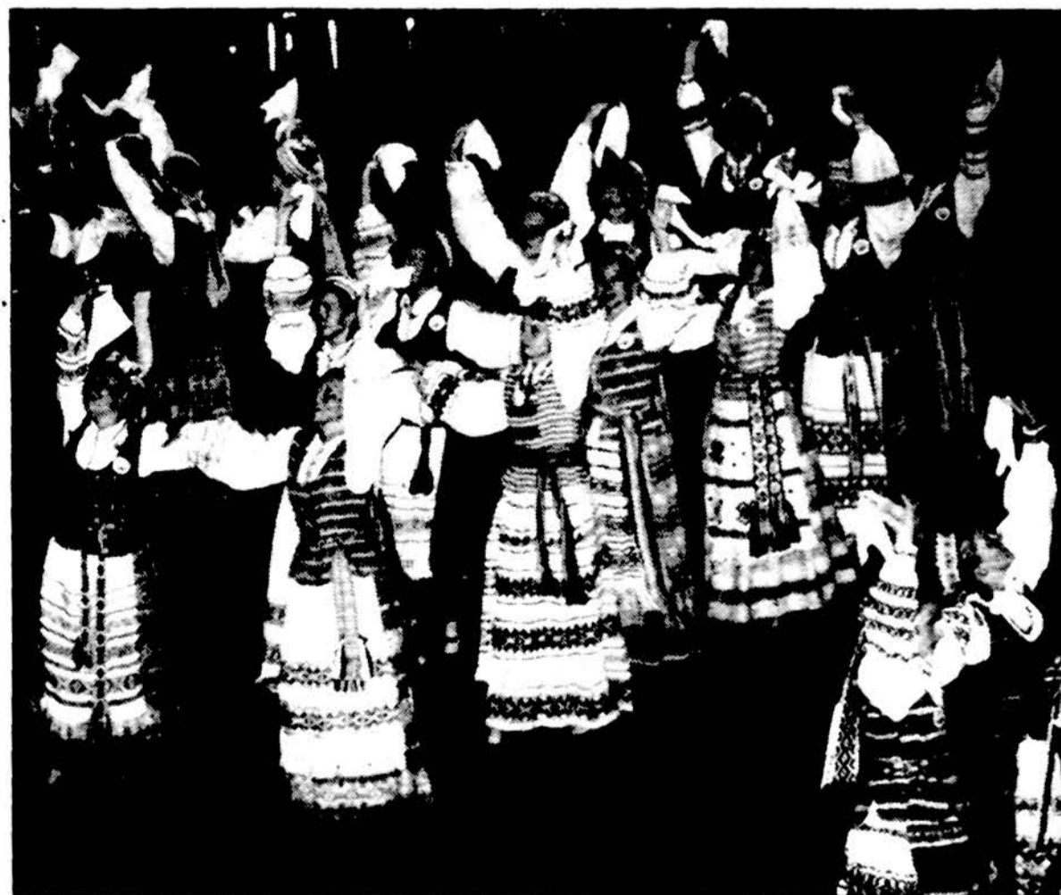
LB Los Angeles jaunimo ansamblio merginos šoka „Blezingele“ jubiliejinėje „Spindulio“ šventėje.