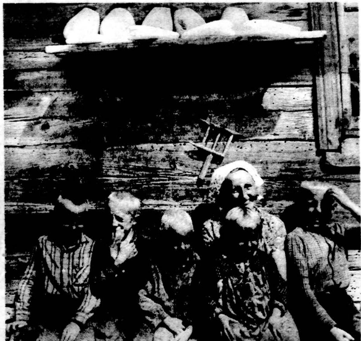
Lietuviška šeimyna Aukštaitijoje 1997 m.