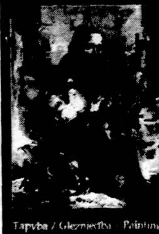
Tapyba / Gležneštva / Pildymas