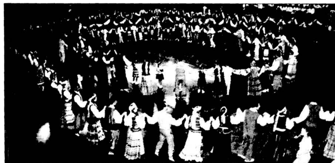
Visi „Spindulio“ sukaktuvinės šventės dalyviai buvo „išukti“ į paskutinį programos ratą. Šventę vyko Hollywood Palladium salėje.