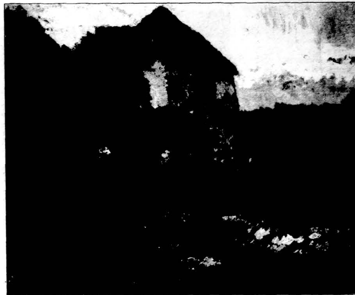
Povilas Puzinas. „Suikės karėma“. 1932