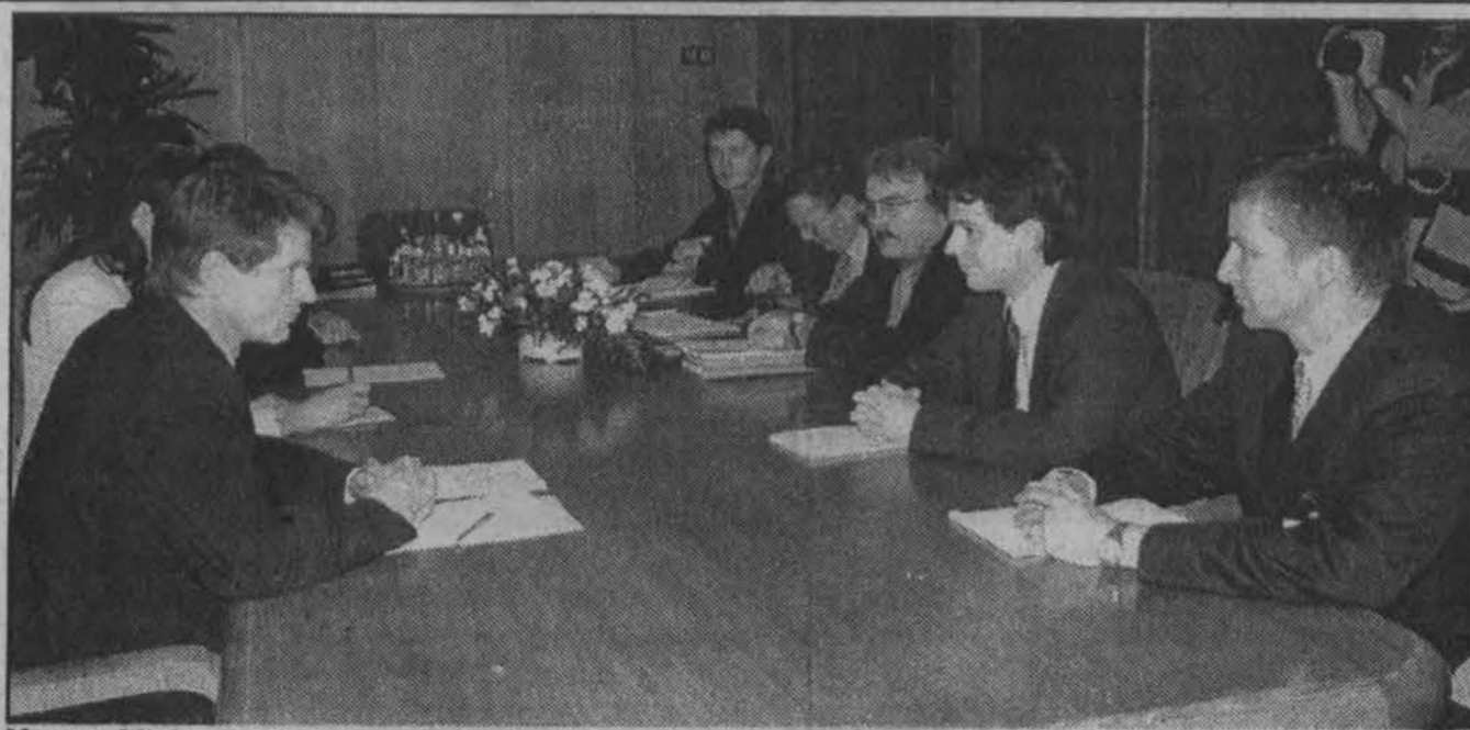
Ministras pirmininkas Rolandas Paksas (kairėje), susitikęs su Pasaulio banko atstovais Lietuvoje, patarė svarbiausias Lietuvos finansines problemas, jų sprendimo galimybes.