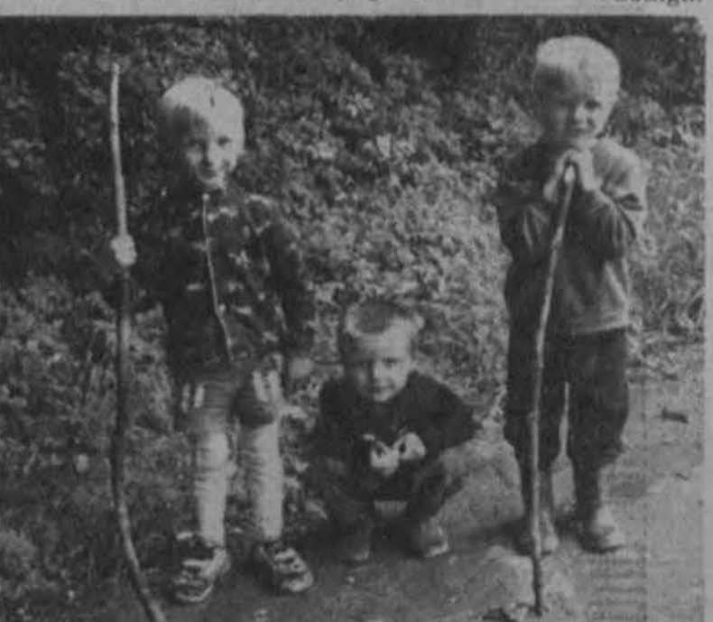
Šie trys Lietuvos kaimo vaikai, maloniai patelėję vasaros dienas tėviškes laukuose, galbūt nesirūpiną mokykloms, mokslo, savo ateitimi, bet kiekvienam lietuviui visa tai rūpi, nes kokios bus Lietuvos mokyklos, tokia ir lietuvių tautos ateitis.

polonofiliski personažai ir kovos su etnocentrizmu ekspertai“ („Apžvalga“, 1998 m. Nr. 20). Visi strateginiai auklėjimo-švietimo postai „moderniųjų“ kosmopolitų buvo užimti ne be LKDP pagalbos. Pabaiga.