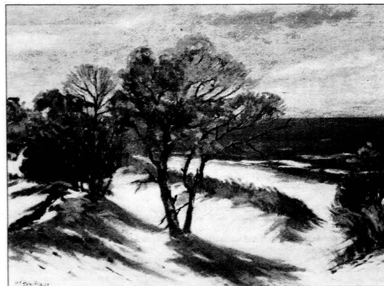
Mykolas Šileikis. „Michigan ežero pakrantė“.