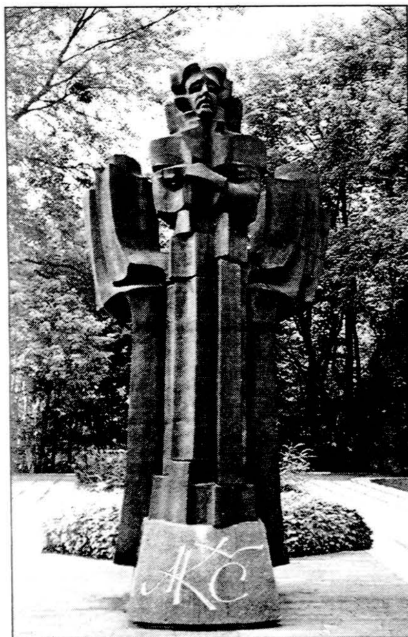
Paminklas M. K. Čiurlionii Druskininkuose.

Dažnai buvo bandoma interpretuoti, kodėl Čiurlionis, baigdamas Leipzigo muzikos studijas, perėjo į tapybą. Abu menai reikalavo skirtingų priemonių ir priėjimų, bet kažkodėl, jo laikotarpis susizavėjo menų integracijai ir labai puoselejamam sociologijos studijose. Čiurlionis gyveno gan komplikuotą laikotarpį, kur visi menai ieškojo naujų formų ir skolinosi vieni iš kitų, todėl poezija ir teatras, baletas ir opera, fotografija ir filmas, muzika ir dailė buvo kuriami kartu. Pastebėkim Čiurlionio žodyną paveikslų pavadinimuose ir poezijos bandymuose. Beaudelaire ir Mallarme buvo geriausi dailininkų interpretatoriai ir