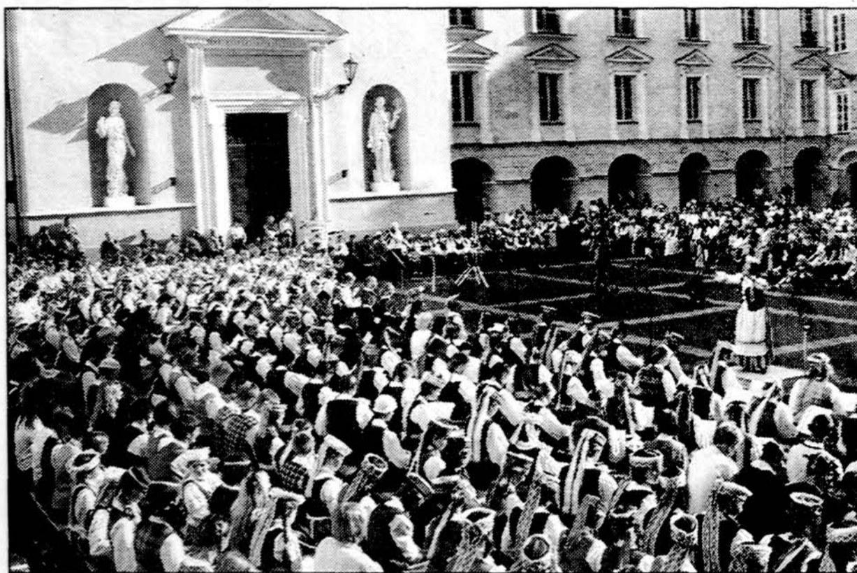
Lietuvos dainų šventė „Skambėkite kanklės“ 2004 m.

Birželio 30 d. prasidėjo pučiamųjų orkestrų ir šokių grupių konkursai, o vakare Domo aikštėje įvyko vokalinės simfo-