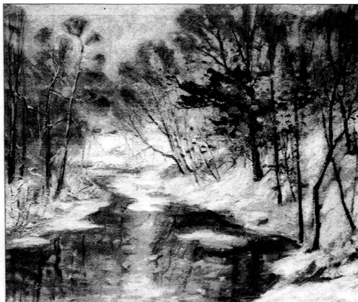
Mykolas Šileikis. „Des Plaines upė žiemą“.

Plačiai savo kūryba žinomas menininkas priklausė „Alumni Association of the Art Institute of Chicago“, „Artists League of the Art Institute of Chicago“, „Hoosier Salon of Indiana“, „All-Illinois Society of the Fine Arts“, „Chicago Eguite Society“ organizacijoms, buvo vienas pagrindinių Lietuvių dailininkų sąjungos ir Čiurlionio galerijos steigėjų, Lietuvių dailininkų sąjungos pirmininkas, Čiurlionio galerijos vicepirmininkas ir Meno tarybos vadovas. Už geriausius tapybos ir skulptūros darbus įsteigęs Premijų fondą Čiurlionio galerijoje, Inc., savo meno lobį jai paliko saugoti ir tvarkyti.