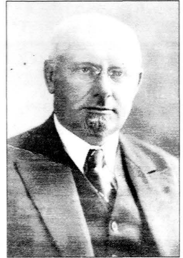
Antrasis Lietuvos Respublikos prezidentas Aleksandras Stulginskis.

—Jūs skambinote, norėdama perspėti tėvus? —Taip, bet nepavyko. Iš mūsų apylinkės išvežė tiktai