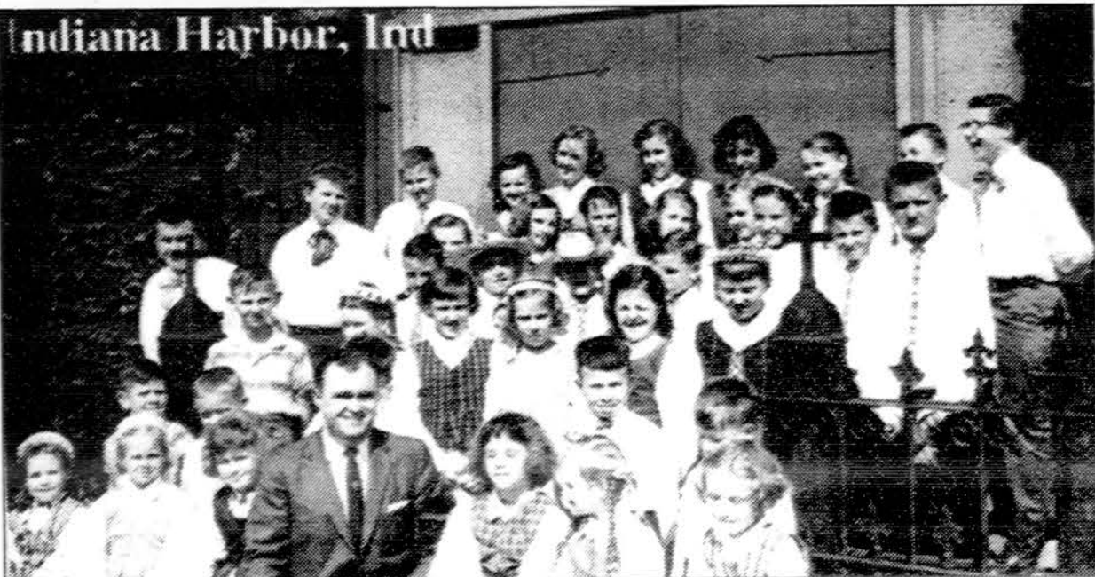
Šv. Pranciškaus lietuvių parapijos lietuviška mokykla Indiana Harbor, IN.