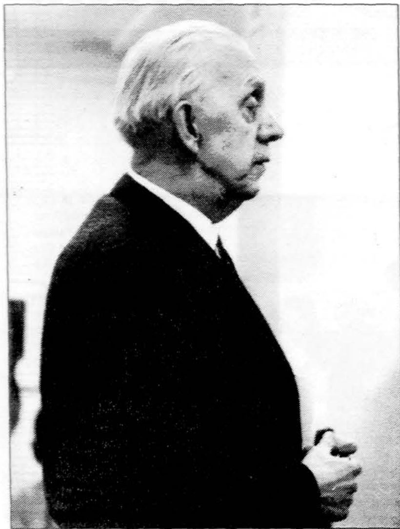
Aktorius Stasys Pilka.