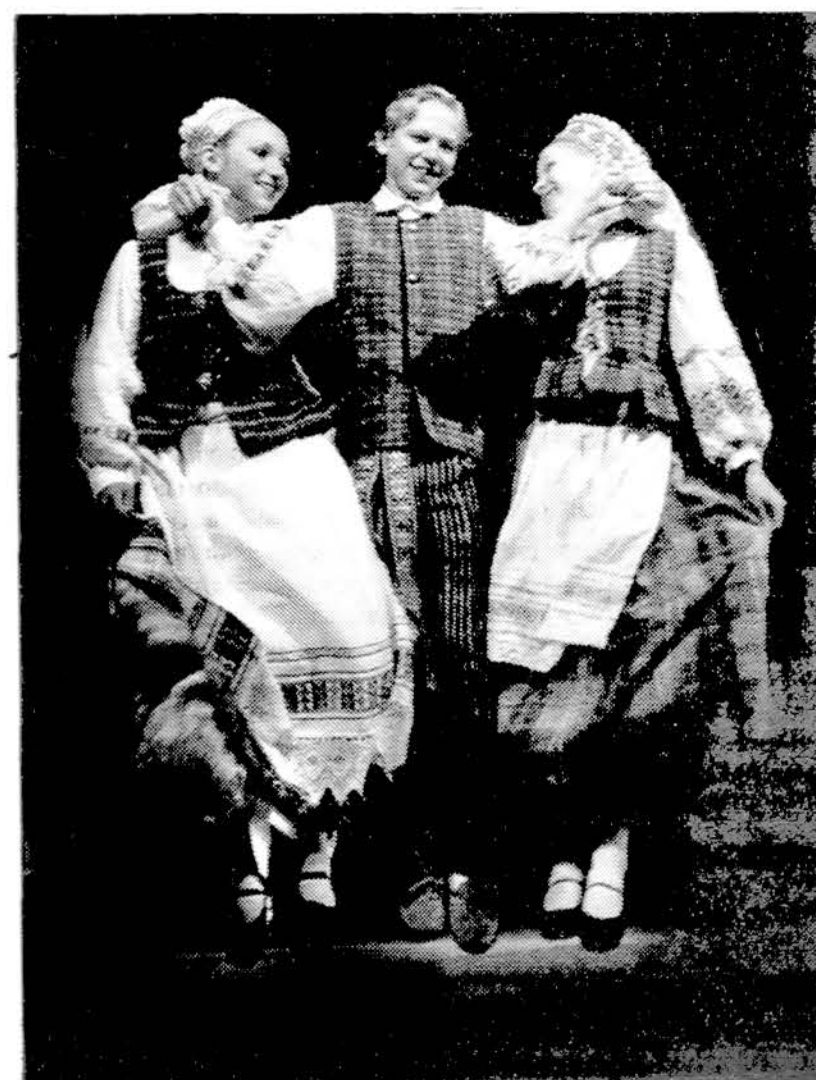
„Grandies“ sukakutinės šventės akimirkos.