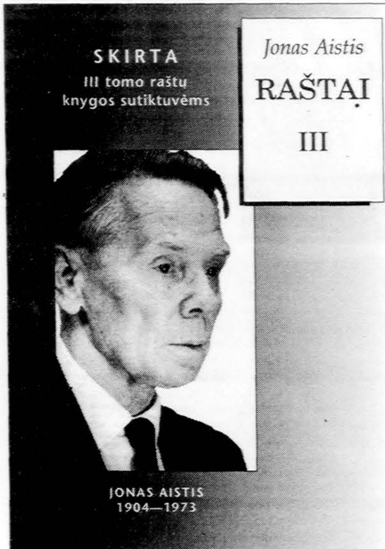
Jono Aisčio Raštų III tomo sutiktuvėms popietės programos viršelis.